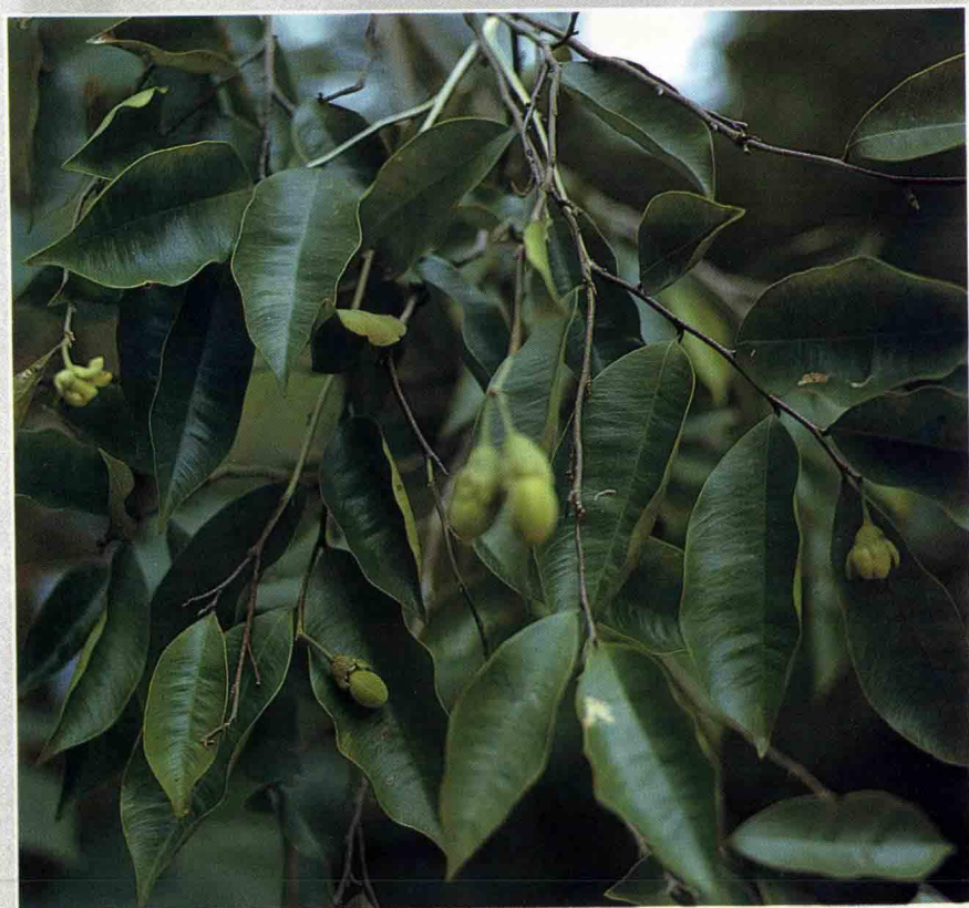
白 木 香