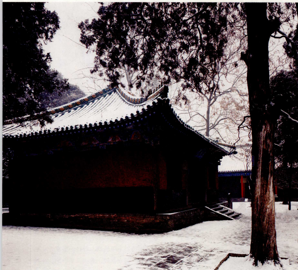
立雪亭，又称达摩亭。今殿为明正德七年（公元 1512 年）后建成，后经多次维修。