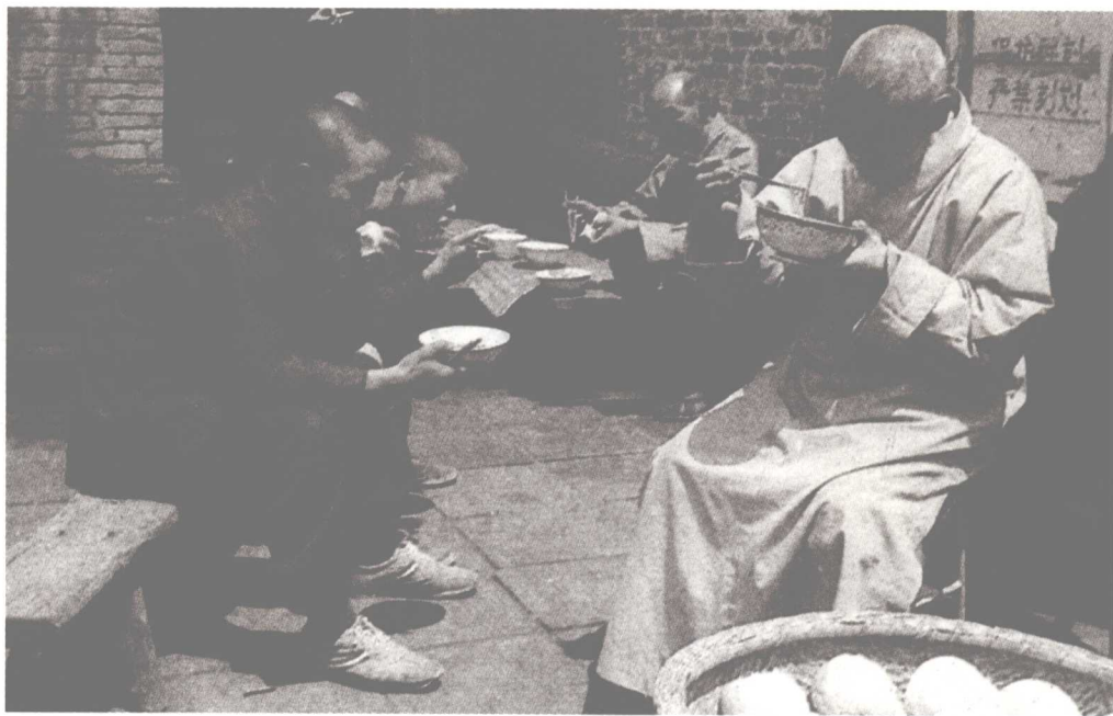
当年的少林寺，佛堂破败，僧众离散，生活十分清苦。摄于1985年。