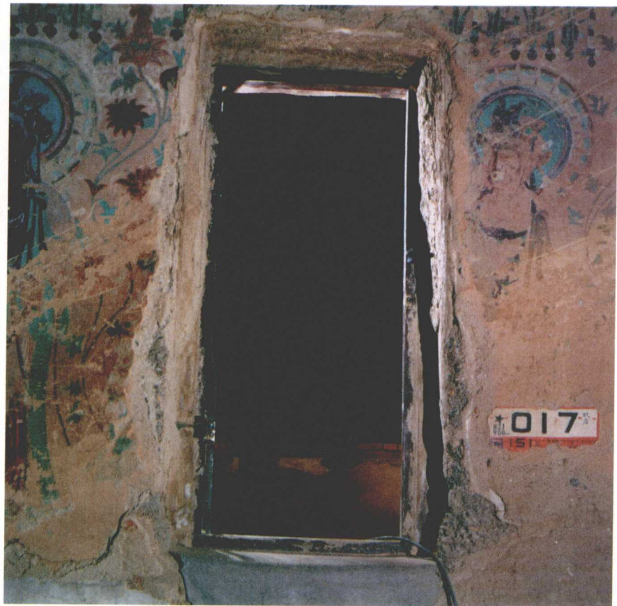
0-1 敦煌藏经洞◀ 藏经洞是莫高窟17窟的俗称。1900年发现约5万件中世纪佛经、文书、法器以及艺术品等文物而闻名于世。

大、内容极为丰富的珍贵数据，被誉为“中古时代的百科全书”、“古代学术的海洋”。与殷墟甲骨文、汉简、明清档案，被誉为中国近代古文献的四大发现，由藏经洞引发的敦煌学更是成为一门国际显学，学术价值于此可见。