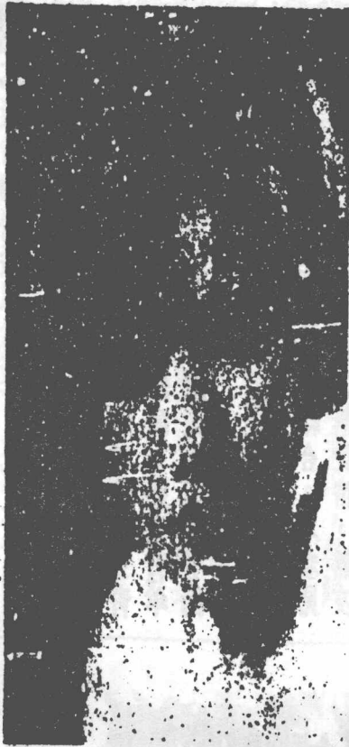
同德醫學院藥房女工

每個少女到了成熟時期，本能地要從異性找到一些安慰，以滿足自身慾望——這種慾望不是世俗所憎憐的那種抽象名詞：却是每個少女所有的純潔的具體事實。但是，在這種企求中，竟往往把自己裝飾得注目；但在接近異性時，却又在羞怯的包圍着，不敢顯露直率的感情，結果弄到自己脆弱的理智和興奮的精神萎靡徬徨了。