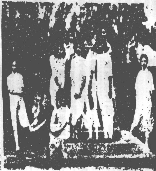
工部局女中，在一年的歷史中，已給予人們極好威念；圖為該校師生，遊兆豐公園之影

於靈的地位；並且有許多兩性，因了同情的互慰而戀愛，在對於肉的殘疾者是不可能的，所以在戀愛的真諦下，還可加上一句——「肉」在戀愛中並不是主要的。 五、如答四所說，故愛情是不能濫施的，那些濫施者與朝三暮四者，只不過濫施其「淫」而已。（未完）