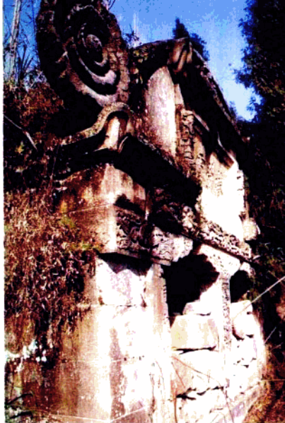
▲ 峰顶山下古墓群上的牡丹石雕