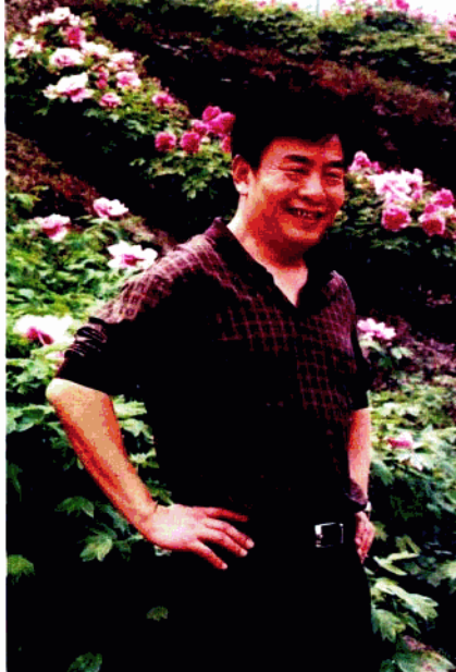
▲ 重庆市市长王鸿举视察垫江牡丹