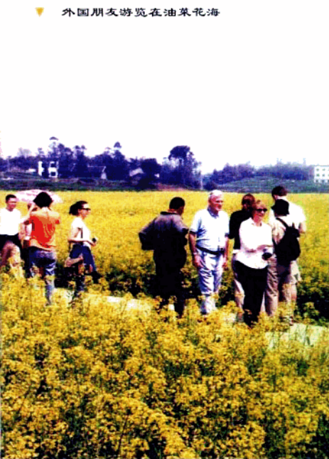
▼ 外国朋友游览在油菜花海