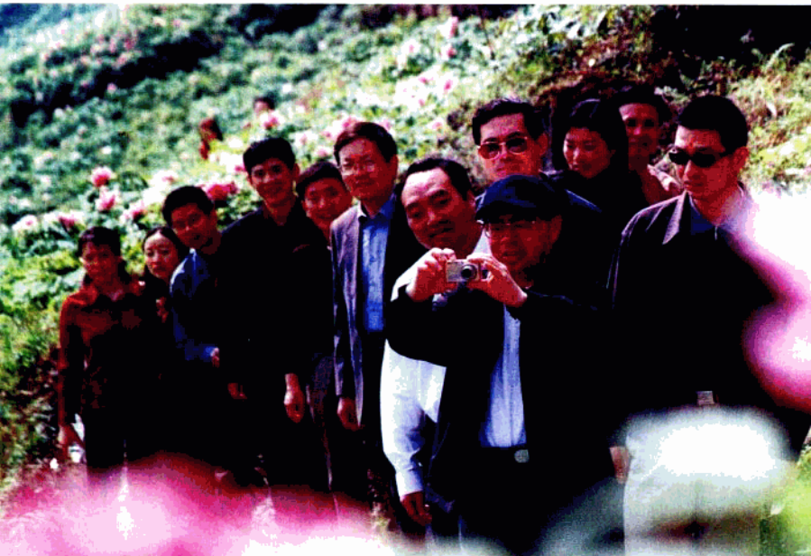
▼ 原中共重庆市委书记黄镇东视察垫江牡丹