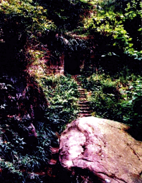
▲ 历经沧桑的明月山中嘴寨古寨门遗址