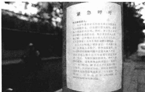
部分投资人张贴“呼吁书”,呼吁受害者团结起来挽回损失(摄于 2005 年 7 月 10 日)