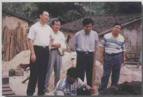
省委办公厅领导经常深入基层，调查研究，指导工作。图为省委常委、秘书长钟文同志(右二)陪同省委书记、省人大常委会主任杜青林同志(左一)，深入到省委办公厅和省邮电管理局联手扶贫点(琼中黎族苗族自治县红毛镇)的黎村苗寨视察扶贫工作。