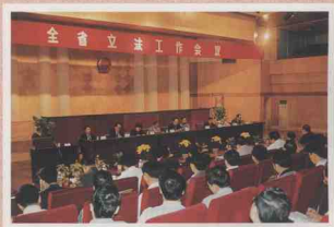
省人大常委会召开全省立法工作会议，省委书记，省人大常委会主任杜青林出席会议并讲话。