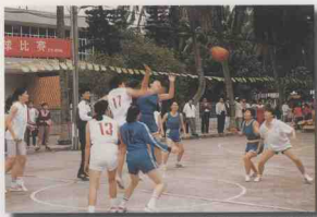
开展丰富多彩的文体活动，活跃机关文化生活，促进机关精神文明建设。图为省委办公厅女子篮球队参加“三·八”篮球赛。

对公路规费、粮食体制、企业脱钩和农业部门职能转变等四项改革工作开展重点督查，对省第三次党代会贯彻落实情况开展督查调研；对减轻农民负担工作以省委办公厅文件下发通知，对省委三届二次全会精神开展督促检查，抓紧100万亩椰林工程的落实、土地延包工作的督促检查，编发《督查情况》12期，及时向省委反馈督查内容。三是专项查办工作取得了良好成效。对于涉及多个部门的查办件，认真做好牵头、协调工作；对涉及问题比较复杂的查办件的查处，深入基层直接进行督查调研。年内共办理中办秘案件3件，以省委办公厅文件向中办及中央领导报送了查办结果。办理省委主要领导批示件12件，通过《领导批示查办情况》和《督查情况》报送了查办结果，做到件件有着落，事事有回音。