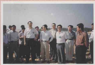
省委书记、省人大常委会主任杜青林，省人大常委会秘书长徐经国，在万宁市山根乡检查海防林等海洋生态环境资源保护情况。

常委会重视加强与市县人大之间的联系，通过共同调查研究、执法检查、举办培训班和召开研讨会、座谈会等方式，沟通情况，研究对策，推动各市县人大工作的开展。市县人大对省人大常委会委托协助办理的有关事项给予了很大的支持。常委会主动争取全国人大的指导，密切与兄弟省市人大之间的联系，学习交流立法、监督、人大理论研究等方面的经验。