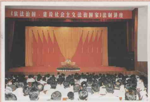
为加强法制学习，每次常委会会议都安排一次法制讲座。