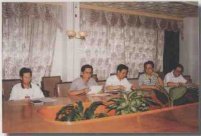
中共海南省委办公厅领导班子是一个团结、务实、廉洁、高效的领导集体。在省委常委、秘书长钟文(左三)率领下，坚持讲学习、讲政治、讲正气，认真学习，当好省省委的参谋和助手。图为班子成员正在开会研究工作。

1998年，海南省委办公厅在省委的直接领导下，高举邓小平理论伟大旗帜，全面贯彻党的十五大、十五届三中全会和省第三次党代会精神；紧紧围绕党的中心工作，突出重点，加强政务服务，求真务实，开拓进取，充分发挥整体功能，确保省委日常工作正常高效运转，有效地发挥了省委的参谋助手作用。