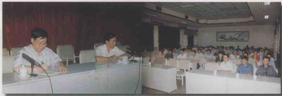
中共省委办公厅举行“三讲”学习、辅导报告会。

众办好事实事的10个重大事项，促进全省各部门、各市县积极参与这项活动，得到广大人民群众的普遍欢迎和好评。三是积极参与联手扶贫活动。参与了全省联手扶贫方案的制定、整个活动的协调以及扶贫进展的检查督促等工作，促进全省86个单位派出工作组联手扶贫45个贫困乡镇的工作全面铺开，促使16万人脱贫。与省邮电局联手扶助琼中县红毛镇，圆满完成该镇1998年下半年各项预定扶贫工作指标，取得良好效果，获得省委、省政府表彰。四是大力推进机关优质服务活动。通过具体的组织督促工作，推动各级党委、人大、政府、政协以及法院、检察院，在履行职责中下大力气改进工作作风，提高办事效率，为社会各界、为人民群众提供优质服务。并牵头在省级机关开展了为期一个月的作风整顿，促进了机关作风的较大转变，为改善投资环境奠定了良好基础。五是组织召开全省理论研讨会。省四套班子和各级党政主要负责及专家学者、企业家代表180多人到会，提供论文150篇，其内容总体上体现了实践性、理论性、政策性的统一，起到了交流思想、开拓思路、相互启发、提高认识的作用，也为我省跨世纪的发展提供了思想理论准备。