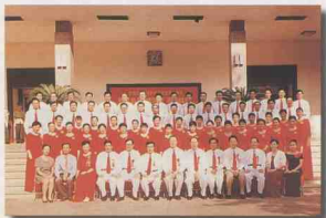
省委书记杜青林等领导同志与参加省直机关唱颂“歌咏比赛”人员合影。