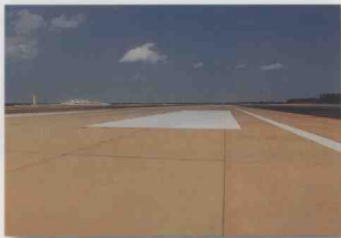
协助省领导做好美兰机场出口路征地工作

1998年，省政府办公厅在省委、省政府的直接领导下，高举邓小平理论伟大旗帜，认真学习党的十五大、十五届三中全会和省第三次党代会文件，同心协力，求真务实，较好地完成了各项任务。