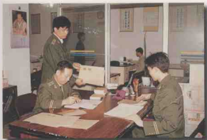
“政治上忠于职守，工作上万无一失，业务上精益求精，思想上无私奉献”。海南省委办公厅机要交通处连续6年荣获中共中央办公厅机要交通局业务质量竞赛“优胜单位”称号。图为机要交通人员为了保证党的核心机密上传下达，一丝不苟地进行业务工作。