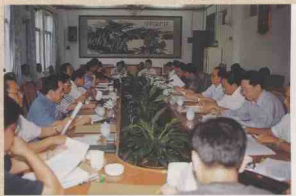
省政协提案委员会积极探索提案办理工作新途径。图为提案委员会首次举行承办单位与提案单位、提案人面对面公开答复会现场。