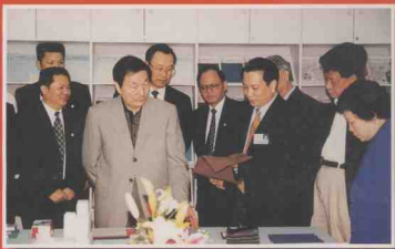
朱镕基总理考察海南

12月18日至22日，朱镕基总理在海南考察工作，要求继续认真贯彻落实邓小平关于创办经济特区的思想和中央确定的一系列重要方针、政策，总结经验，汲取教训，抓住机遇，奋力拼搏，把海南建设成椰林茂密、遍地葱绿、鲜花盛开、环境优美、交通发达、电讯畅通、文明法治的宝岛。图为朱总理(前排左二)视察海南欣龙无纺实业有限公司。