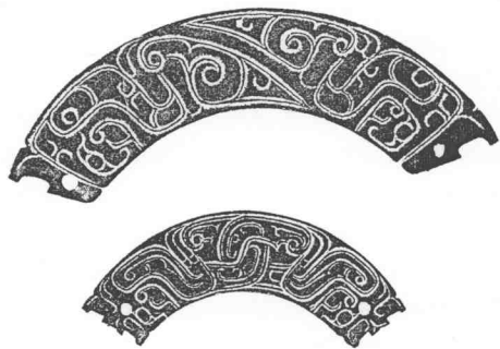
插圖2 商周雙綫並列的對比