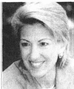
Carly Fiorina 卡莉·菲奥里纳

卡莉·菲奥里纳是惠普公司的主席兼首席执行官。在加入惠普前，她在美国电话电报公司和朗讯公司工作了近 20 年的时间，担任营销和市场方面的高级领导职务。还在担任朗讯全球服务供应商事务总裁时，她不但为朗讯公司拓展了国际业务范围，还是朗讯首次出售公众证券以及后来从美国电话电报公司进行股本转移脱离的策划人和执行先锋。她也是思科公司的董事会成员之一。菲奥里纳曾获斯坦福大学的中世纪历史和哲学学士学位，马里兰大学的商业管理硕士学位，以及麻省理工大学斯龙学院的理科硕士学位。