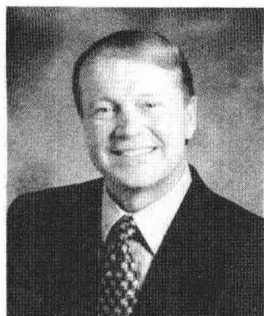
John Chambers 约翰·钱伯斯