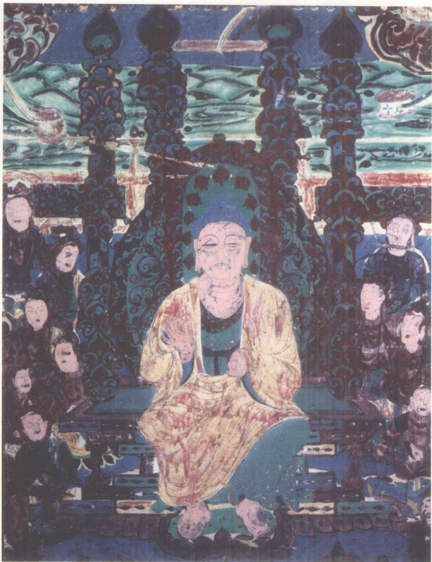
0-1 弥勒佛 此为倚坐说法弥勒，表示三会之一。背景描绘成净土，与西方净土变类似。 初唐 莫高窟341窟 北壁