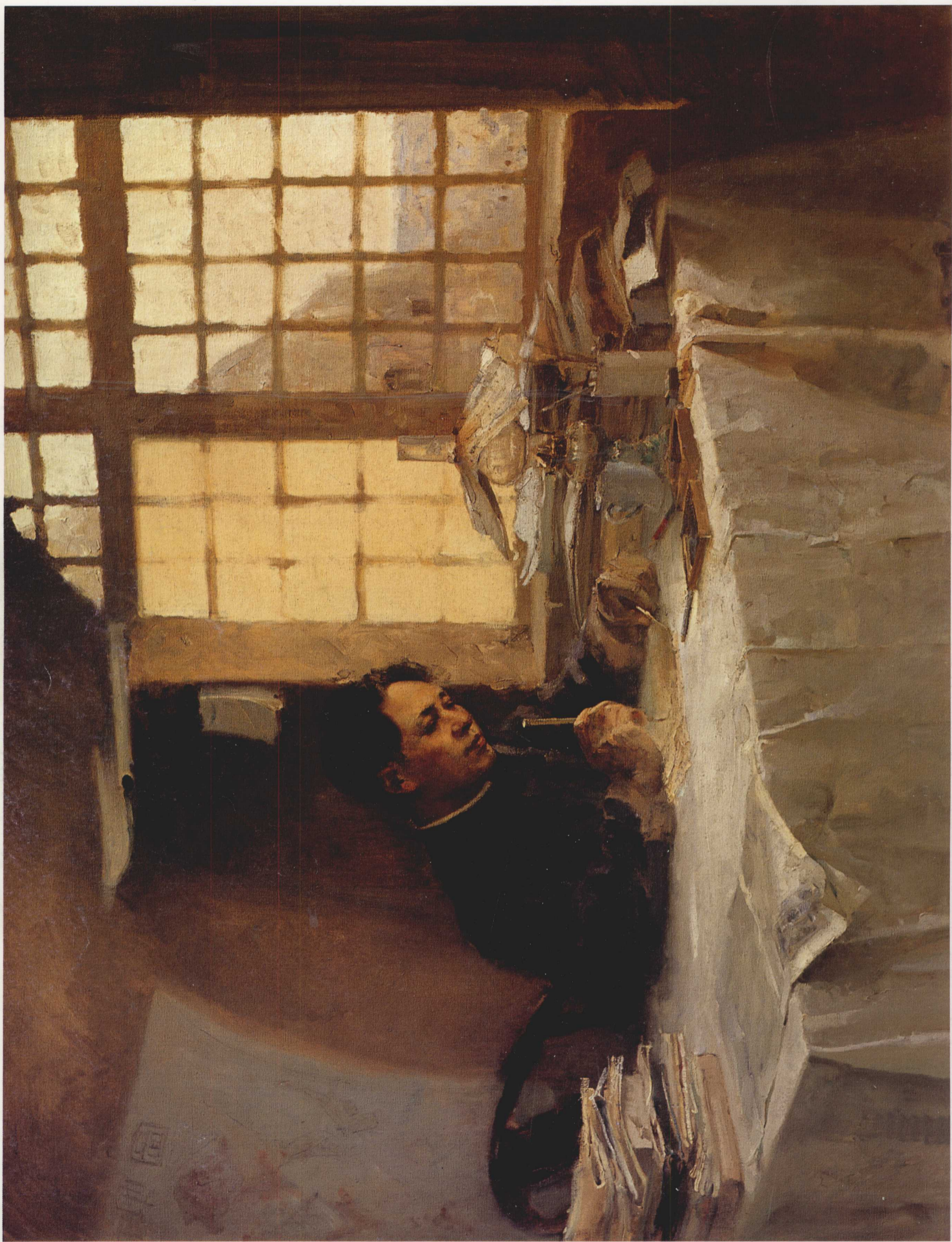
8. 毛主席在写作 布面油画 130cm x 170cm 1961年