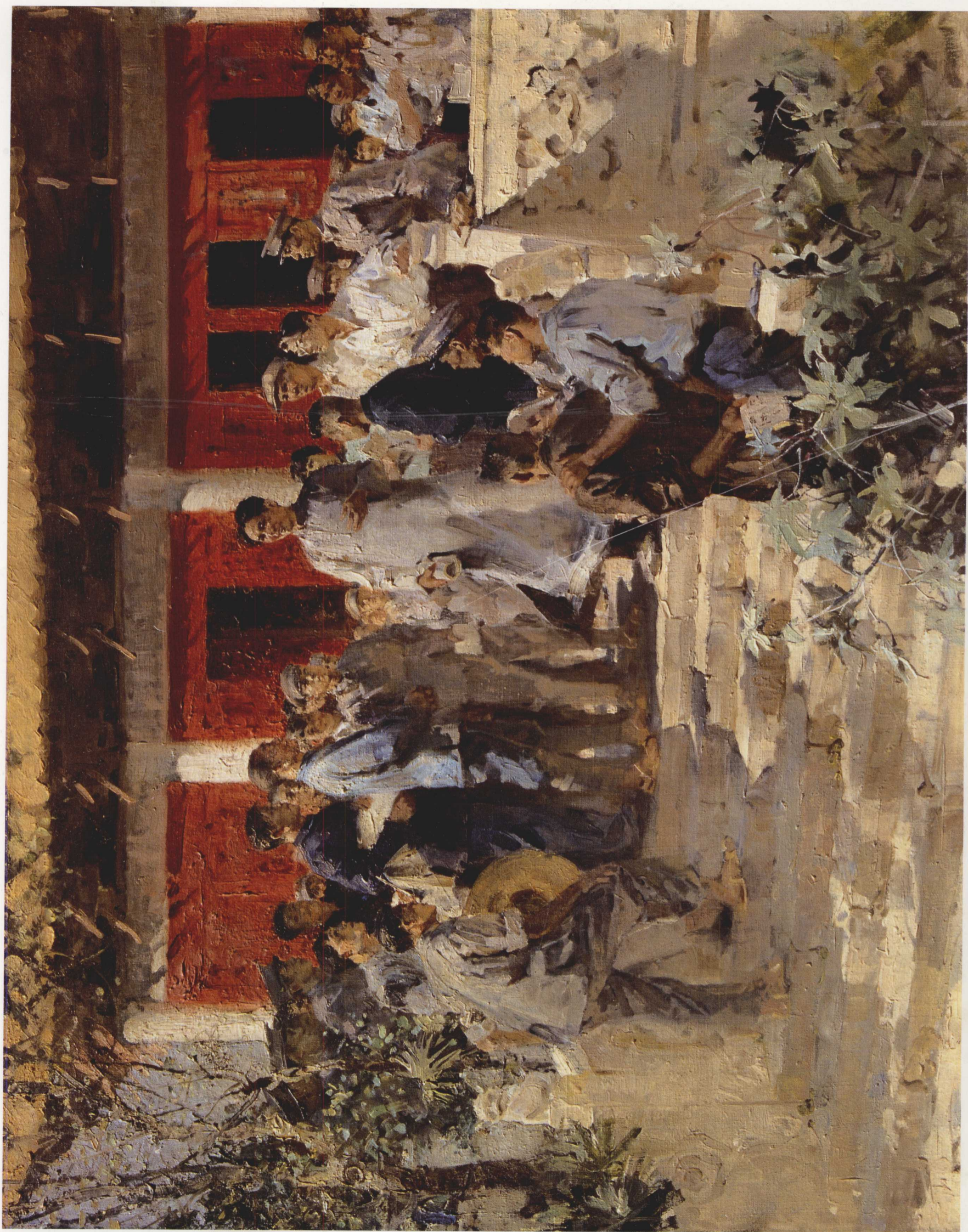
13. 毛主席在农民运动讲习所 布面油画 80cm × 100cm 1960年