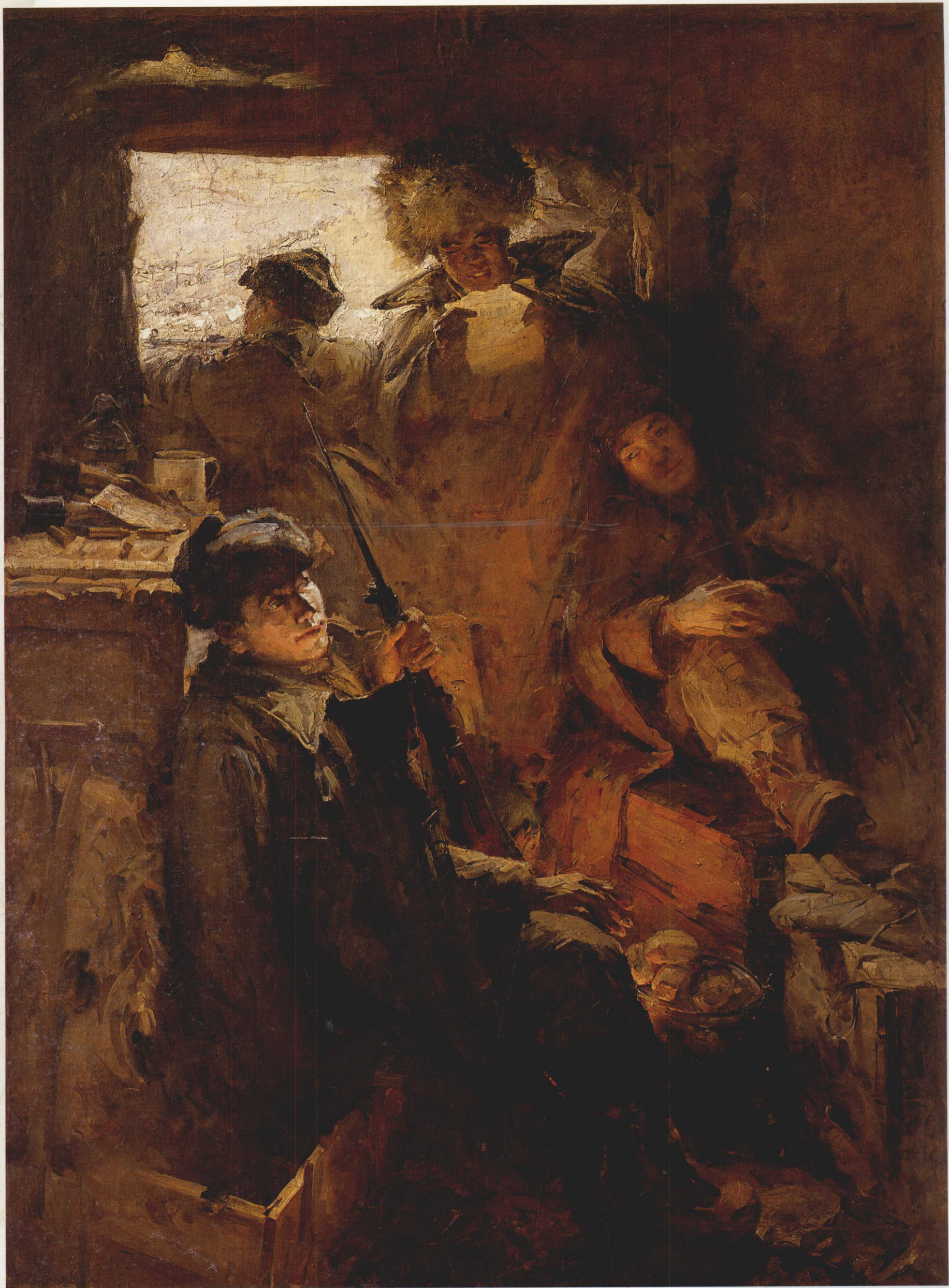
2. 祖国来信 布面油画 200cm × 140cm 1956年