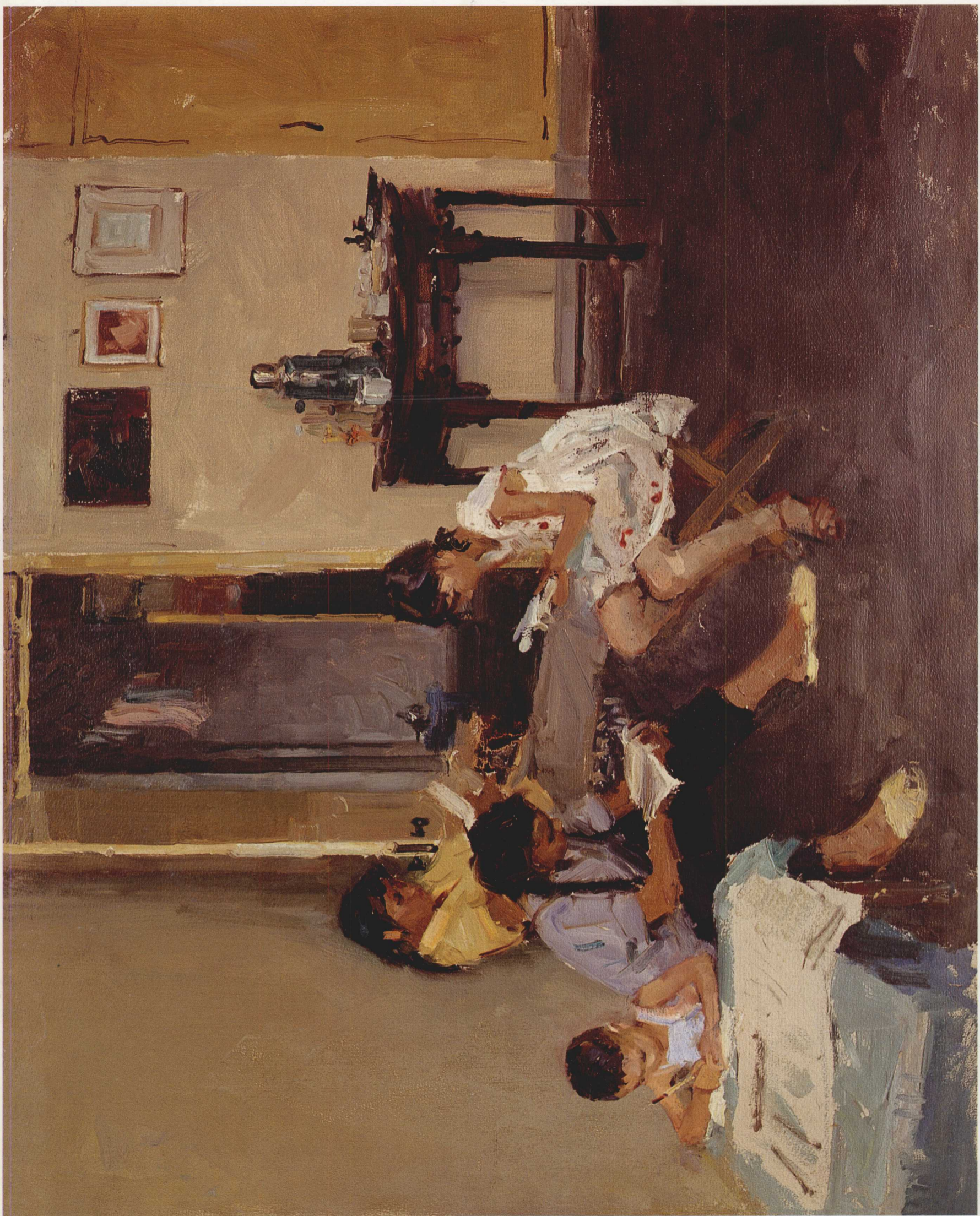
14. 读与画 1967年