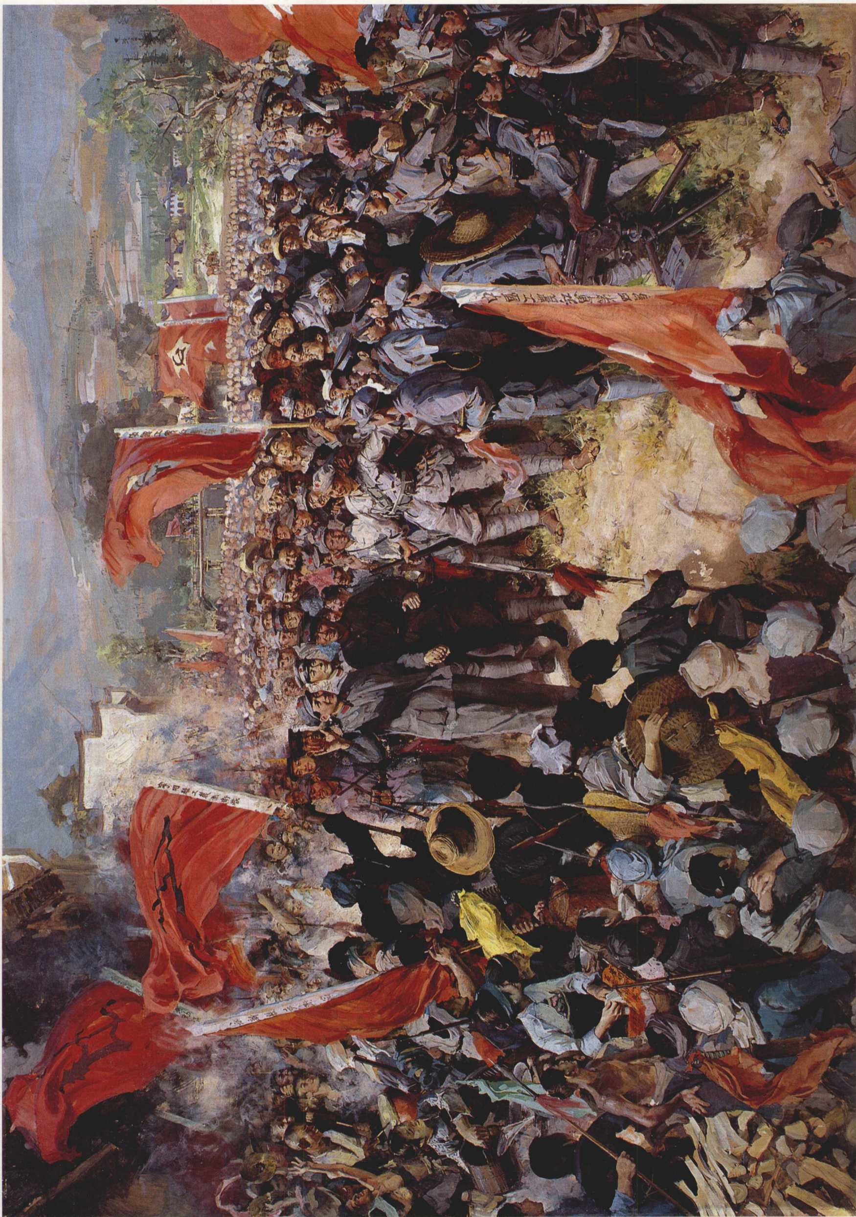
10. 井冈山会师 布面油画 200cm x 250cm 1980年