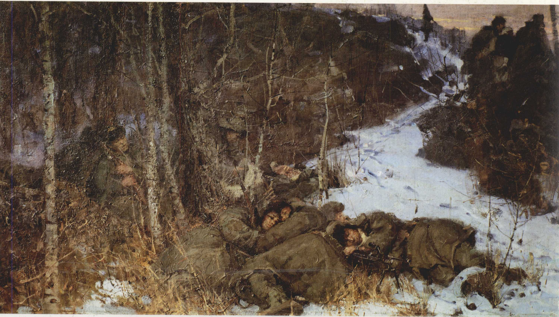
3. 枕戈待旦 布面油画 96cm × 160cm 1964年