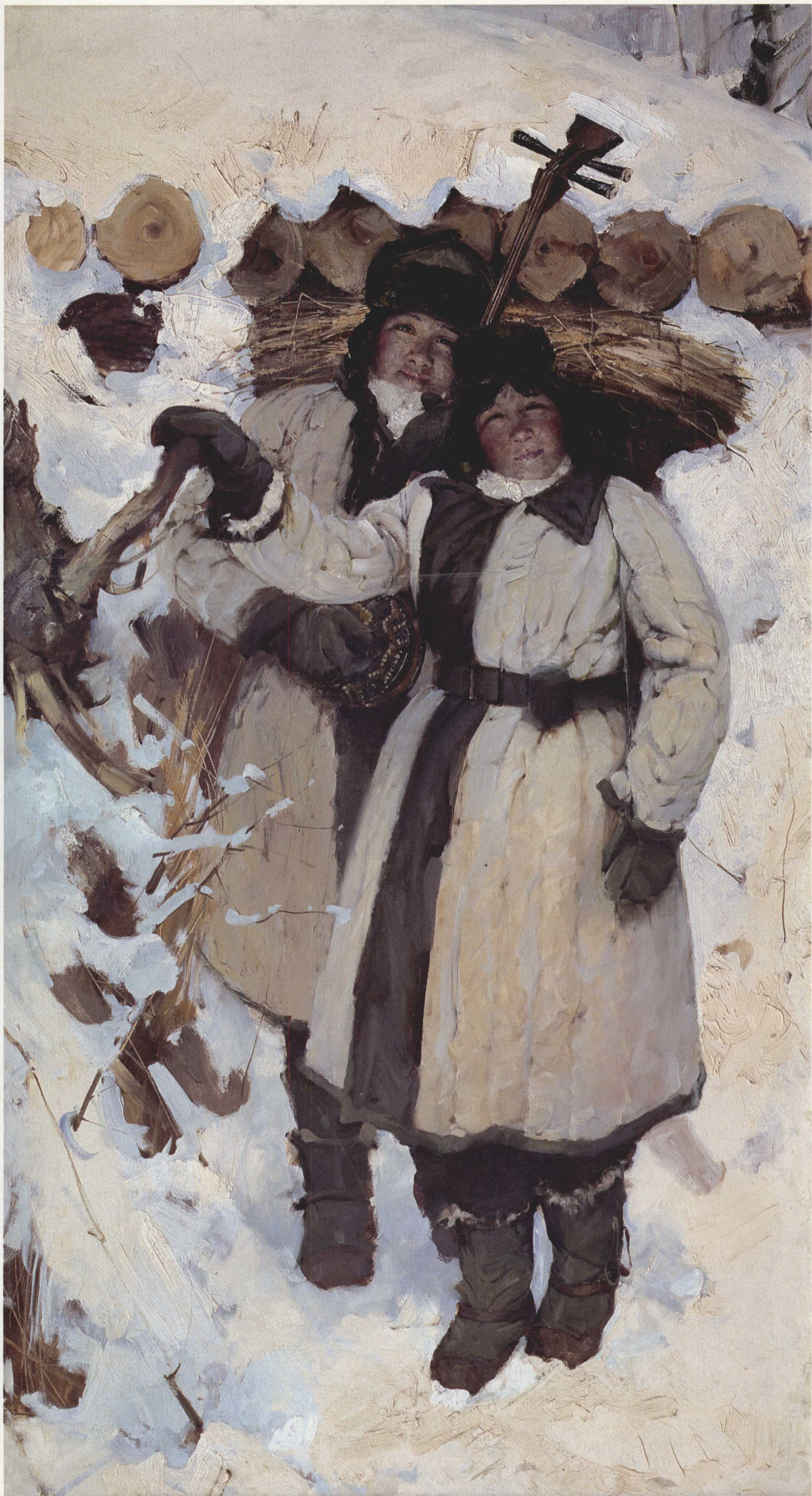
5. 文工团员 布面油画 170cm × 90cm 1955年