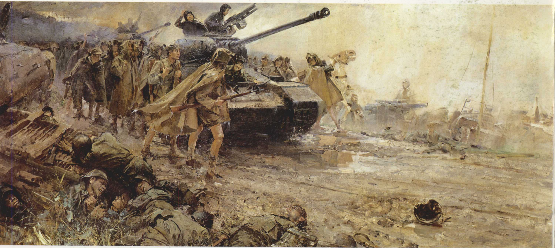
4. 夏季战役 布面油画 104cm × 238cm 1959年