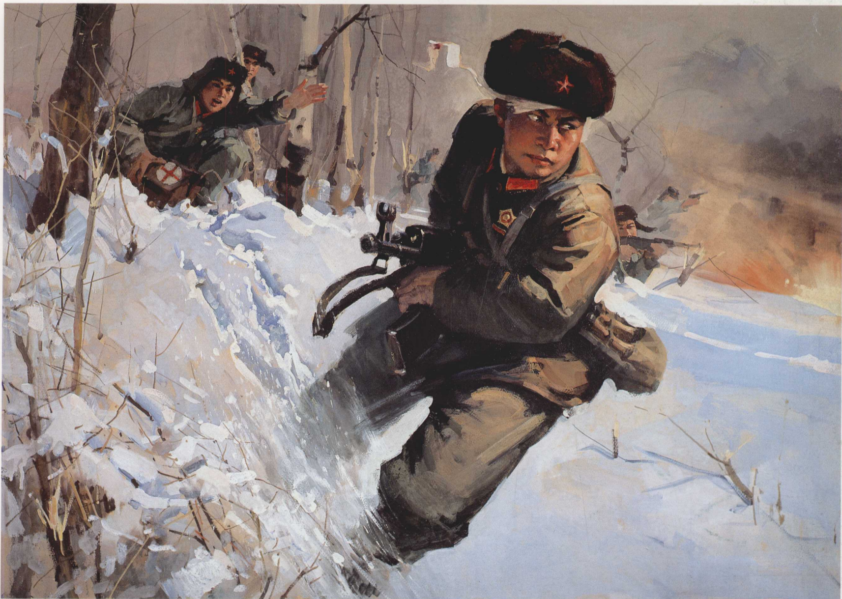
7. 生命不息，冲锋不止 水粉，纸质 66cm × 92cm 1974年