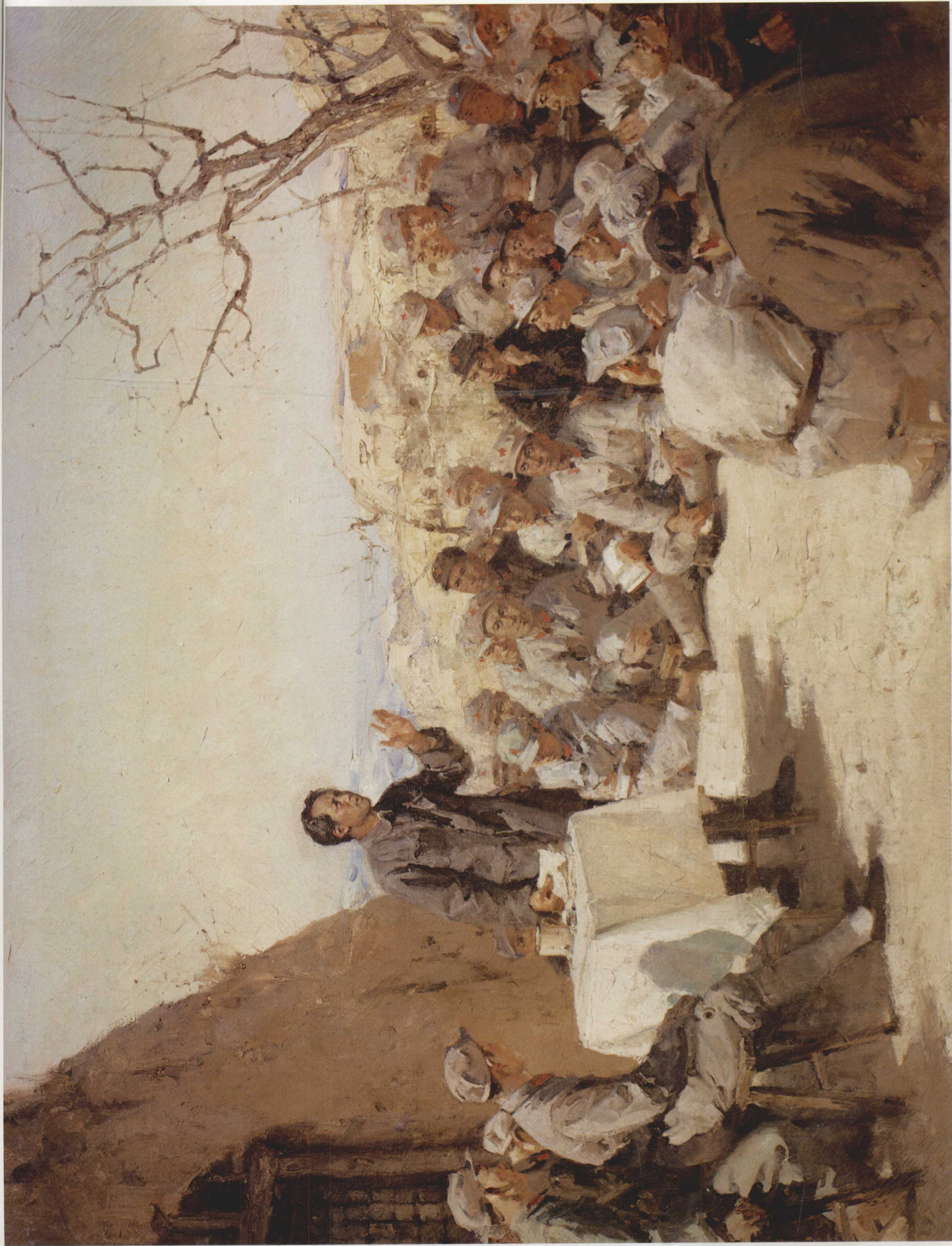
9. 毛主席在红军大学作报告 布面油画 148cm × 170cm 1960年