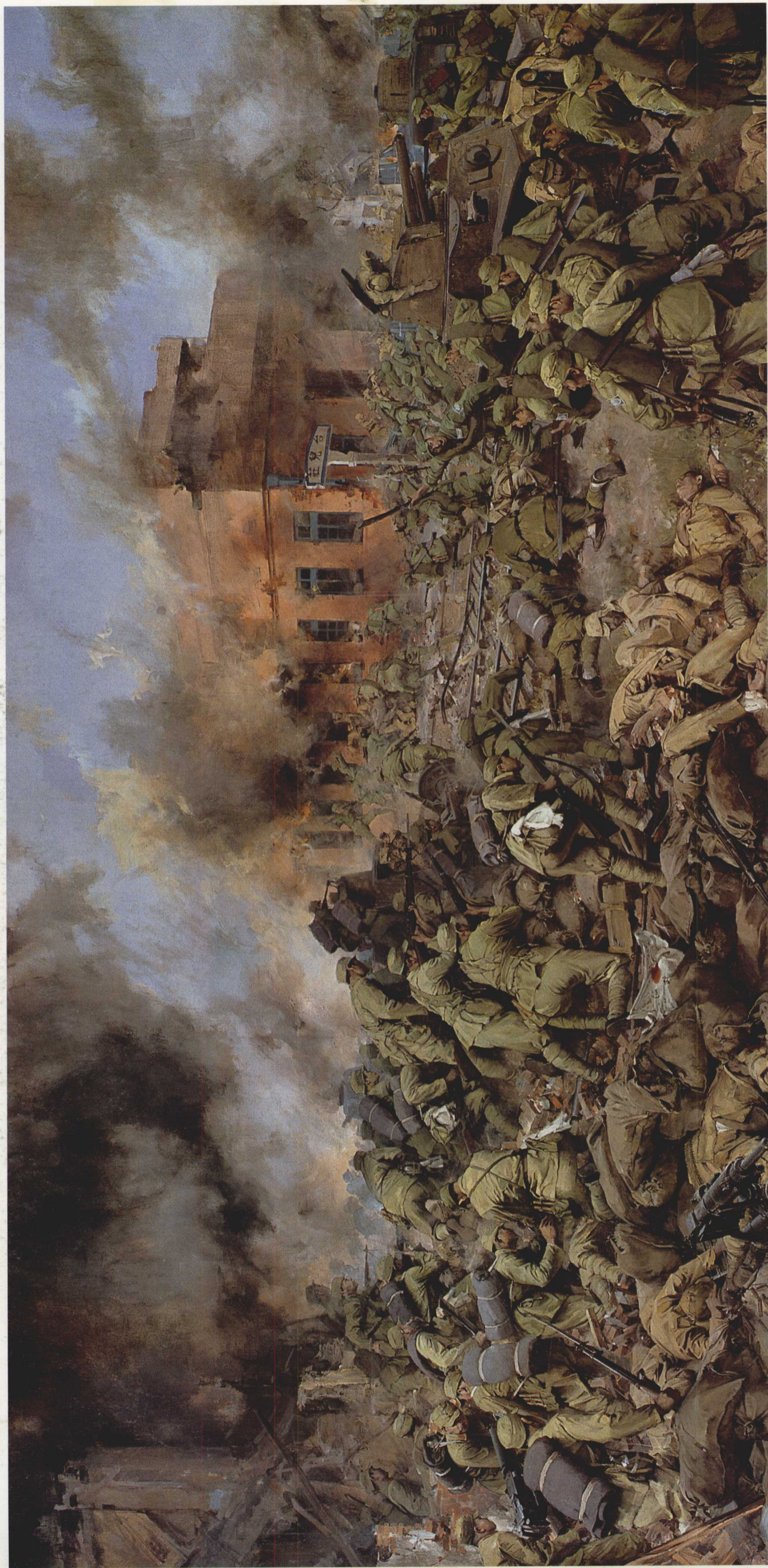
12. 台儿庄大捷 布面油画 200cm x 300cm 1980年