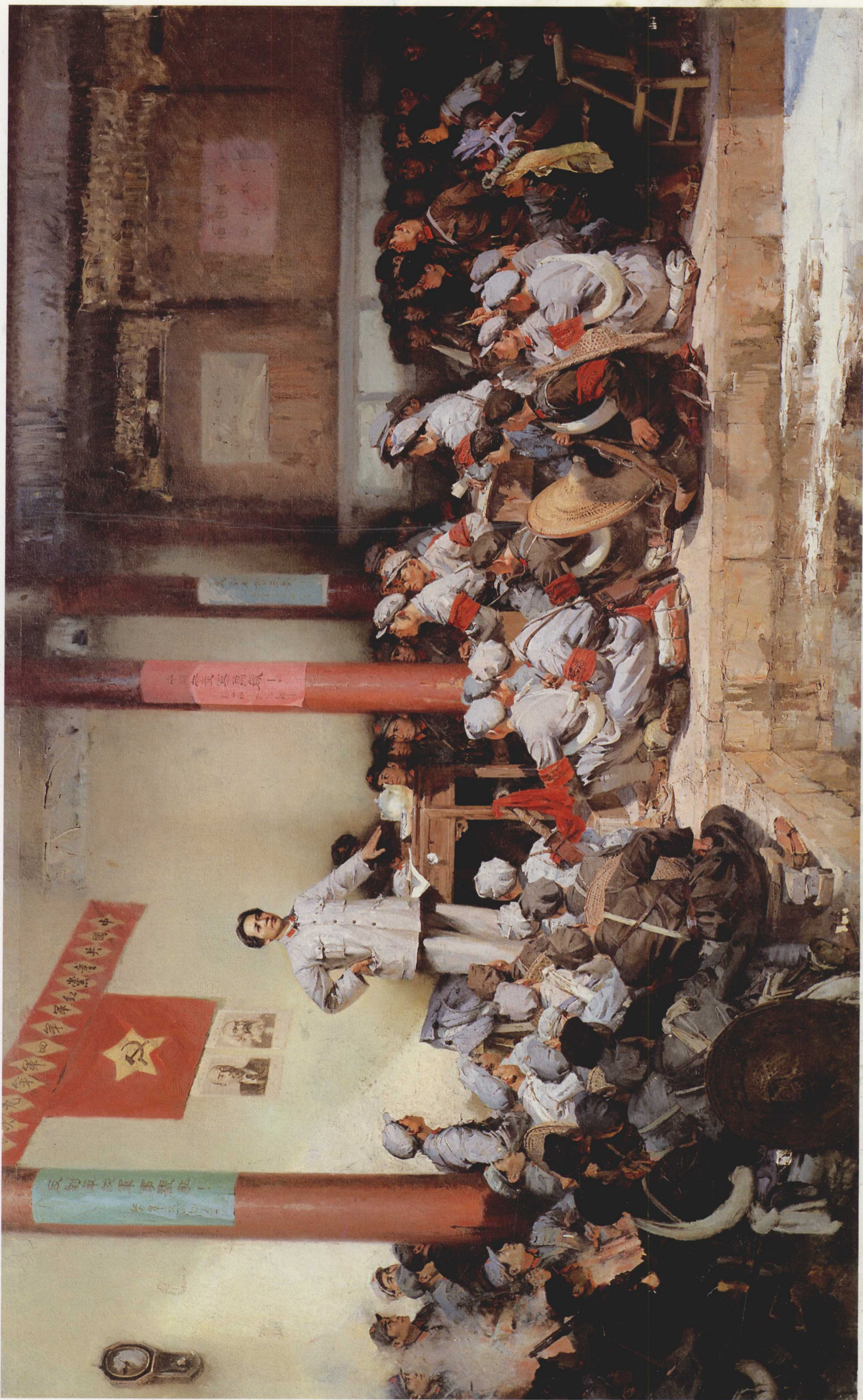
11. 古田会议 布面油画 175cm × 290cm 1972年