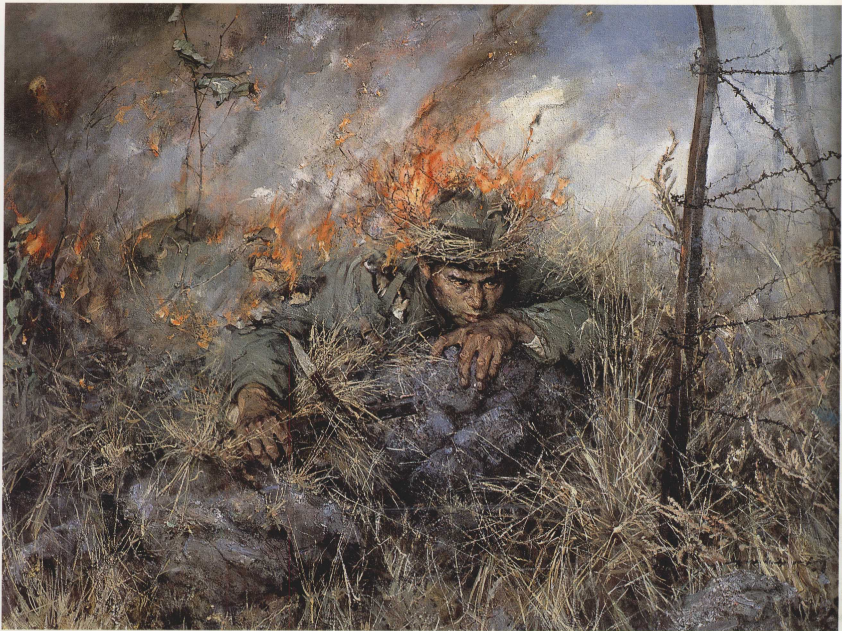
6. 邱少云 布面油画 150cm × 194cm 1980年