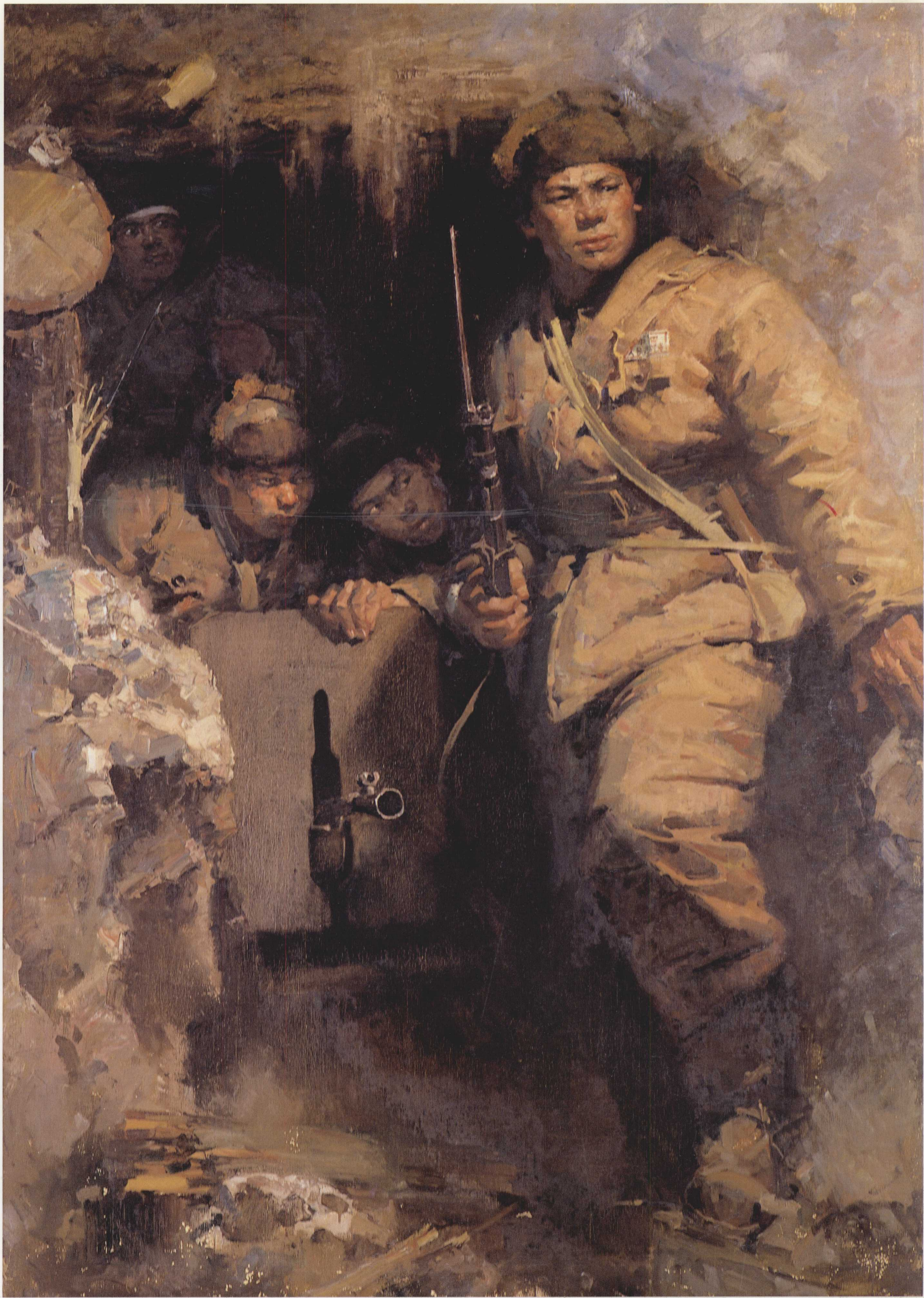
1. 出击之前 布面油画 200cm × 120cm 1964年