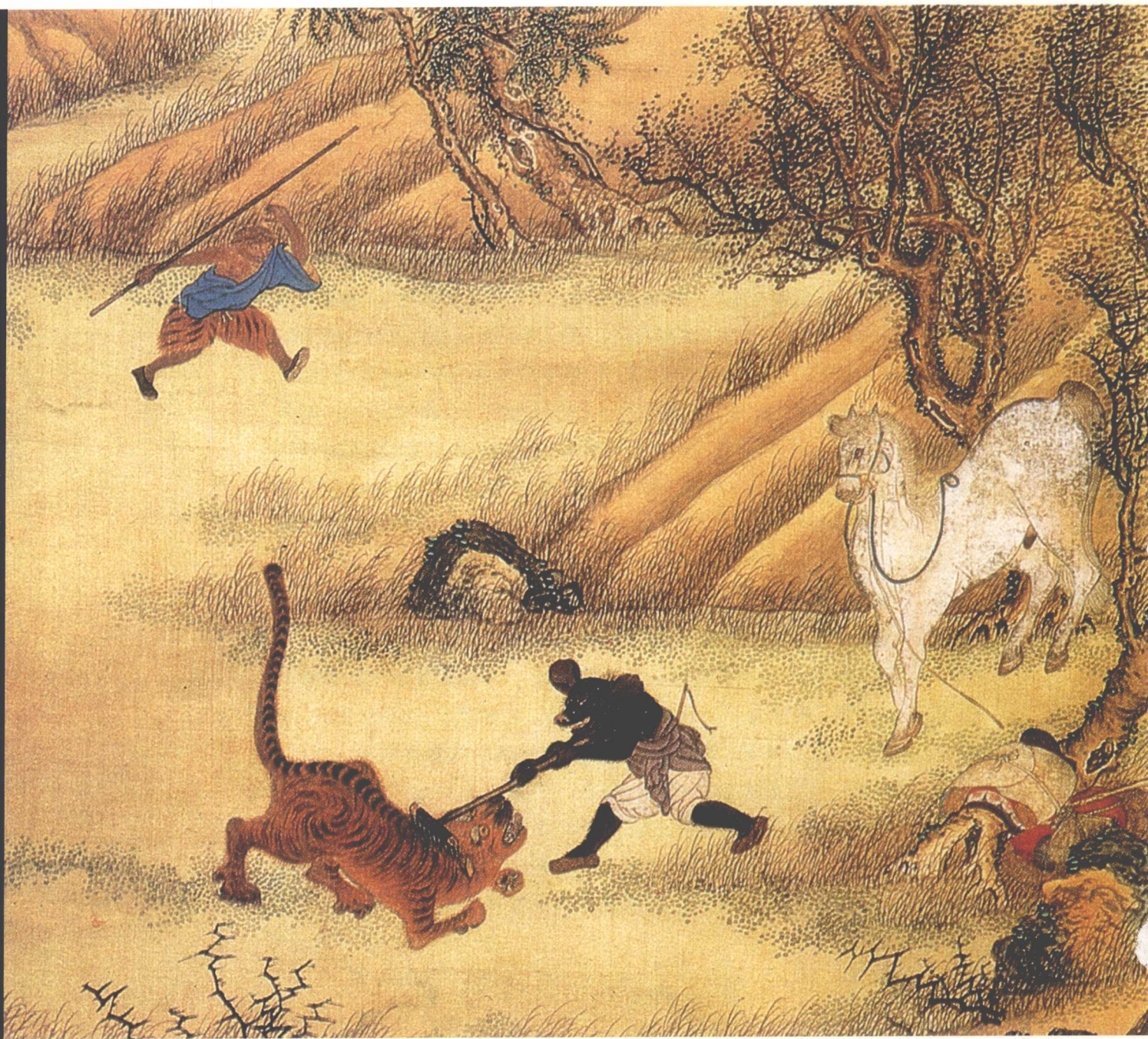
■ 《西游记》插图 猪八戒伏虎