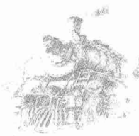
大 太 君 龟 田