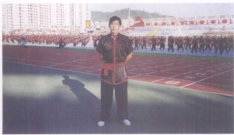
作者在澳门教授和编导庆回归“千人南拳表演”