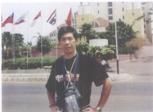
作者在第19届东南亚运动会担任武术裁判