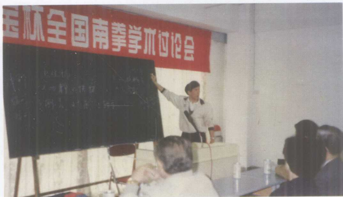
作者在全国南拳学术讨论会上发言