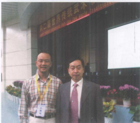
——作者与国际武术联合会传统武术委员会副主任、中国武术协会秘书长康戈武先生合照