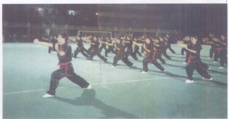
作者在澳门武术总会教授南拳