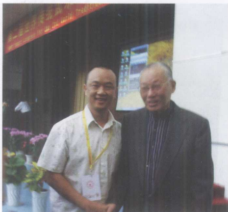
作者与原国家体委副主任、中国武术协会主席、亚洲武术联合会名誉主席徐才先生合照