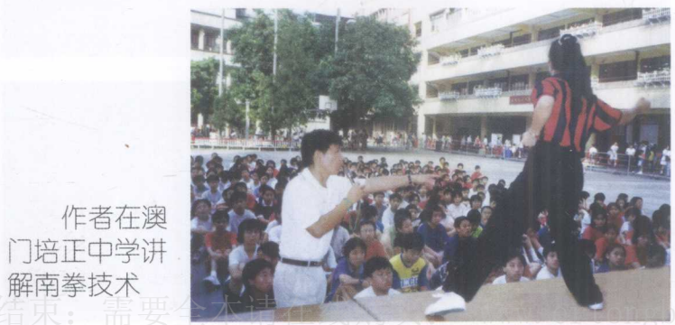
作者在澳门培正中学讲解南拳技术