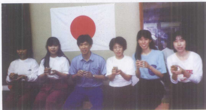
作者在日本教学期间与日本学员合影