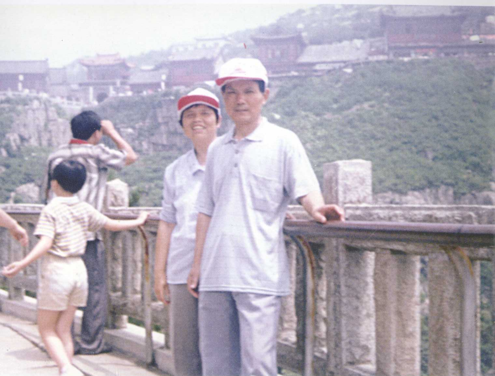
一九九八年于泰山