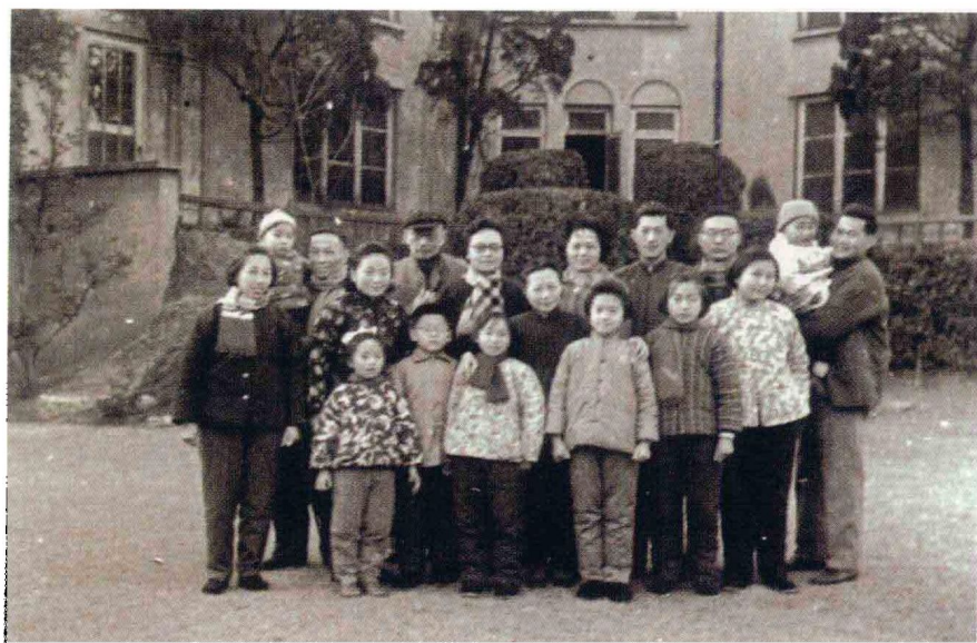
1965 年,朱家第三、四代部分亲属在上海淮海中路心珊家 花园合影