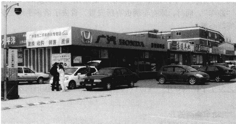
图 1-1 天诚二手车交易市场

以北京、上海、天津等地的旧机动车交易市场为代表的大批旧机动车流通企业，走出了一条以旧机动车交易服务为主线，以置换、拍卖、鉴定评估、维修、美容等多种服务并存的发展之路。南京最大的旧机动车市场天诚二手车交易市场见图 1-1。这些企业首先在硬件设施建设上投入巨资，为驻场商户提供良好的经营条件，为消费者提供整洁舒适的交易环境；其次在保护消费者利益方面，他们引入了先行赔付制度；另外，他们在营销方法与手段上，也不断推陈出新，一些企业引入旧机动车网上拍卖系统，把网上交易和现场拍卖会相结合，进一步扩大了原有旧机动车经营业务的范围，为旧机动车交易市场在新的市场形势下实现可持续发展，提供了新思路。