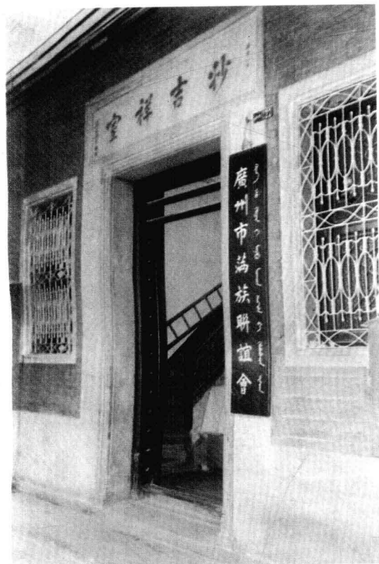
廣州市滿族聯誼會會址