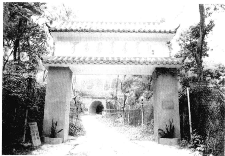
广州满族坟场正面门楼