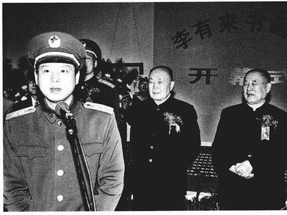
1996 年在个展开幕式上致答谢辞