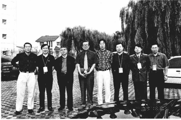
在北京书协第四次代表大会会议间隙与书家合影