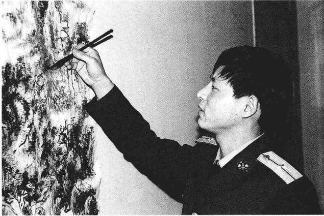
1991 年在北京卫戍区任排长时作画留影