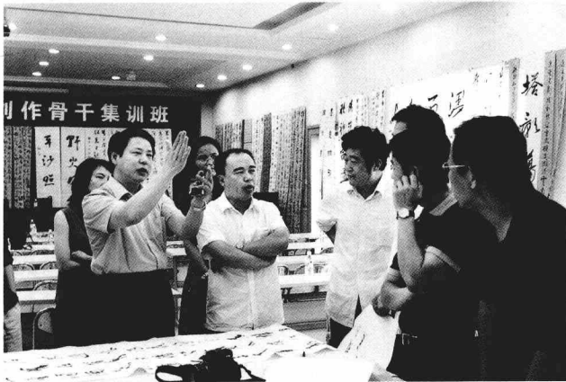
2005 年在“北京书协创作骨干集训班”上与学员交流创作体会