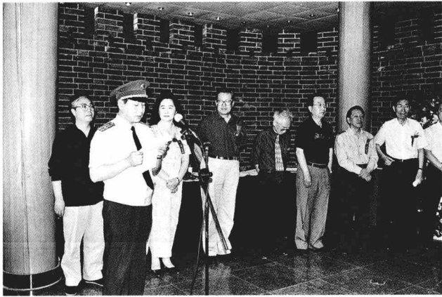
在第二届中国书协德艺双馨会员颁奖大会上代表获奖书家发言