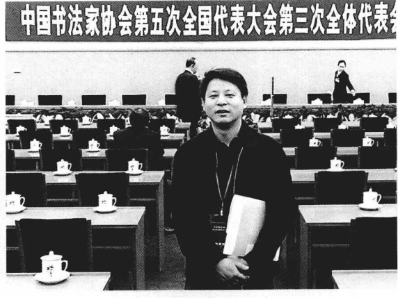
在中国书协第五次书代会会场留影