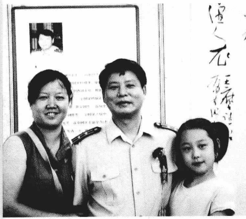
2006 年与爱妻及小女在秦皇岛参加当代军旅书法名家作品展开幕式时留影