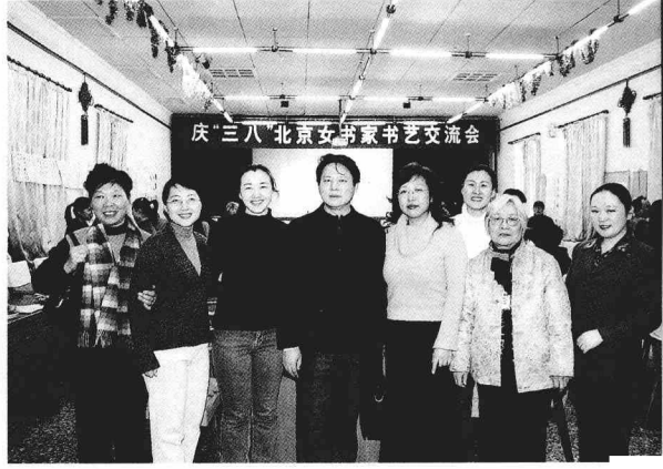
在北京书协女书家书艺交流会上与女书家合影