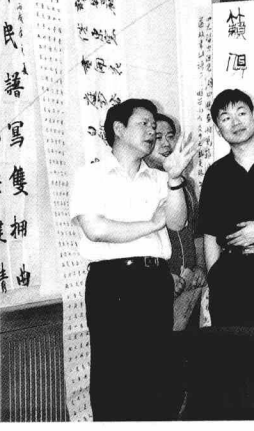
2004 年在“北京书协创作骨干集训班”为作者习作点评