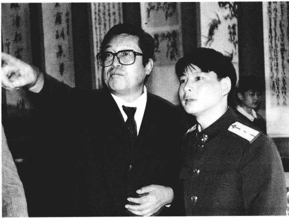
1994 年刘炳森先生观看“李有来书画展”时对展品进行点评