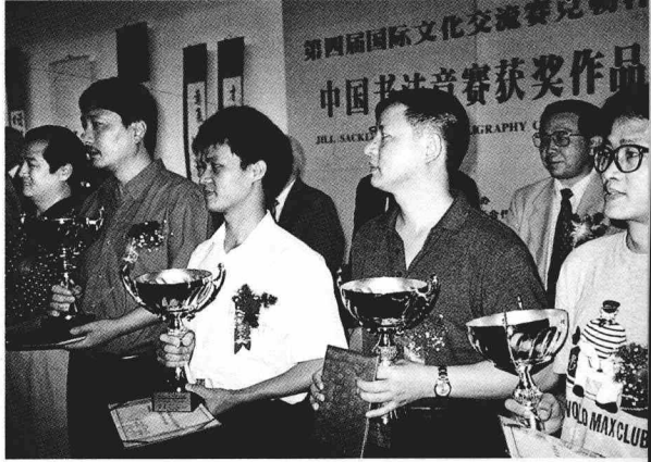
1999 年在第四届赛克勒杯国际书法大赛颁奖大会上