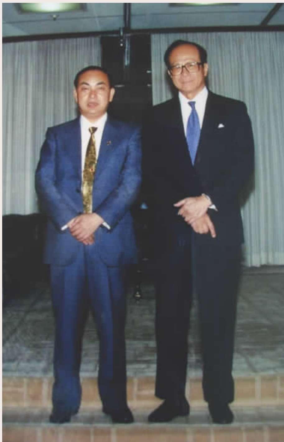
李嘉诚先生和卢琰源主编合影。