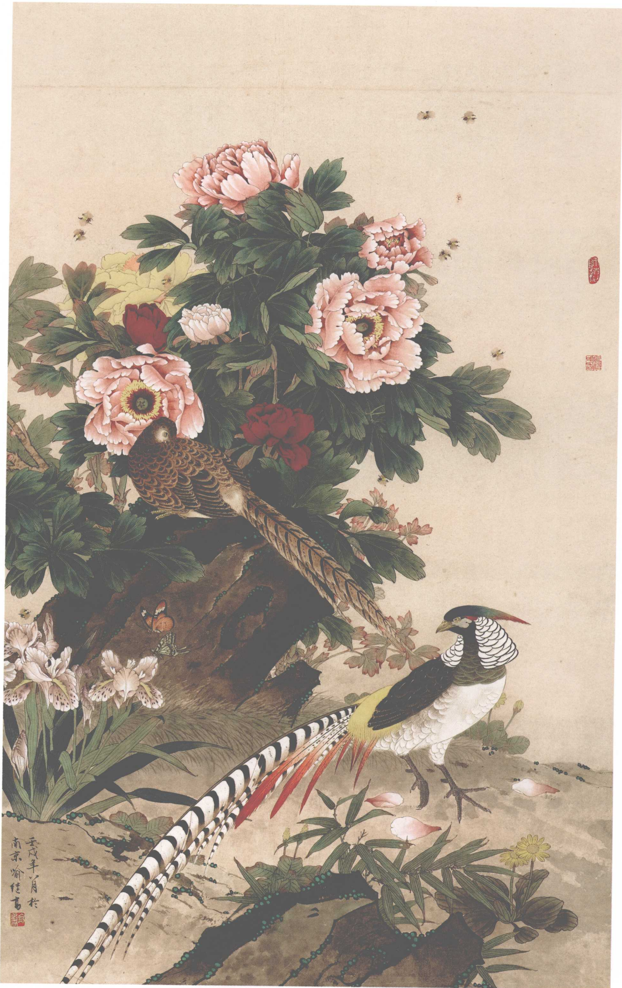
春满神州 / 纸本 / 140cm X 87cm