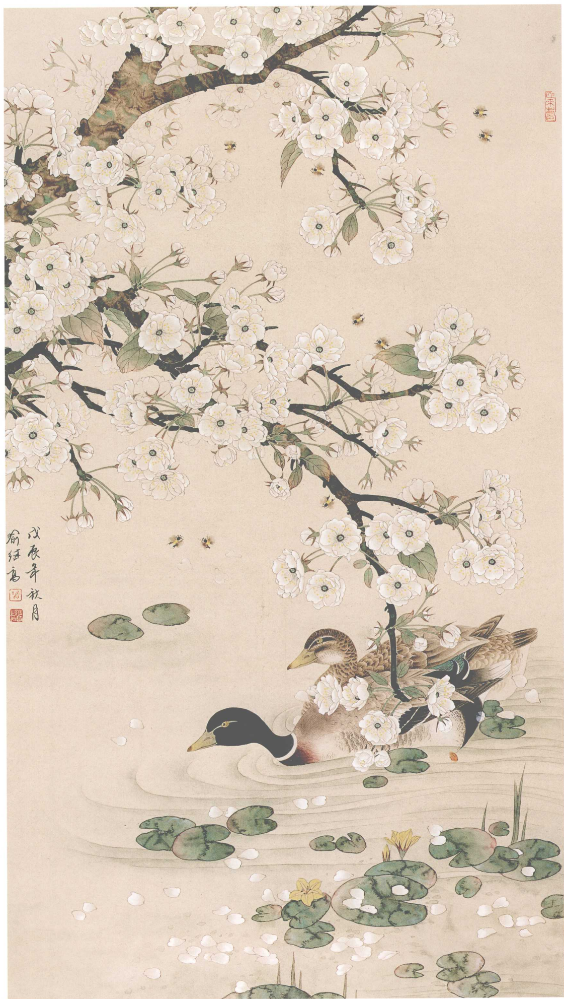
春江水暖图 / 纸本 / 120cm x 68cm