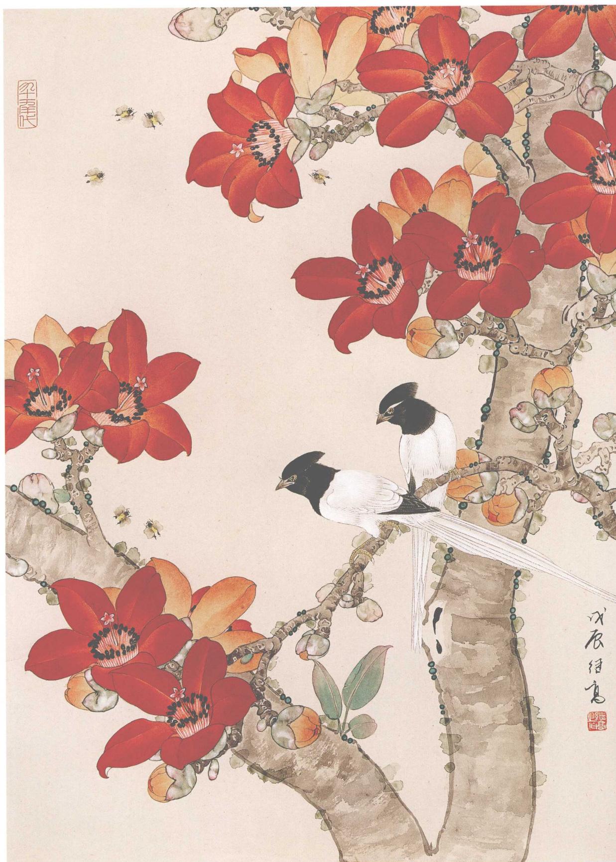
红棉吐艳 / 纸本 / 96m × 68cm