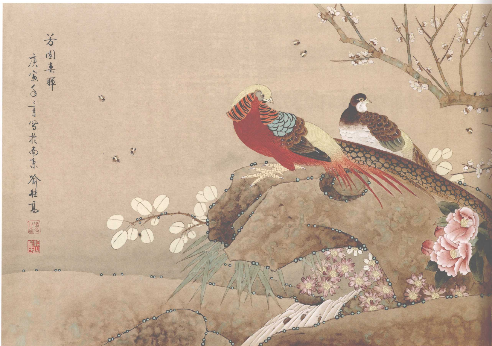
芳园春晖 / 纸本 / 133cm × 66cm