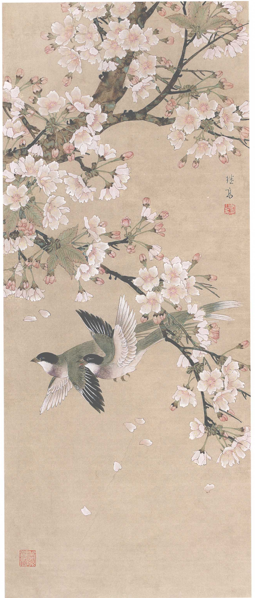
早春二月 / 纸本 / 105cm x 68cm