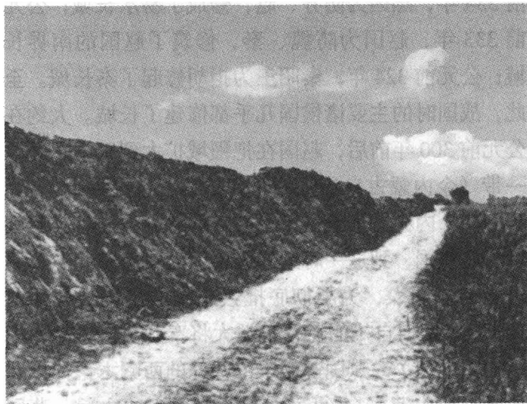
▲陕西韩城魏国长城遗迹

墙体连接，最终形成了初始状态的“长城”。据考证，大约在公元前 656 年前后，楚国就开始在国境线上把各个城堡相连，修筑了被历史文献记载为“方城”的墙体式防御建筑。楚国修建的具有鲜明的战略防御性