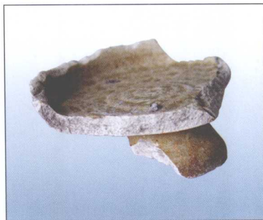
战国·青黄釉豆残件