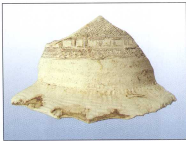
商周·刻划几何纹白陶壶残片