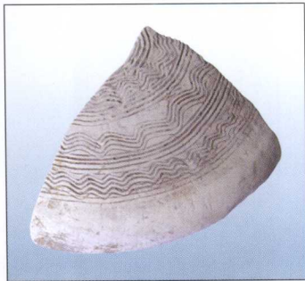
战国·刻划水波纹灰陶碗盖残片