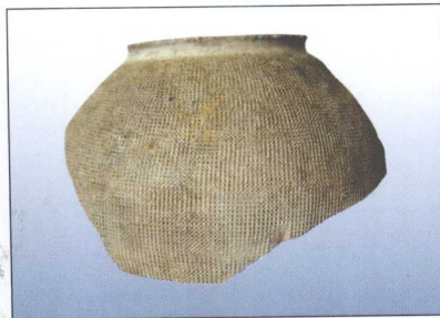
战国·麻布纹硬陶罐残片