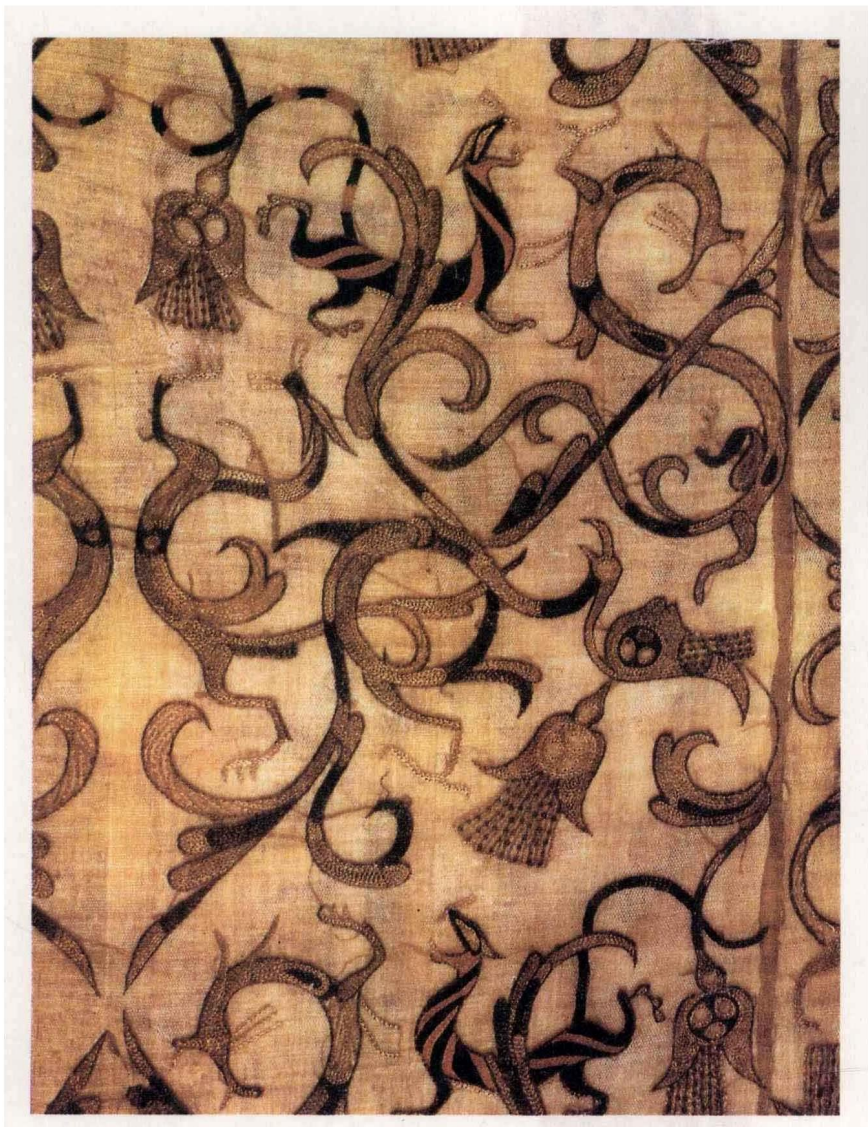
龙凤虎纹绣（战国） 1982年湖北江陵出土