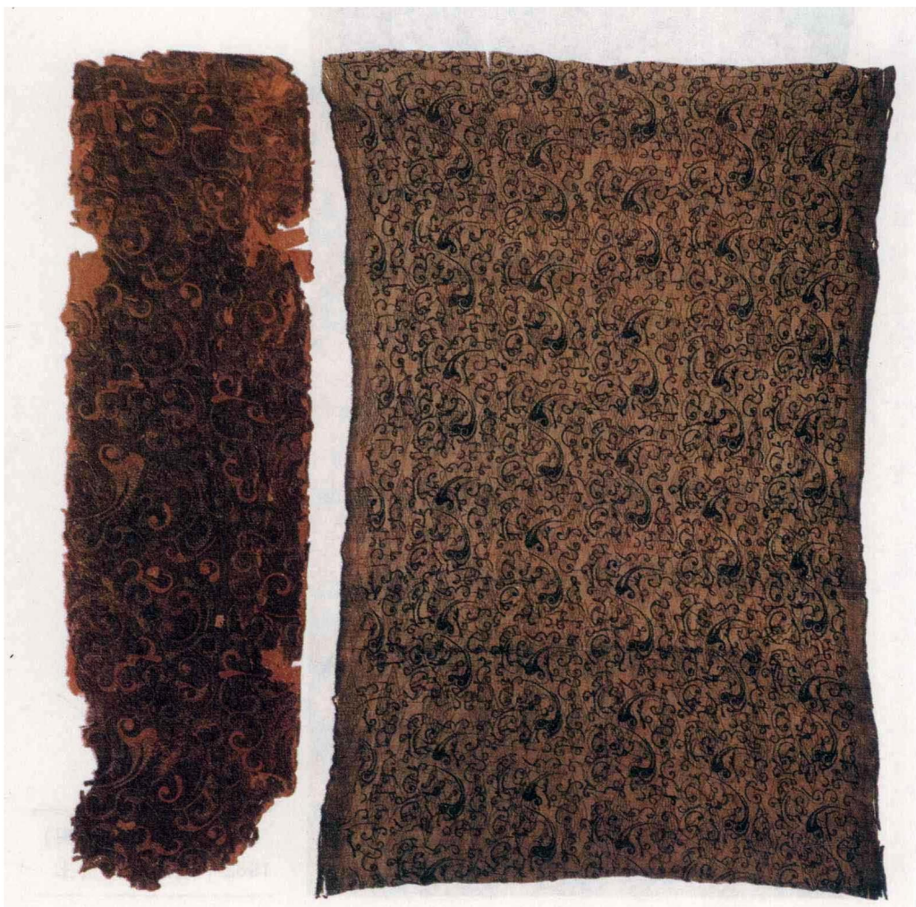
深褐色菱纹信期绣（西汉） 1972年长沙马王堆出土