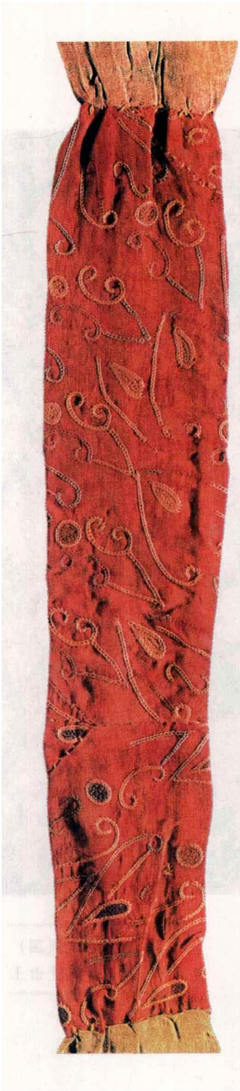
刺绣云纹袜带（东汉） 1959年新疆出土