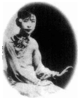
少女时代的宋霭龄

1904年4月28日，上海黄浦江的码头上，一位15岁的少女被父亲送上了“高丽号”轮船，前往美国乔治亚州梅肯市的威斯理安女子学院留学。那时，女人出国留学者凤毛麟角，她是中国近代第一个出国留学的女性。