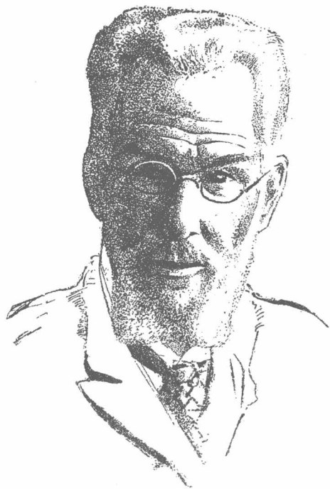
德米特里·尼基福罗维奇·凯戈罗多夫