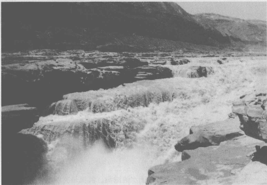
◎ 黄河壶口瀑布

咆哮劈两山，洪波喷流射东海。”正是滔滔不绝的黄河水，以她那劈山斩石、百折不回、汹涌磅礴、一往无前的雄伟气魄和接纳百川、汇聚千流的恢宏气度，熏陶、濡染着一代又一代的中华儿女，铸就了他们自强不息、蓬勃向上、兼容并蓄、厚德载物的性格。基于这种民族性格，数千年来，中华儿女不仅以勤劳灵巧的双手创造出昌盛发达的中华文明，为人类文明的发展作出不可磨灭的贡献，而且以其血肉之躯，对黑暗与邪恶的腐朽势力展开英勇顽强的斗争，推动着历史的发展，社会的进步。“风在吼，马在叫，黄河在咆哮……”一曲激昂雄壮的《黄河大合唱》，唱出了中华民族不能忍受压迫和侵略，勇于为争取自由、维护民族尊严而搏斗的英雄气概。正如毛泽东所说：“你们可以藐视一切，但是不能藐视黄河，藐视黄河，就是藐视我们这个民族。”