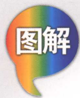
图 文馆系列 TuWenGuanXiLie