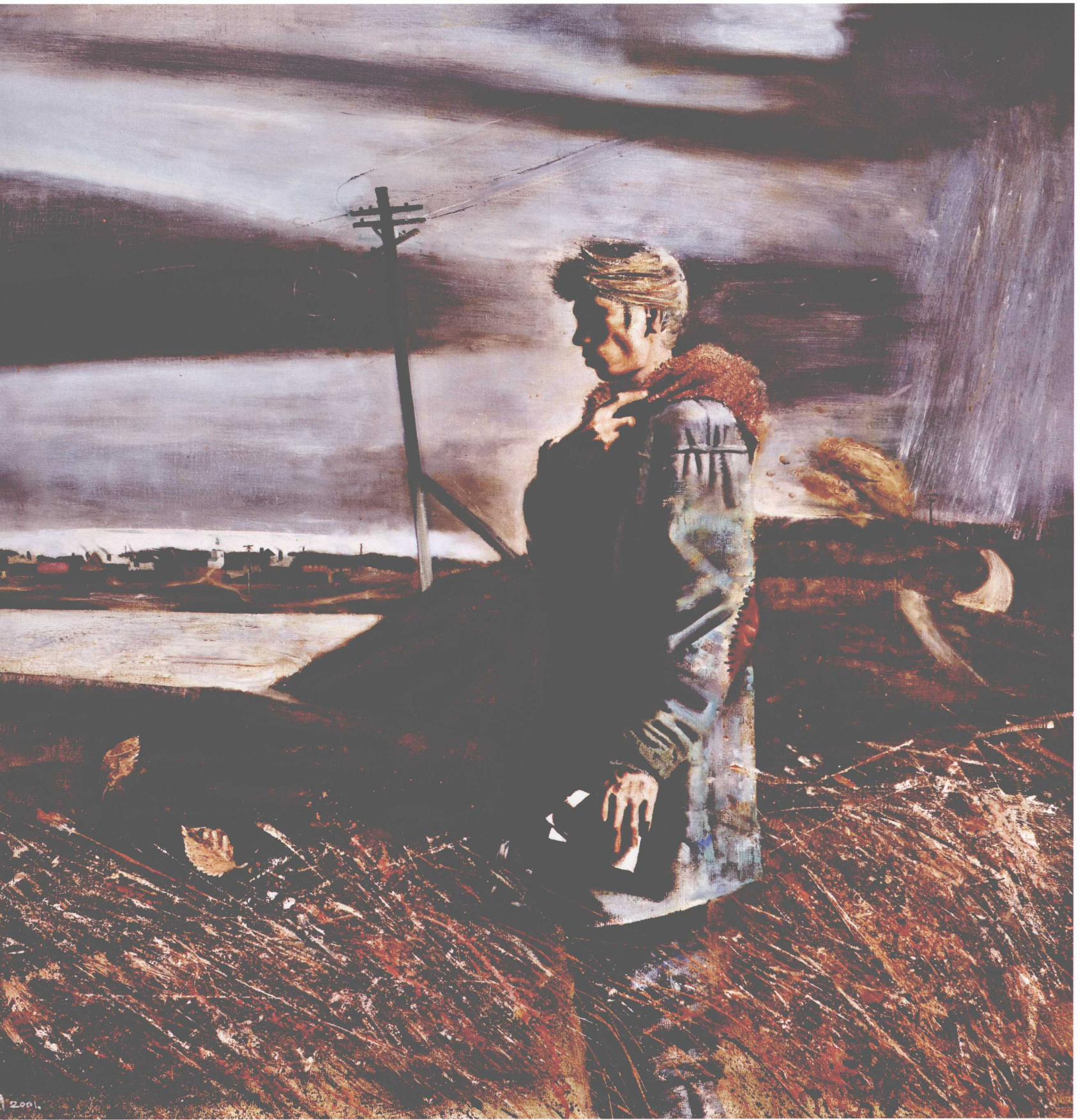
Холодный ветер, 90×90cm, холст, масло, 2005г. 冷风, 90×90cm, 麻布, 油彩, 2005年