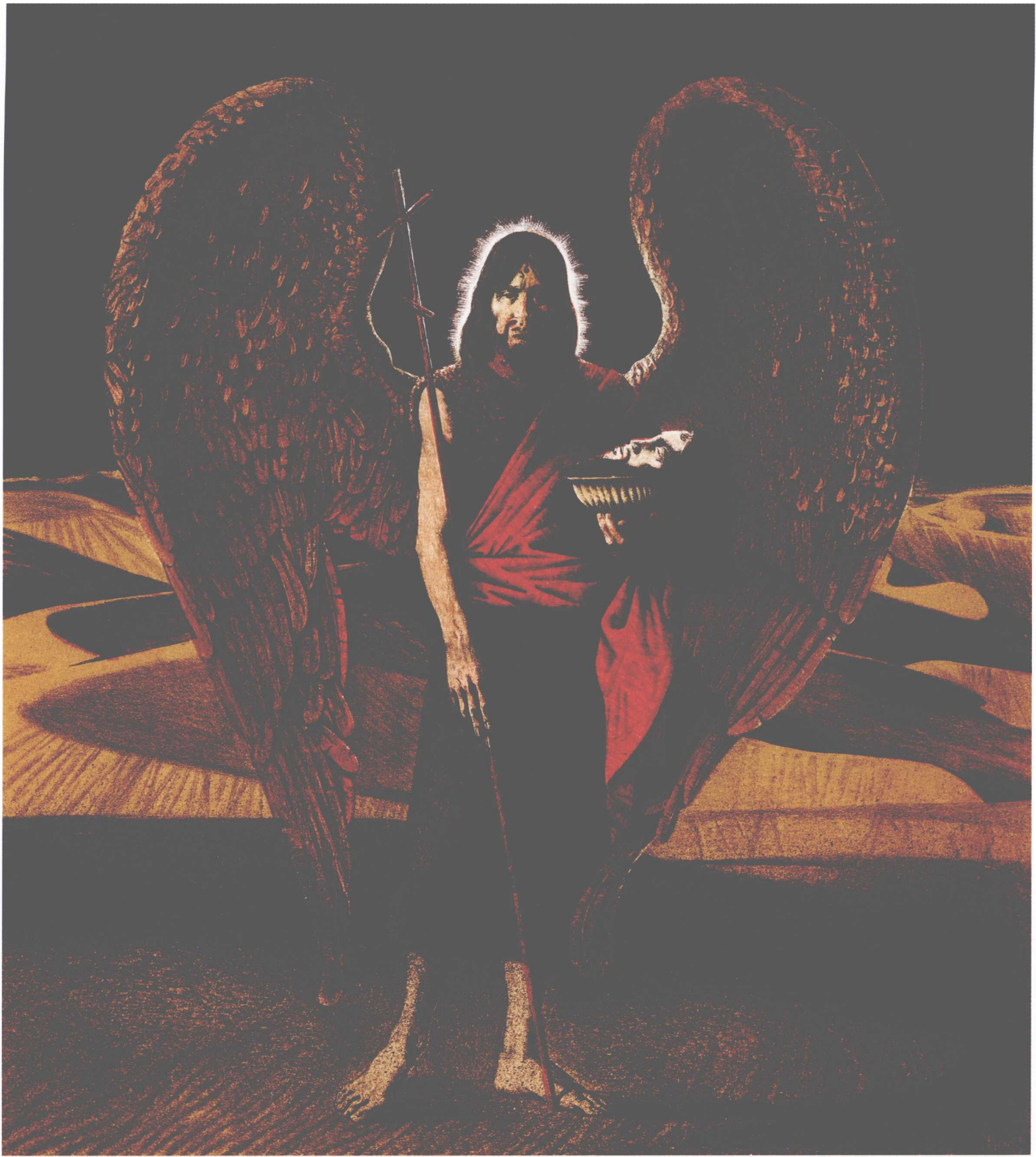
Иоан Предтеча. Ангел пустыни, 43×38cm, литография, 2008г. 希施约翰，沙漠天使，43×38cm，石版画，2008年