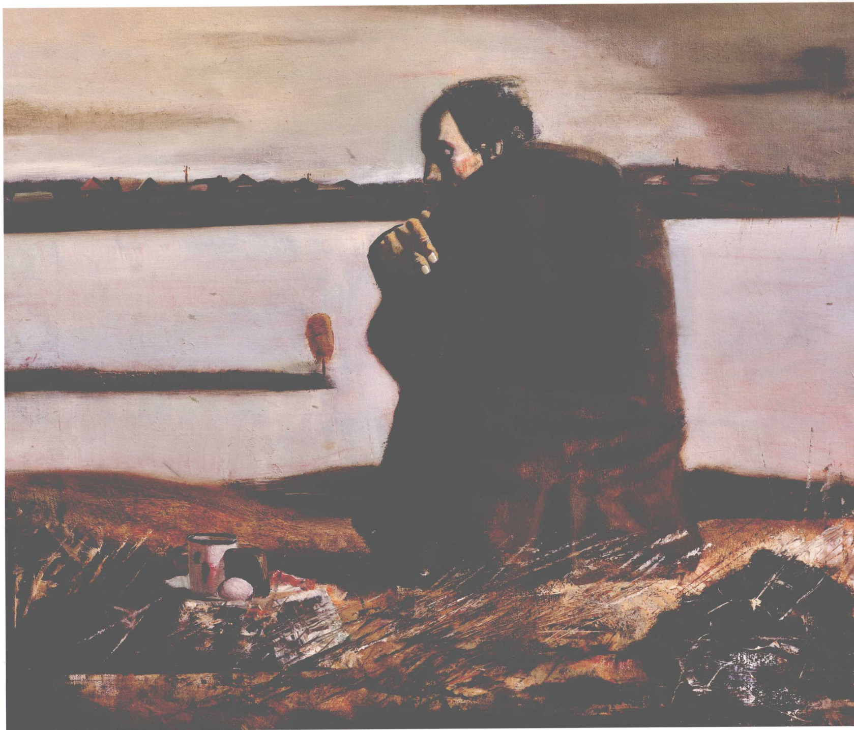
Память (эскиз), 42×50см, холст, масло, 2002г. 记忆 (小稿), 42×50cm, 麻布, 油彩, 2002年