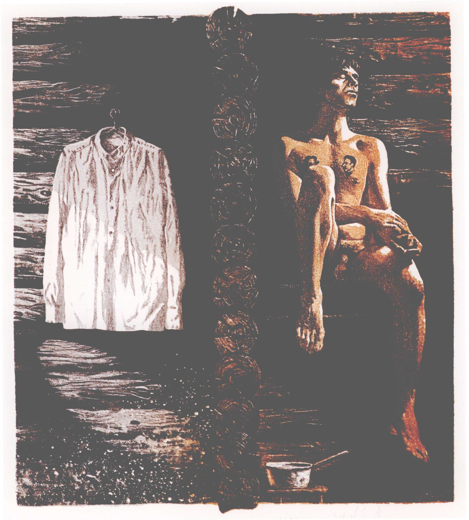
Банька по-чёрному, 26×22.3cm, литография, 2007г. 黑色小浴室, 26×22.3cm, 石版画, 2007年