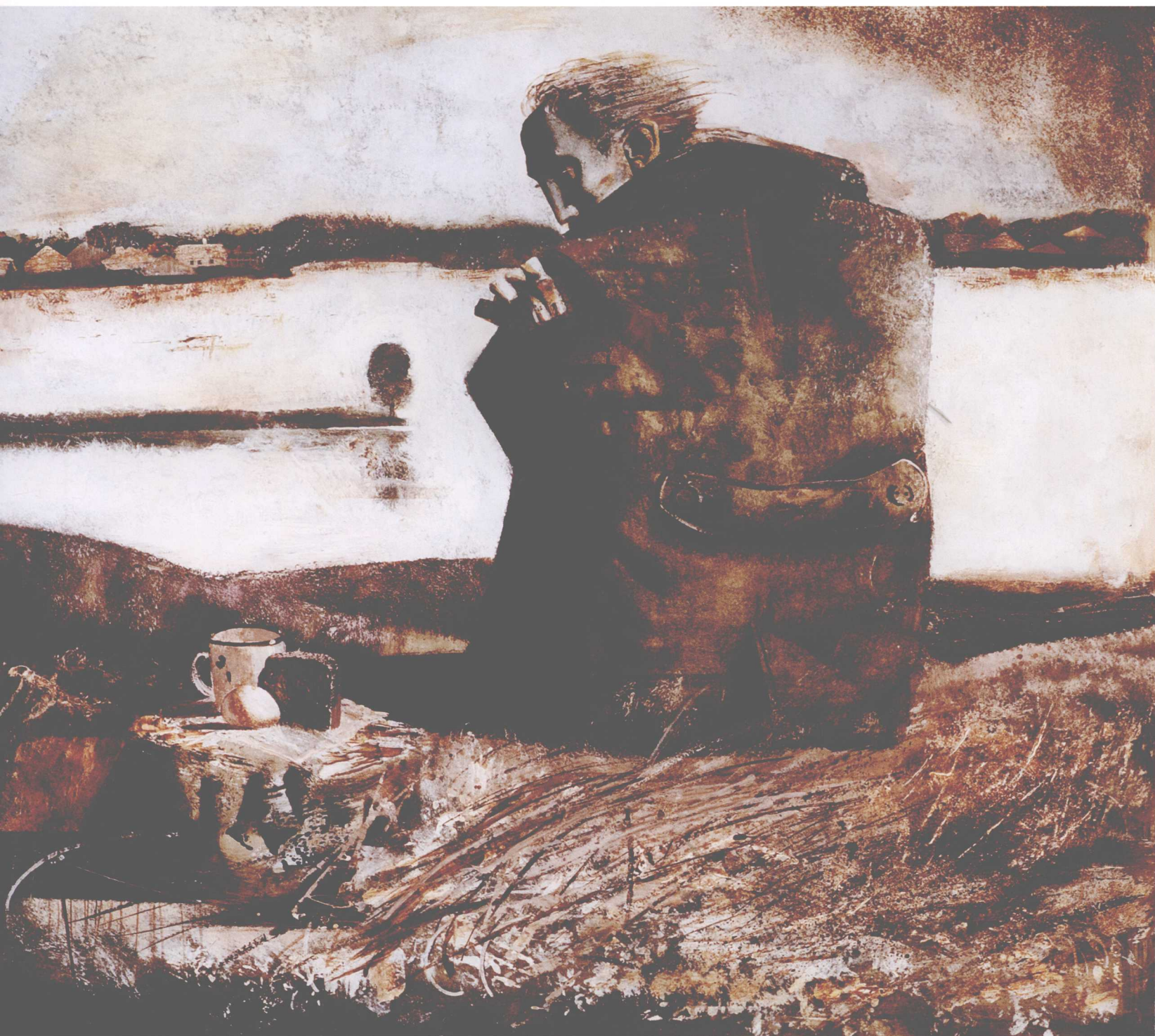
Память (эскиз), 36×42cm, бумага, темпера, 2002г. 记忆 (小稿), 36 × 42cm, 纸, 丹佩拉, 2002 年