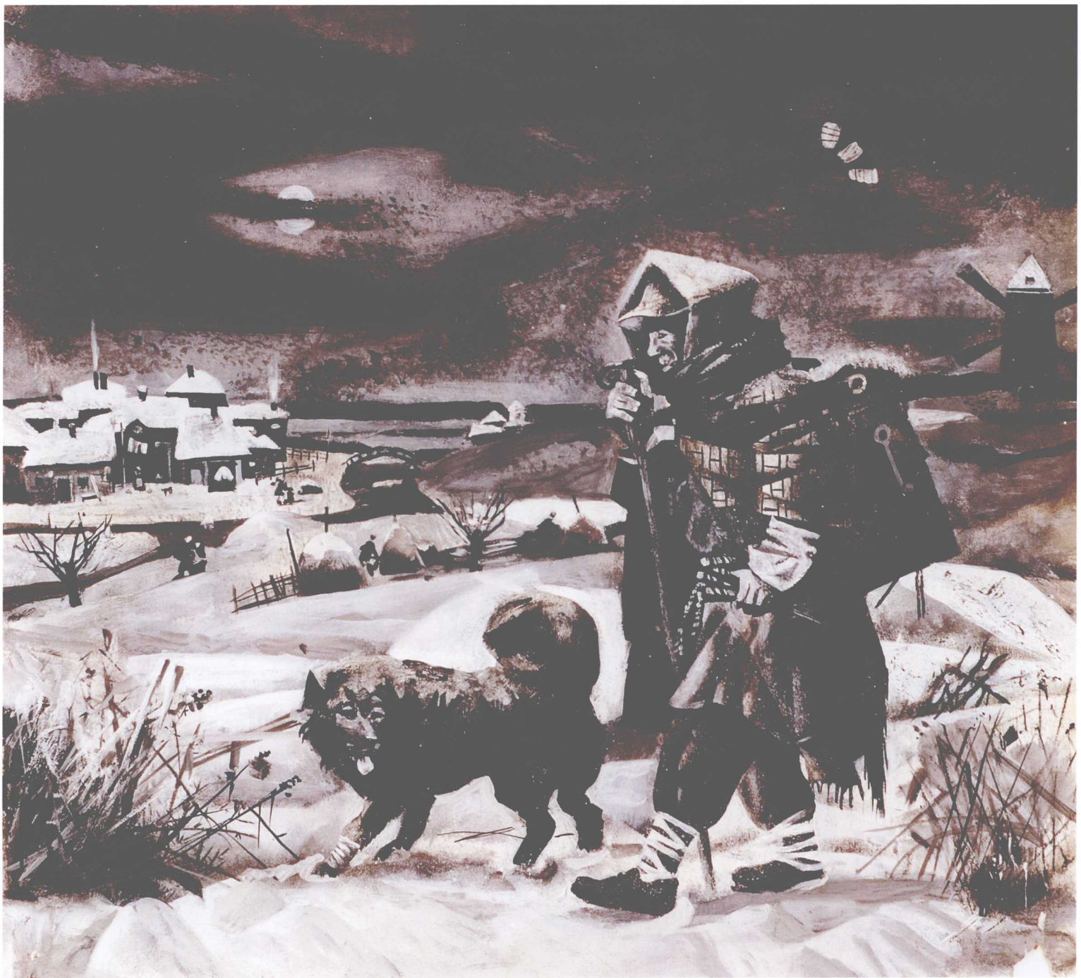
Бродяги (эскиз), 35×35.7cm, бумага, темпера, 2002г. 流浪人 (小稿), 35×35.7cm, 纸, 丹佩拉, 2002年