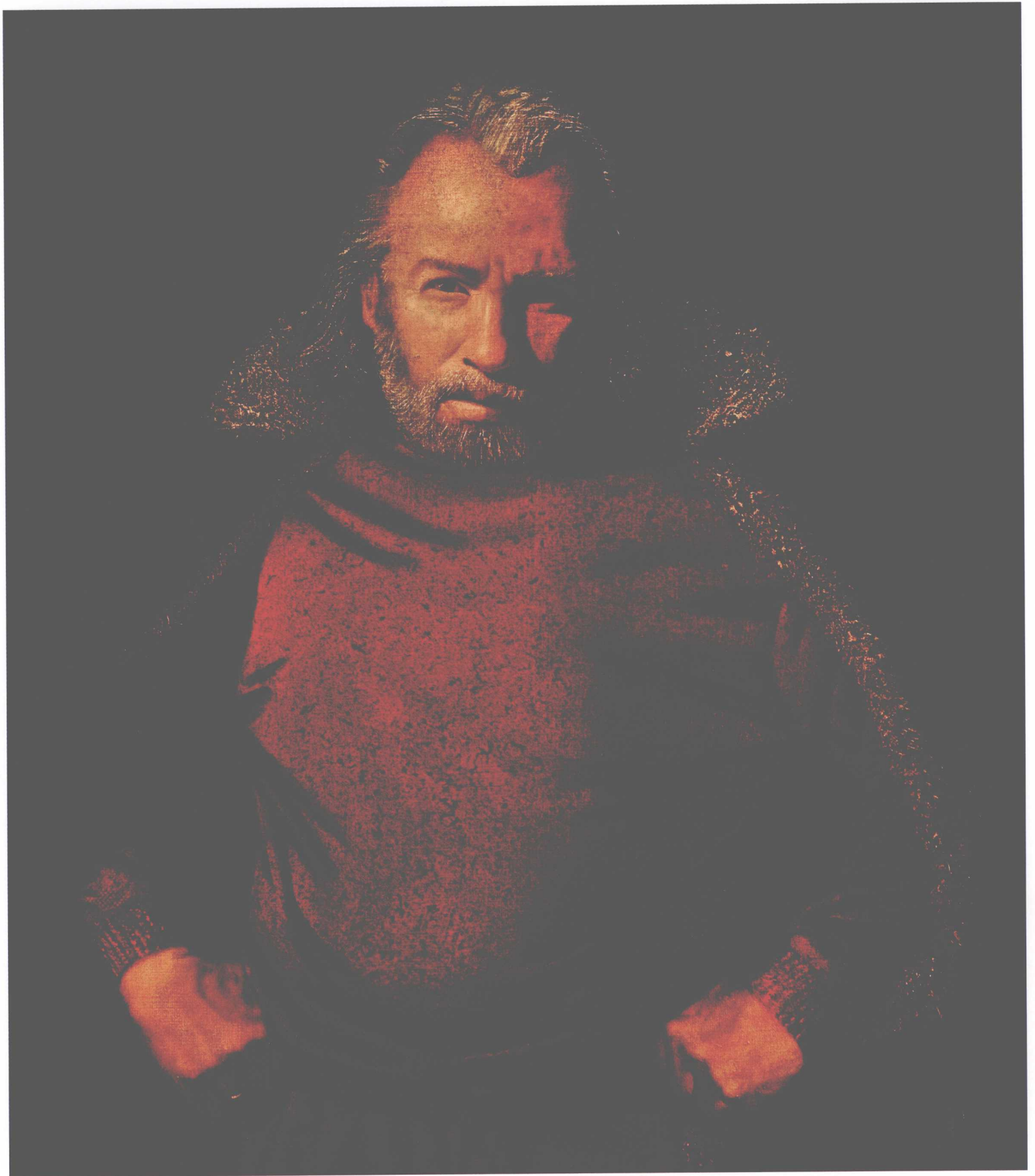
Отец, 40×35cm, холст, масло, 2010г. 父亲, 40×35cm, 麻布, 油彩, 2010年