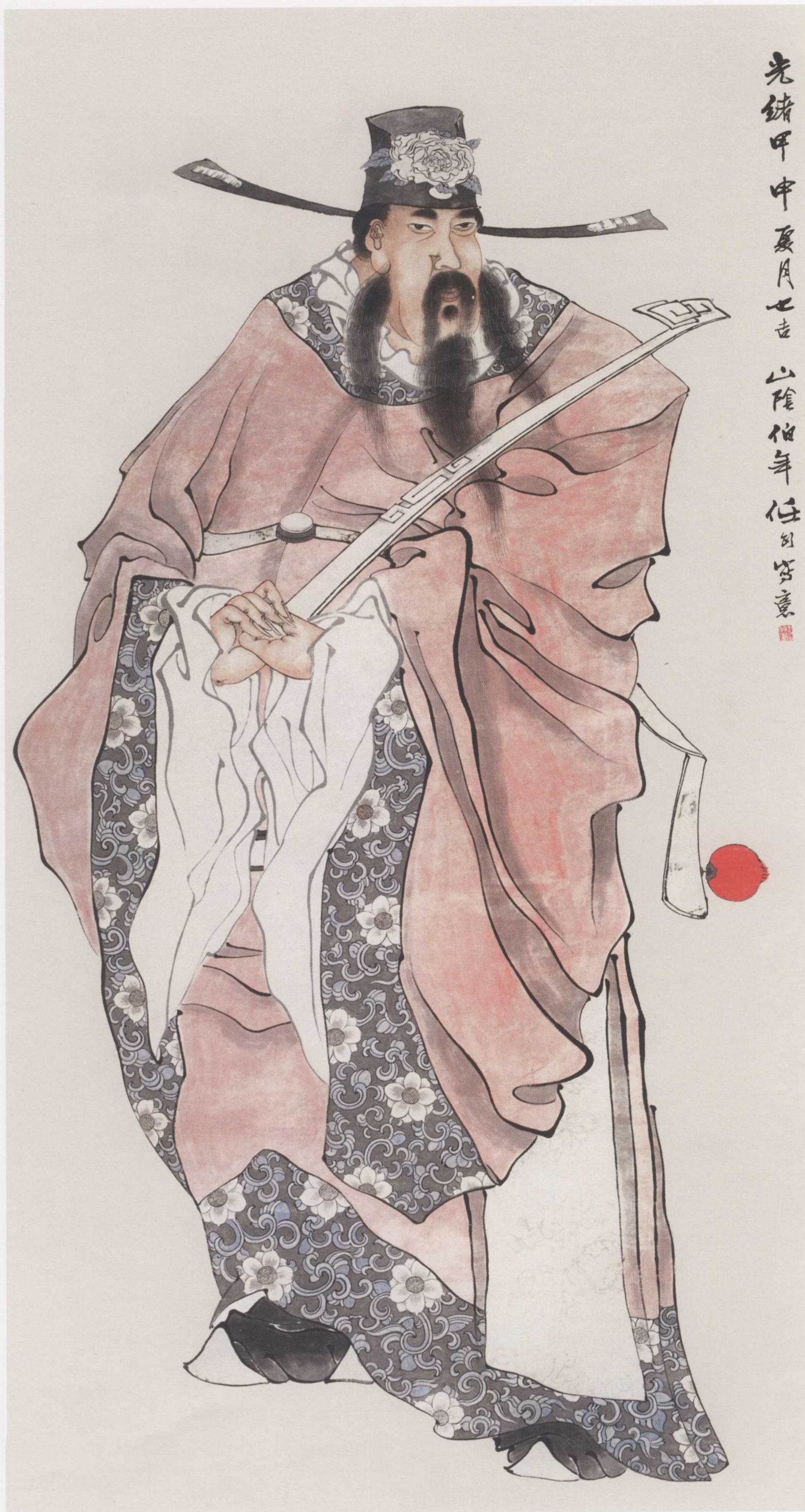
图 10. 写意人物 77cm × 143cm