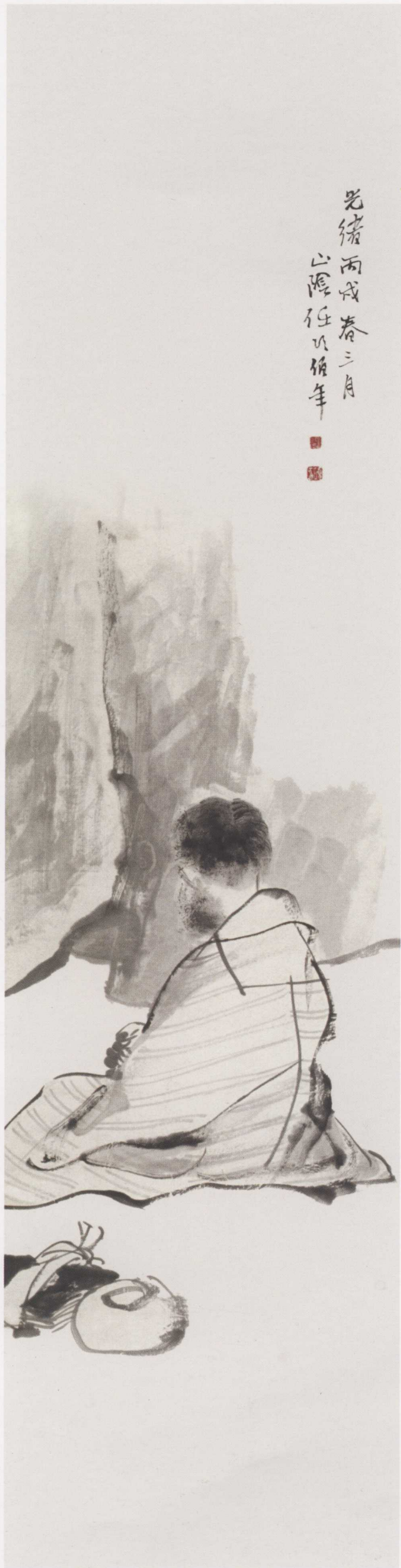
图 13. 佛 36cm × 143cm