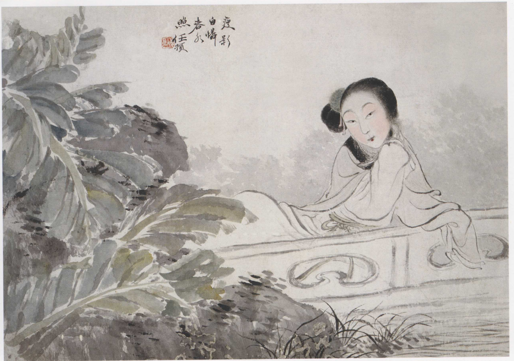
图6. 瘦影自怜 49cm × 33cm