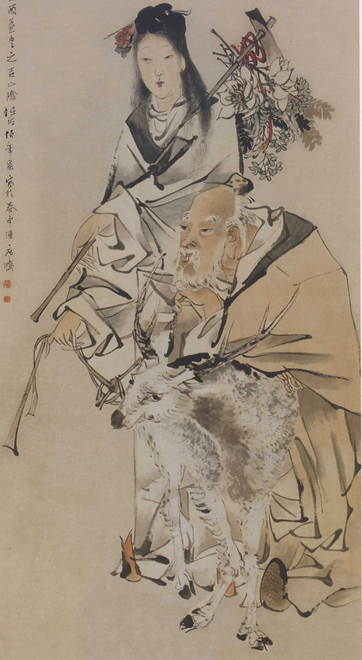
图2. 仙姑 79cm × 148cm