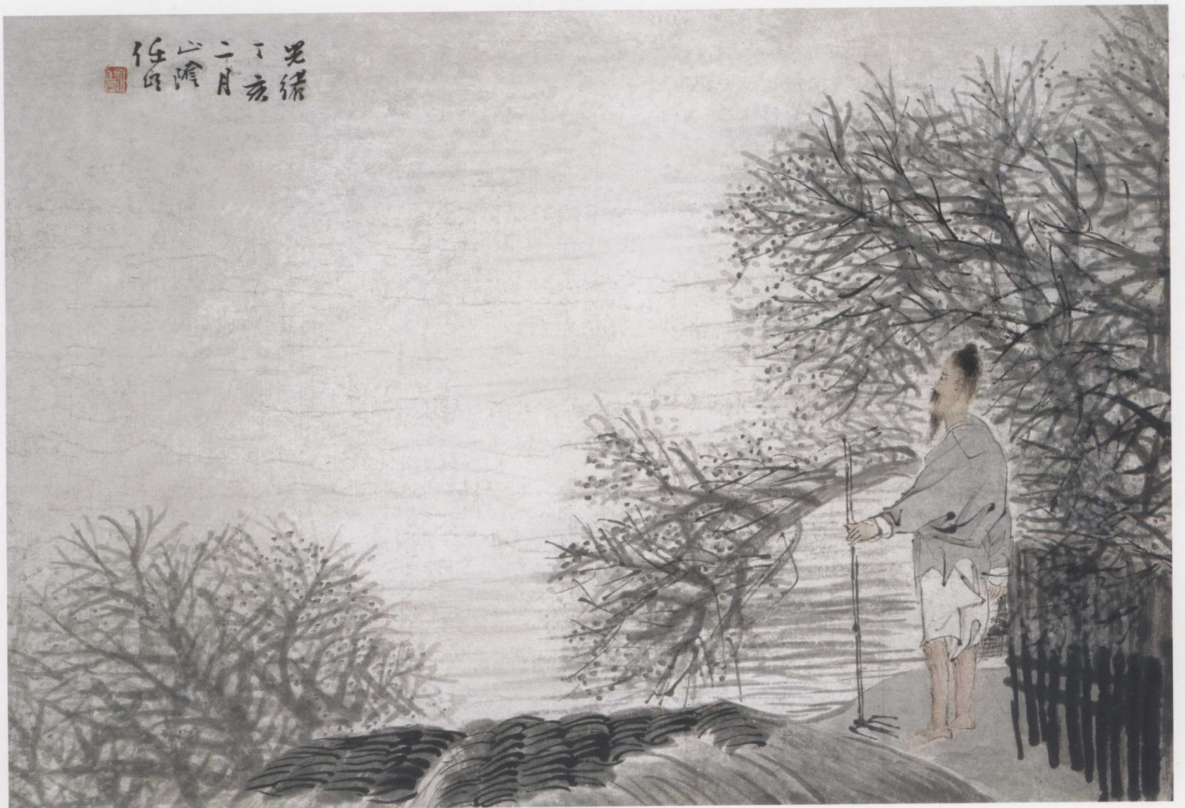
图7. 农家老者 49cm × 33cm