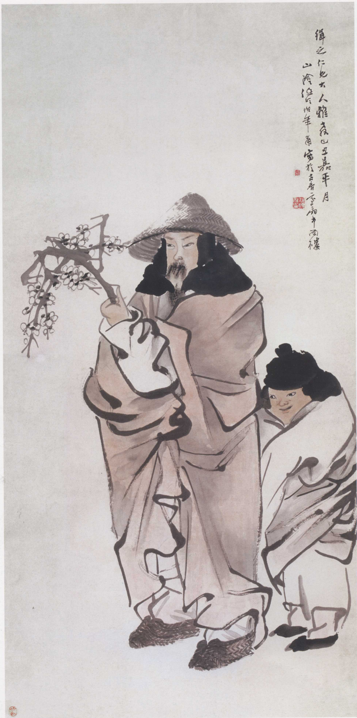
图5. 踏雪寻梅 66cm × 134cm