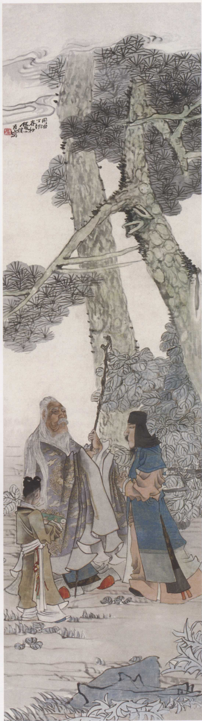
图 12. 松下叙语 40cm × 140cm