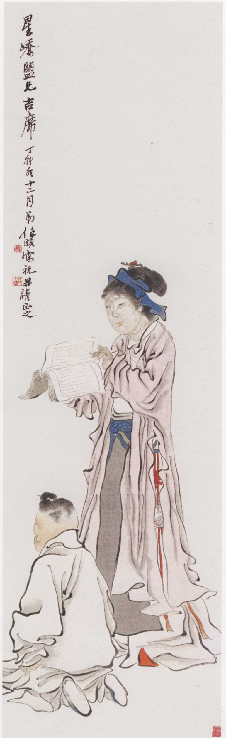
图 14. 教子图 39cm × 129cm