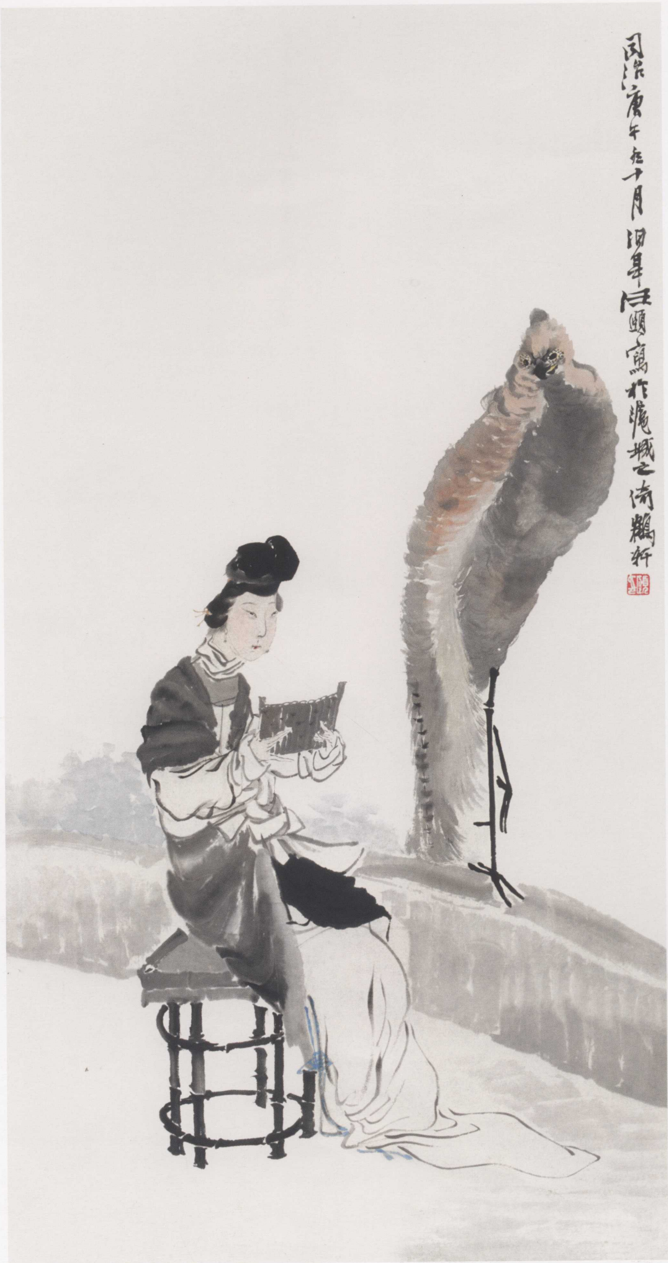
图 15. 读 40cm × 77cm