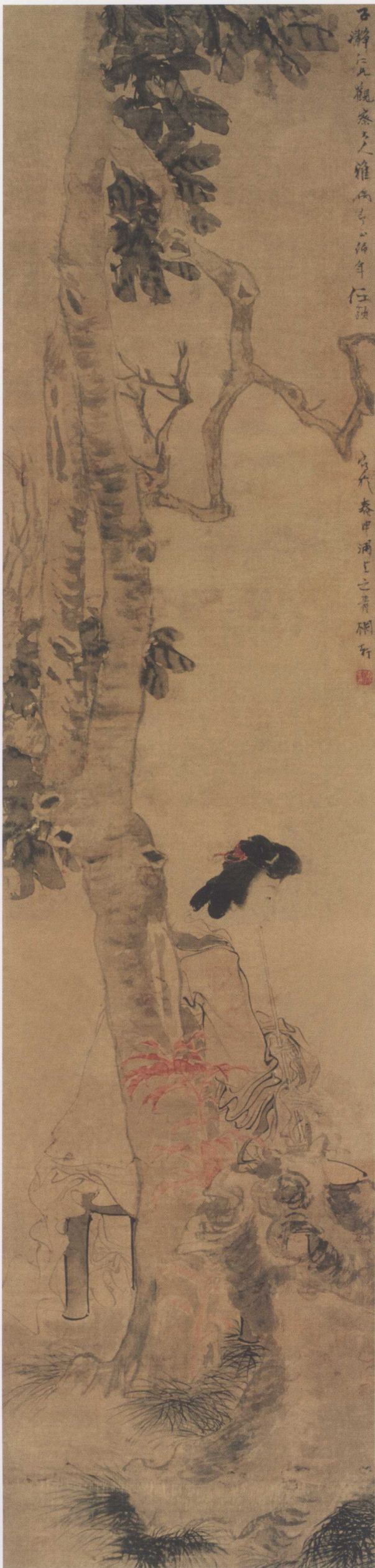
图 16. 树下玉女 31cm × 135cm