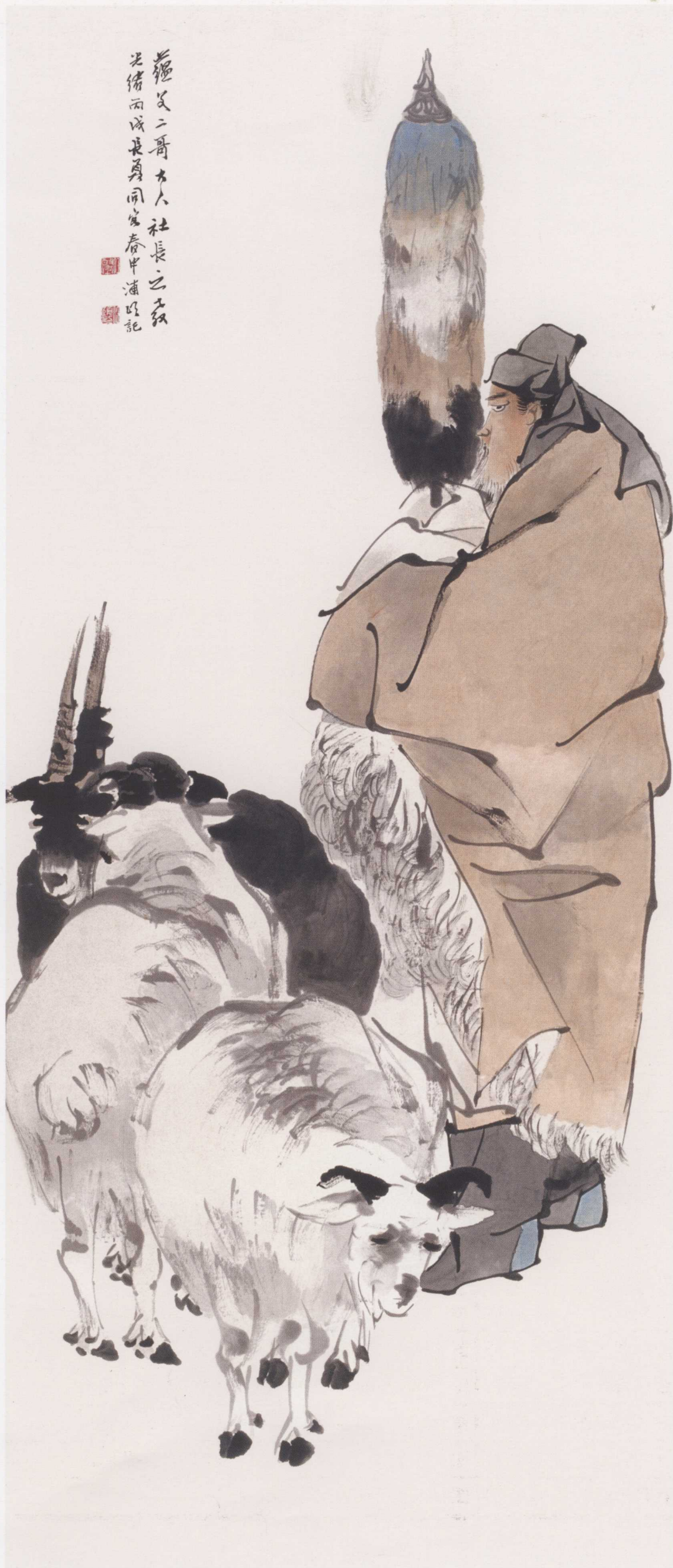
图1. 持节牧羊图 63cm × 145cm