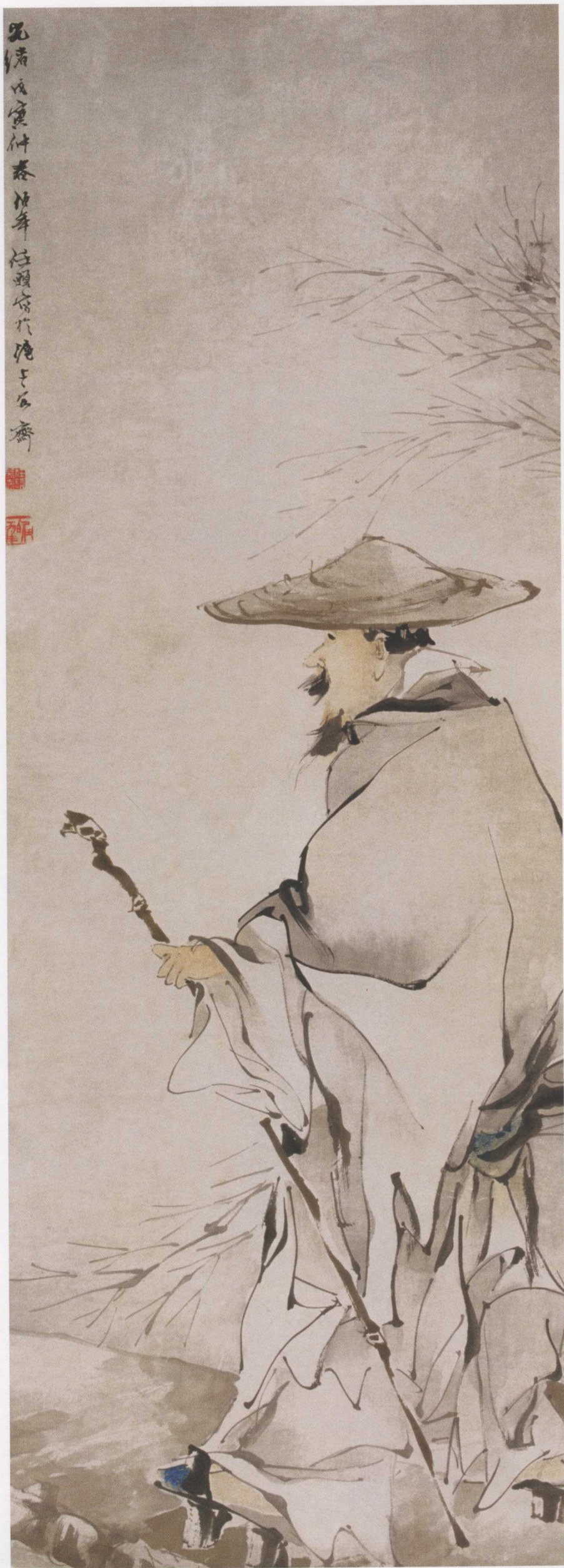
图 18. 执杖行 47cm × 173cm