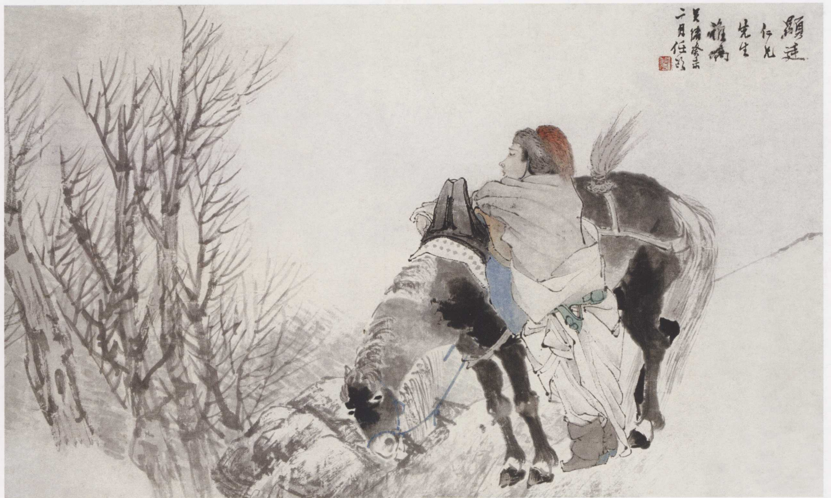
图4. 从军行 63cm × 38cm