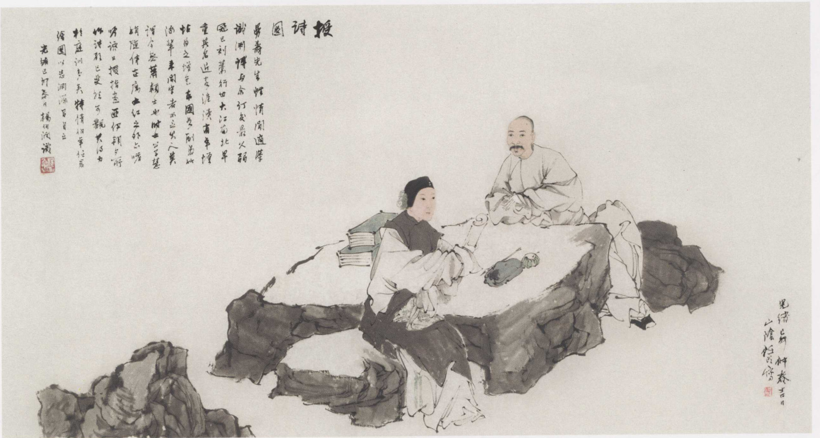
图8. 授诗图 97.7cm × 51.7cm