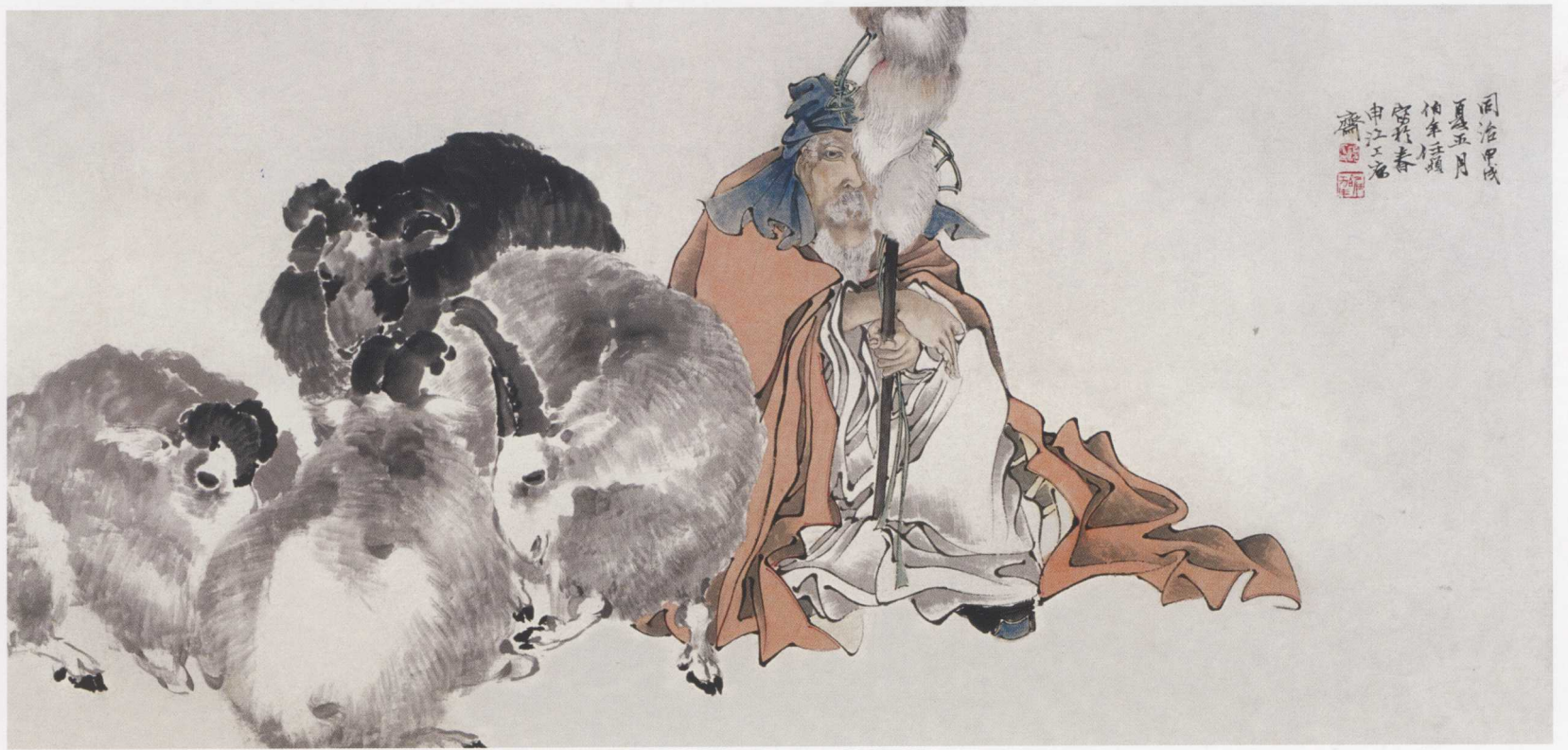
图3. 牧羊图 141cm × 67cm