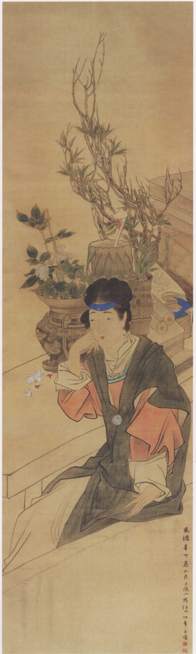
图 17. 倩女坐思图 47cm × 164cm