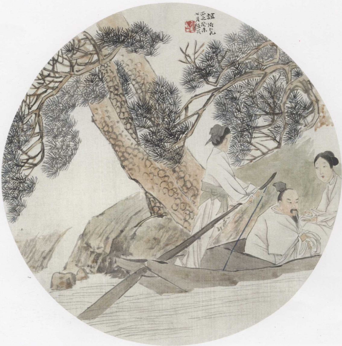
图9. 轻舟行 26cm × 26cm