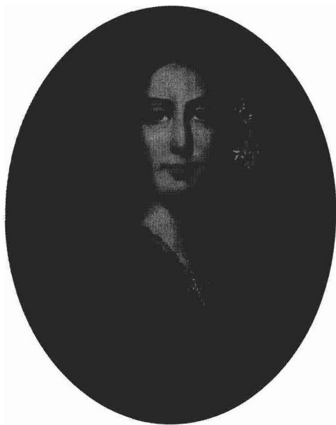
乔治·桑(George Sand, 1804—1876)

前启后者。最初是歌咏让他着迷(一度是个狂热的歌剧爱好者),但他却从没有试图写过一部歌剧,只专注于键盘创作。他是个热情澎湃的情人,但性格保守,反对公开谈性,然而却通过钢琴展示出他自己做梦都未曾梦到的爱情王国。他是世上最伟大的钢琴演奏大师——从小就是非凡的音乐神童——但是毕生却仅仅举行过三十多场演奏会。他具有很多女性性格(绝不同于阴柔),但他最投入的一场恋爱的对象却是以刻意的阳刚闻名——抽雪茄、穿男装的作家乔治·桑。这样的矛盾造就了他的艺术人生,而这样的内心冲突也是当时社会大环境的写照。