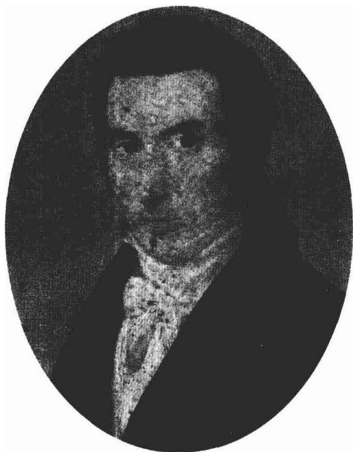
作曲家的父亲：尼古拉·肖邦 (Nicolas Chopin, 1771—1844)

几十年来，甚至连他的出生日期都颇具争议。一些传记作家从教区登记的记录中查到线索，认为是 1810 年 2 月 22 日，而另一些人按照肖邦本人的说法（他的母亲也持同样说法，当然她的话更可信），认为是 3 月 1 日。他的国籍也很难界定。父亲是法国人（确切地说是阿尔萨斯人），而母亲是波兰人。他在波兰度过前半生，在法国度过后半生。作为作曲家，他既是毫无争议的波兰人，同时又被看成法国音乐史上巴洛克和印象主义风格的承