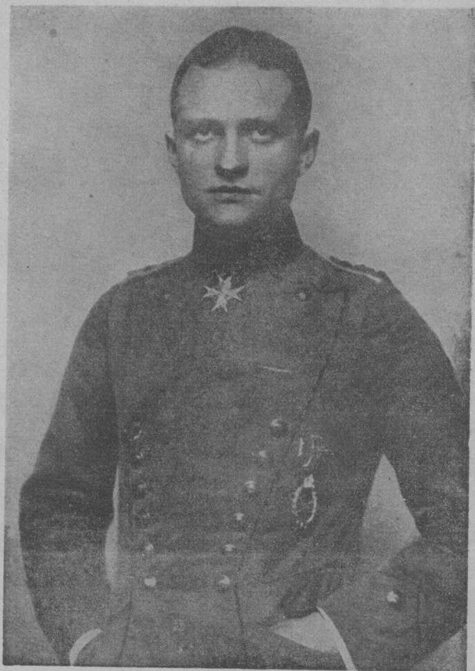
空戰之王 德國紅武士李希奮氏 (Baron Manfred von Richthofen)