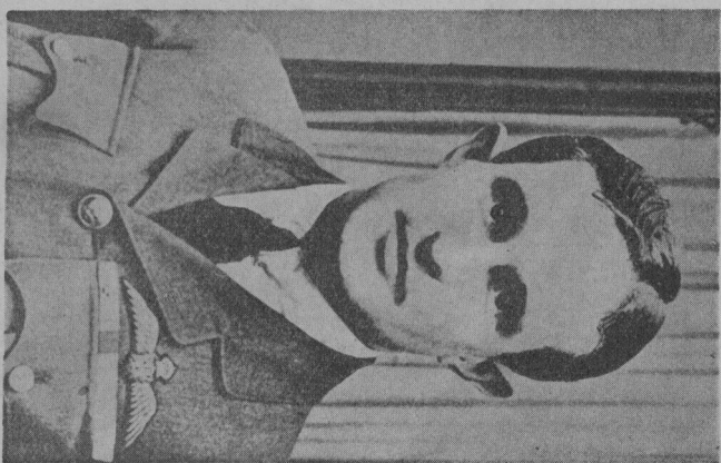
普光潑老克脫 (A. W. Beauchamp-Proctor)