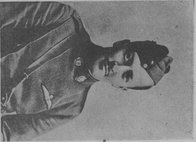
路特馬荷斯 (W. B. Rhodes-Moorhouse)