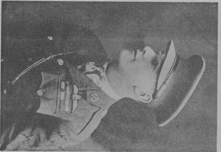
梅克登 (J. B. McCudden)