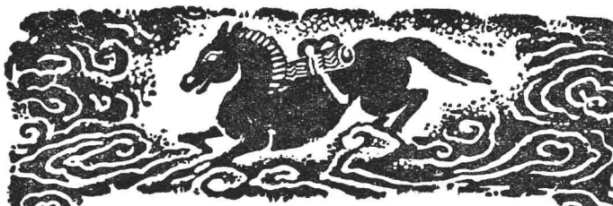
表 年 疑