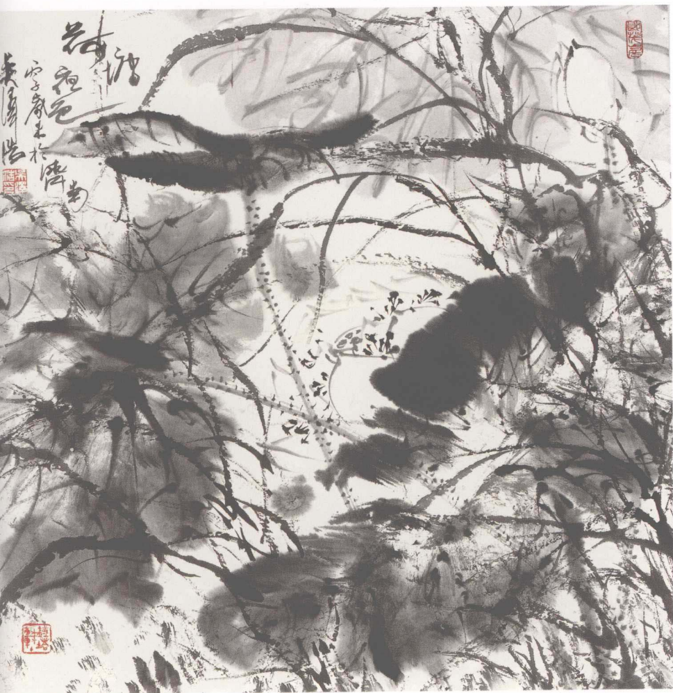
《荷塘》(纸本) 1996年 68 × 68cm