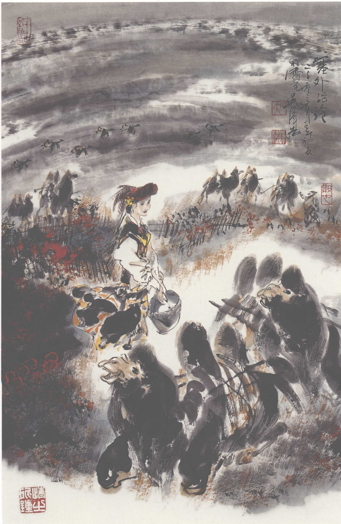
《塞外驼铃》(纸本) 2001年 68 × 45cm