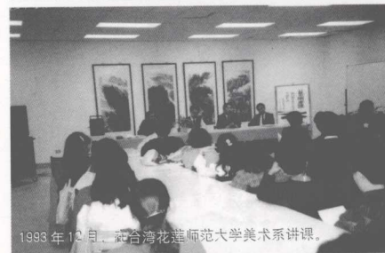
1993年12月，在台湾花莲师范大学美术系讲课。