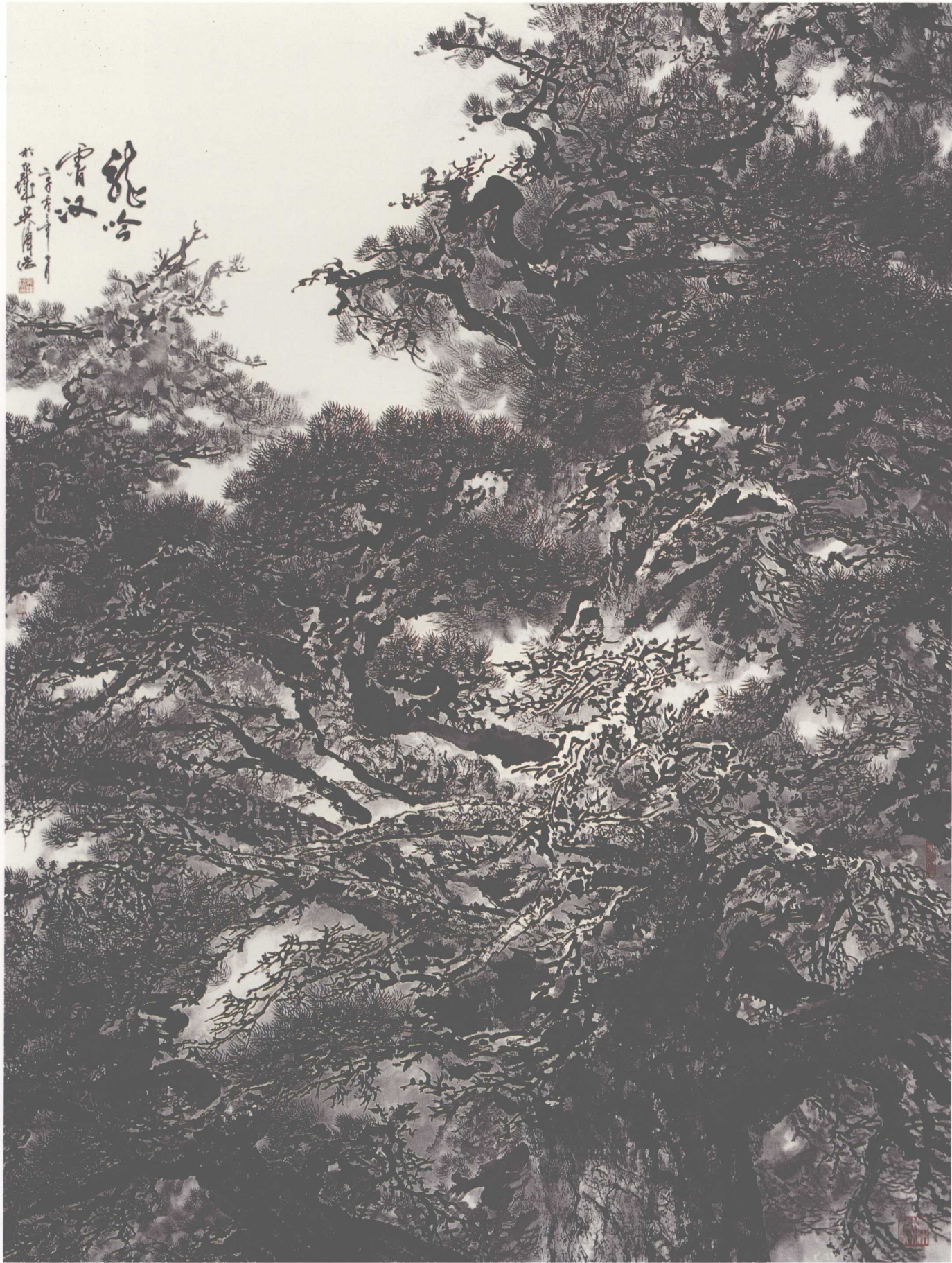
《龙吟霄汉》(纸本) 2002年 246 × 186cm