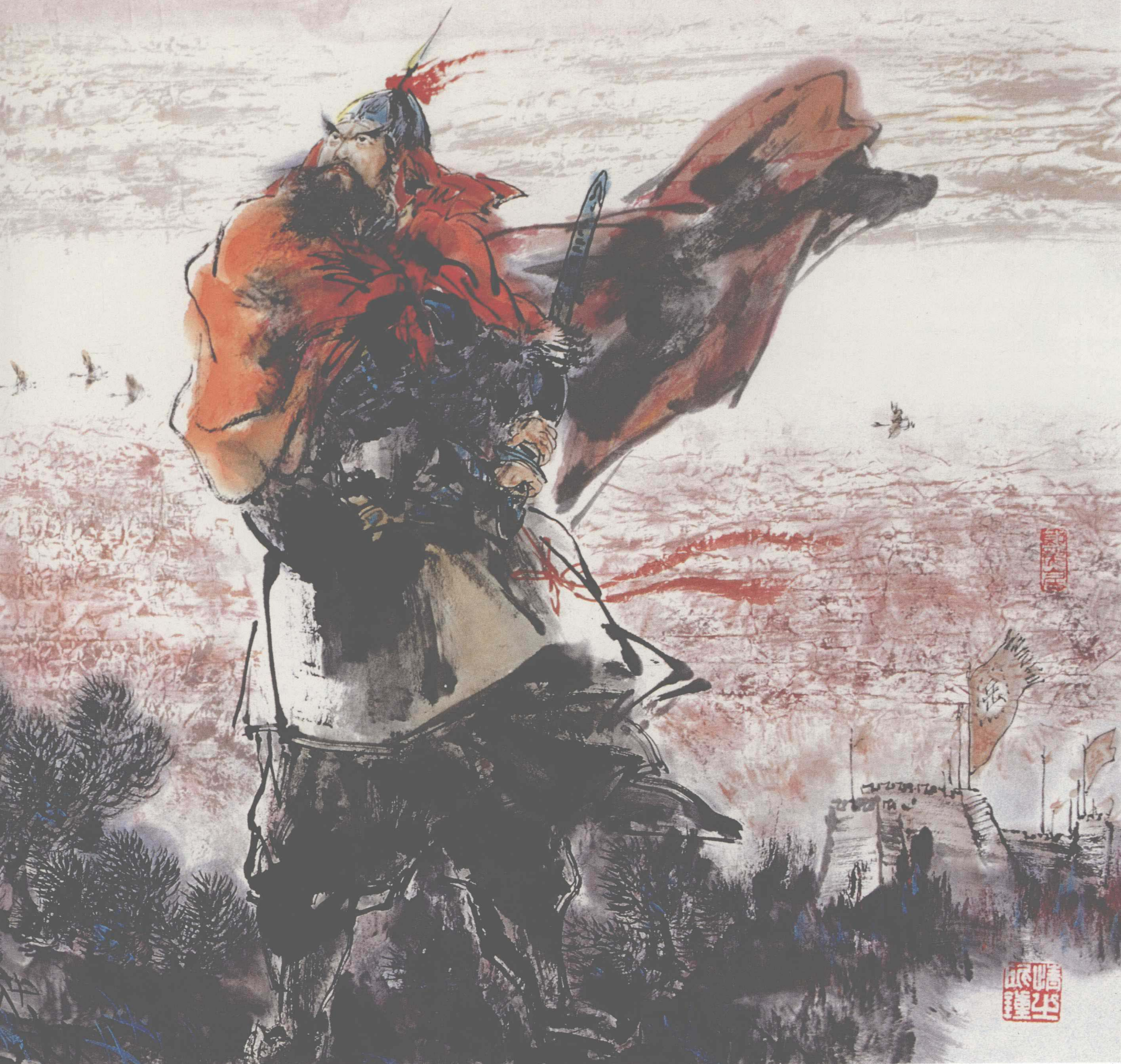
《满江红》(纸本) 1999年 137 × 69cm