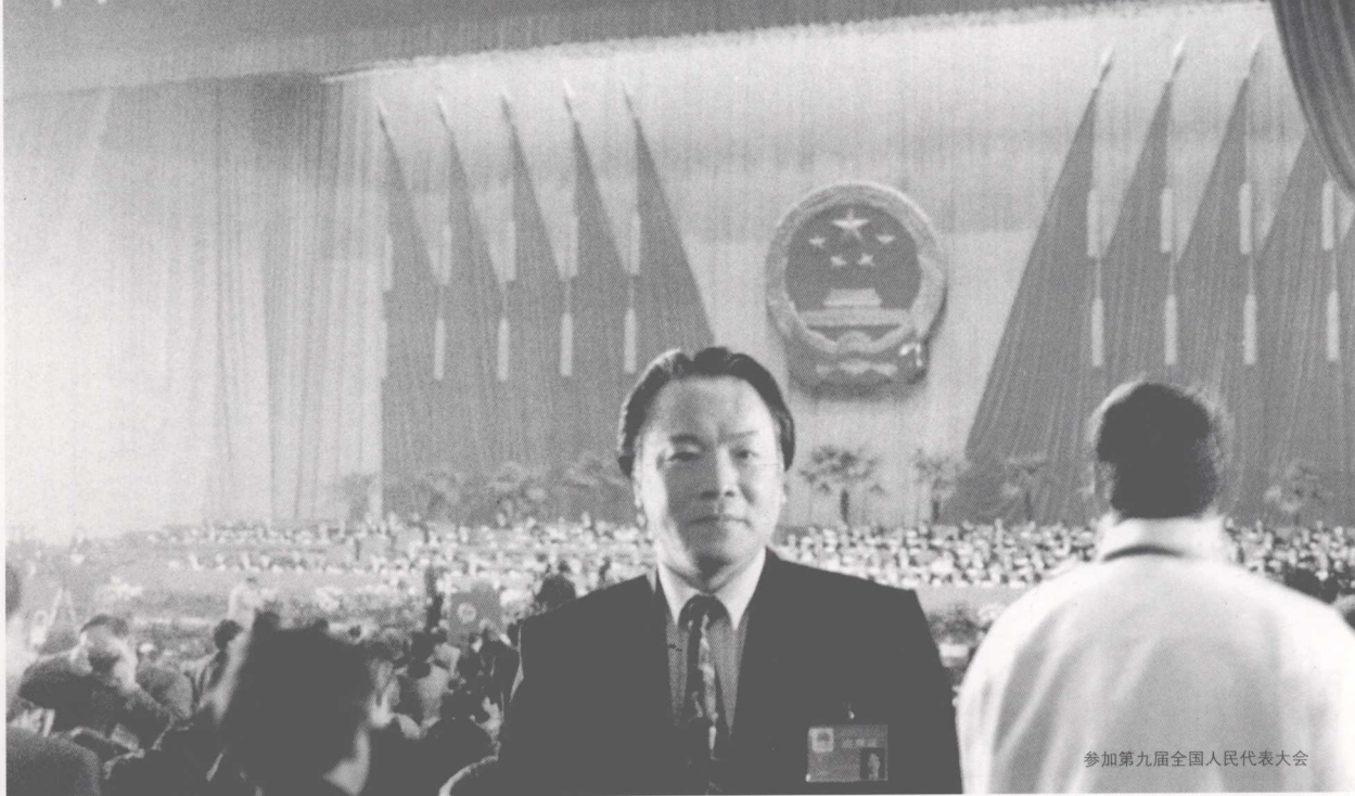
参加第九届全国人民代表大会