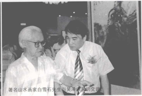
著名山水画家白雪石先生与吴泽浩亲切交谈。