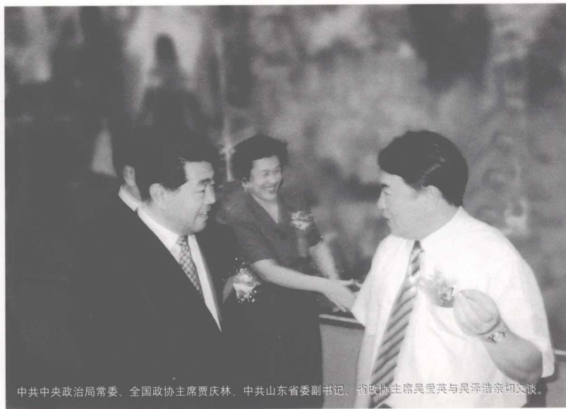
中共中央政治局常委、全国政协主席贾庆林，中共山东省委书记、省政协主席吴爱英与吴泽浩亲切交谈。