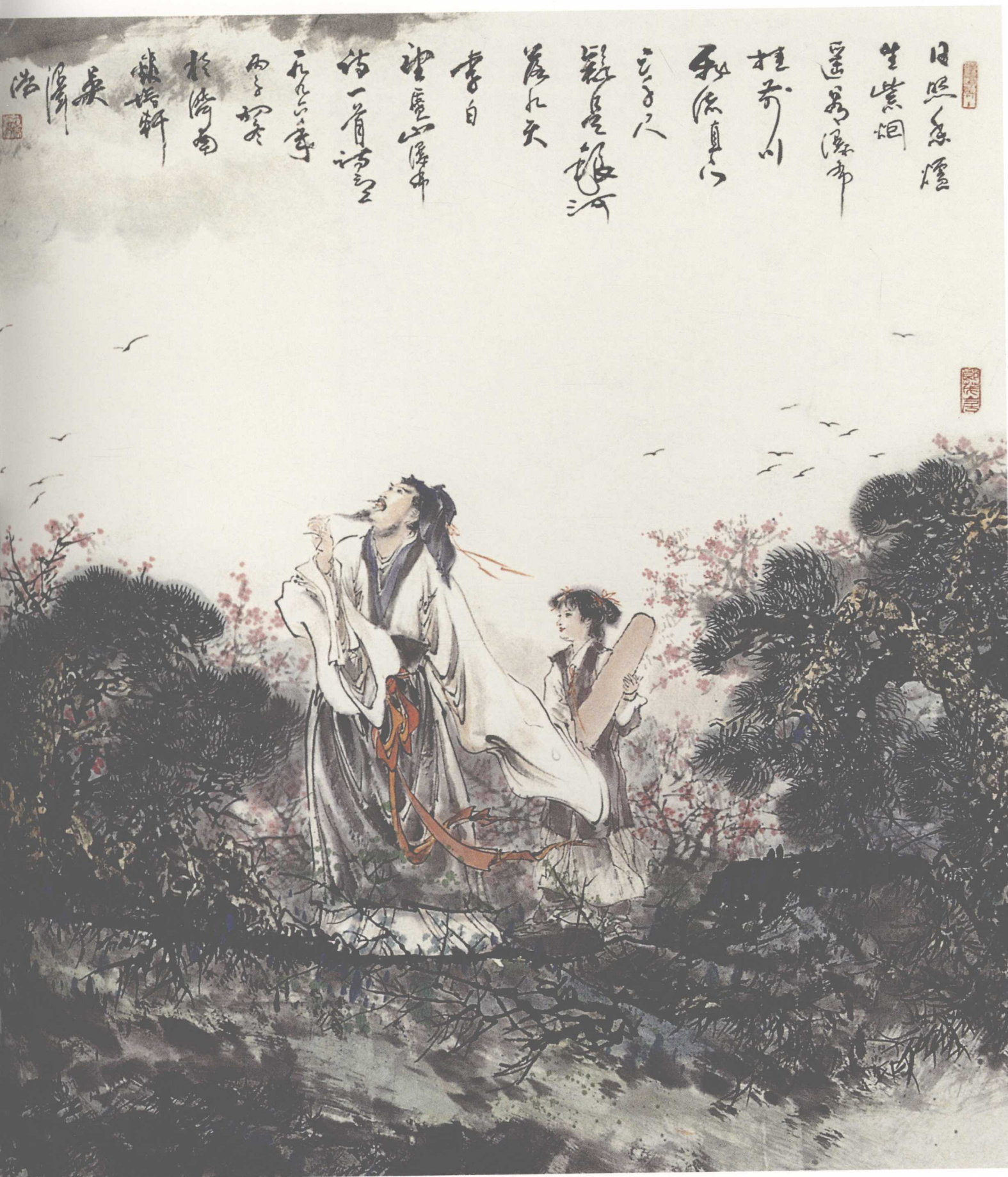
《李白观瀑图》(纸本) 1998年 180 × 96cm