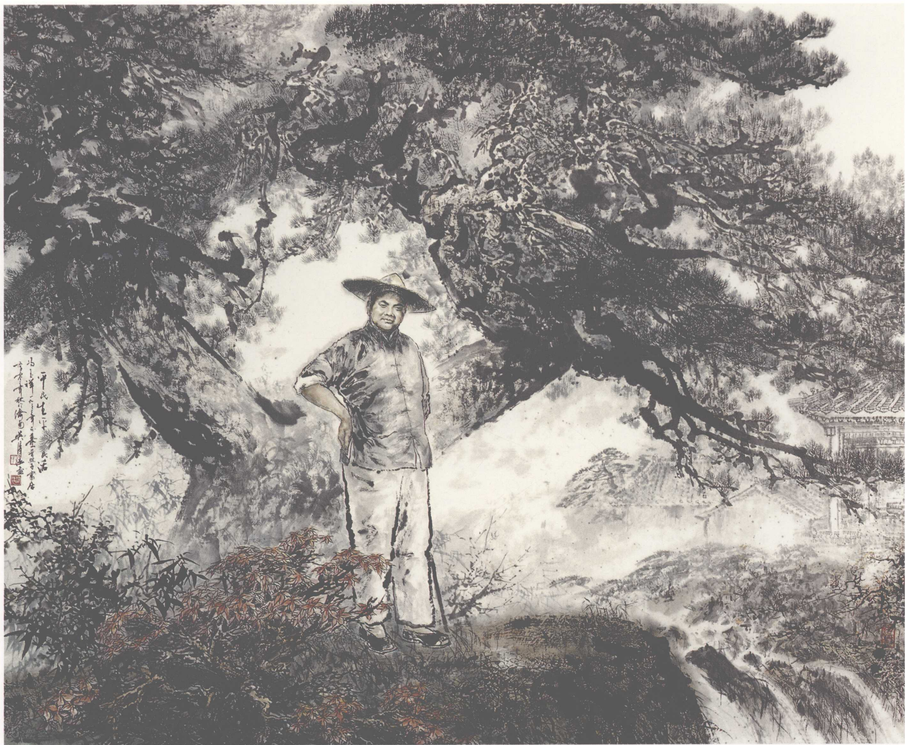
《平民生平生活——冯玉祥在泰山》(纸本) 2002年 225 × 185cm