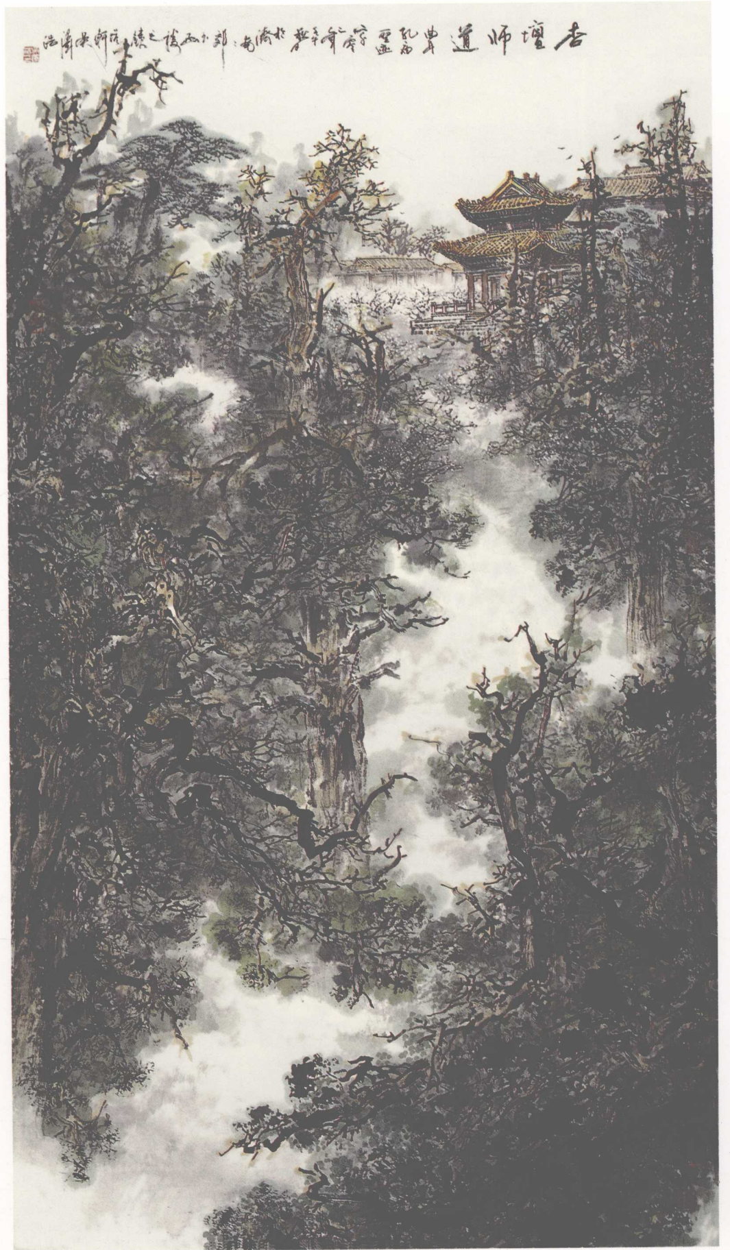
《杏坛师道》(纸本) 2002年 192 × 110cm