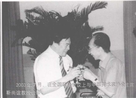
2003年7月，在全国政协会议上与中国美术家协会主席靳尚谊教授合影。