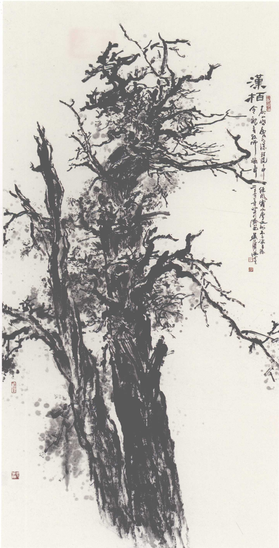
《汉柏》(纸本) 2002年 246 × 186cm