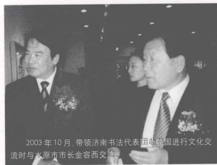
2003年10月，带领济南书法代表团赴韩国进行文化交流时与水原市市长金容西交流。

吴泽浩的山水画，蕴含诗的韵味。呈现和自然融合一体的气息和返朴归真的美。对于中国画的山水传统技法，他是稔