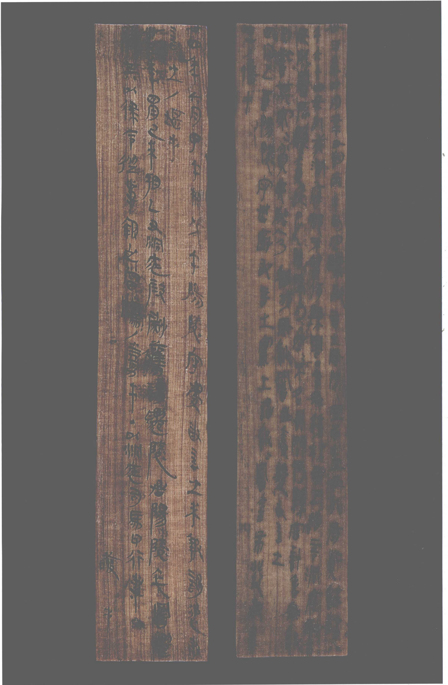
秦·里耶簡牘(3)(①正面 ②背面)