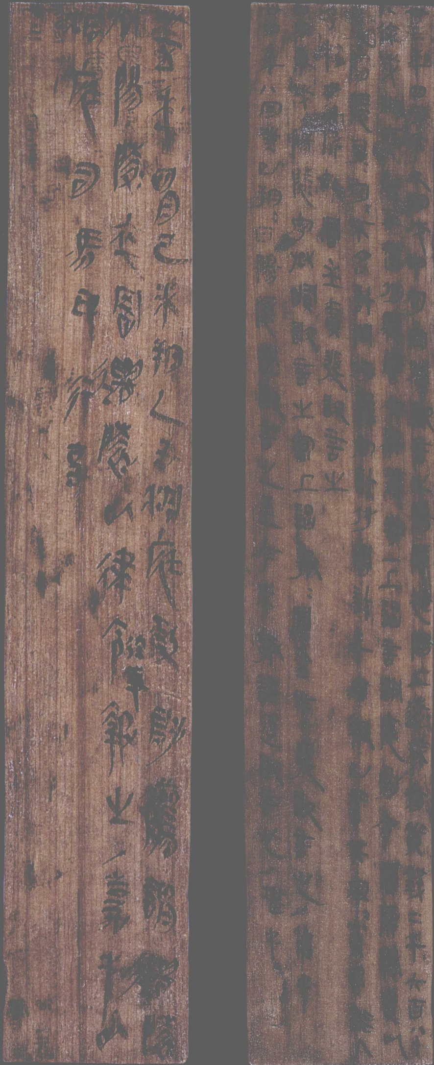
秦·里耶簡牘(2)(①正面 ②背面)