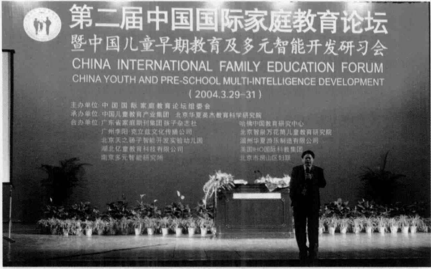
欧阳维建在第二届中国国际家庭教育论坛上发表主题讲话