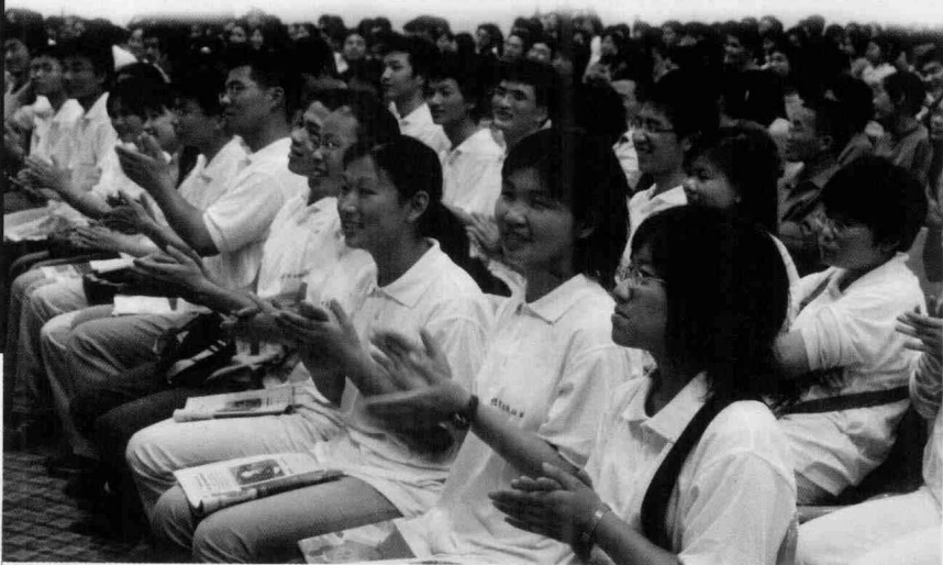
欧阳老师为华南师范大学的大学生讲课