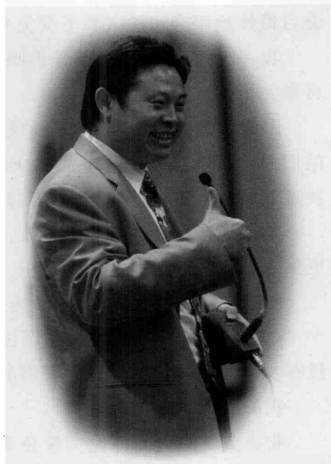
欧阳老师为华南师范大学的大学生讲课

我的朋友说：“领导说得好的地方，我几乎也没有什么感受，但是领导讲得不好的时候，我就会马上觉察出来，而且还