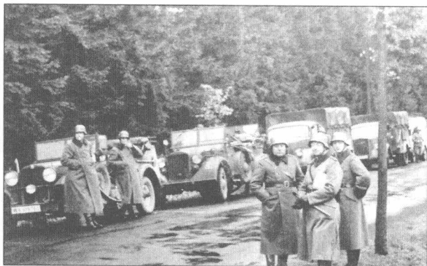
左图：在吞并奥地利之前，许多德军车辆在德国南部的一条道路上排成长达3.2公里（约2英里）的纵队，等待跨越德奥边境线。

步兵师编组进摩托化师，增强战斗及战术机动能力。希特勒确信，大力扩充装甲及摩托化部队，将有助于德国陆军实现“攻势防御”或其他“更具有野心或更长远的目标”。