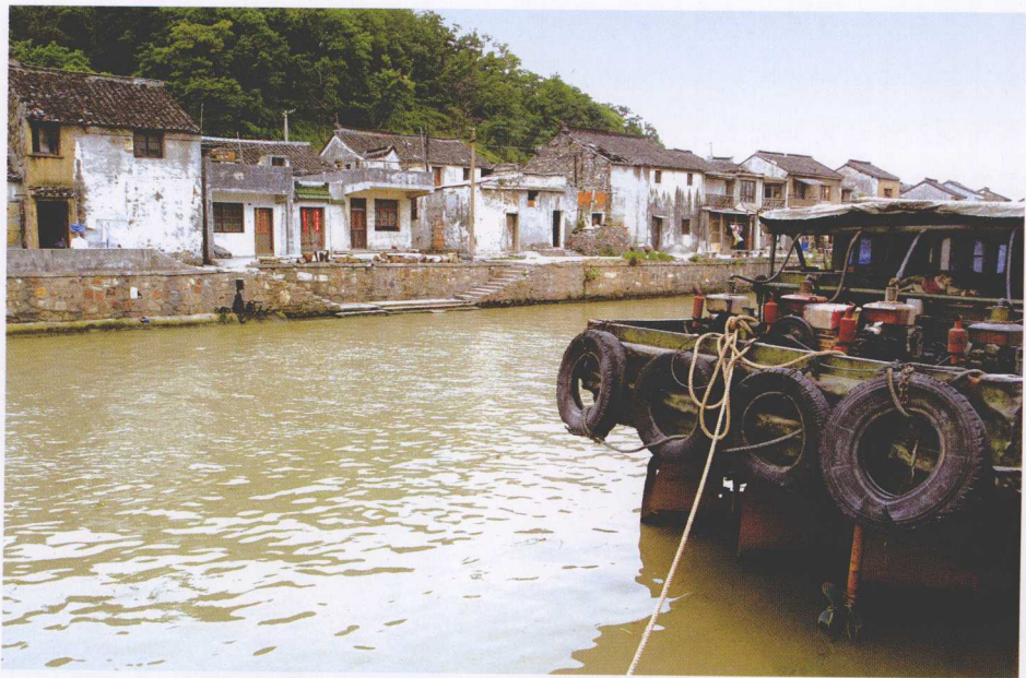
● 宜兴河道中运送紫砂器的驳船

在宜兴丁山、蜀山、汤渡的河道中停泊着各种装载紫砂器的驳船。驳船是宜兴陶文化的一道风景线，是紫砂器对外运输的主力。