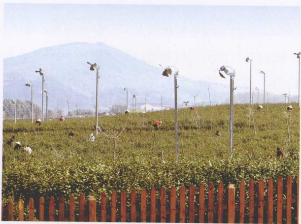
● 宜兴的采茶工人正在“防霜扇”下采摘春茶

宜兴是中国产茶的名区和久负盛名的古茶区，也是目前江苏省最大的茶叶产区。早在三国时期，宜兴所产的“国山苑茶”，就已经享誉江南，唐代更以“阳羡唐贡茶”名扬天下。宜兴气候温和湿润，四季分明，生长着品种繁多的宜兴茶。宜兴茶的著名品种包括“阳羡雪芽”、