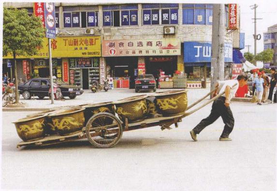
● 宜兴街头随处可见运送紫砂器的人

陶文化是宜兴城市和旅游的名片。在历史上，宜兴制陶已有七千多年的历史，该地的制陶业从古到今一直非常发达。根据骆驼墩史前文化考古发现，早在七千三百多年前，宜兴就有制坯烧陶的历史。七千多年来，宜兴人创造了灿烂辉煌的陶文化和巧夺天工的陶瓷艺术，为宜兴赢得了“陶都”的美誉。宜兴陶瓷以紫砂陶、精陶、均陶、彩陶、青瓷“五朵金花”享誉世界，尤其是紫砂陶中的紫砂壶堪称世界一绝。因此，现代宜兴开辟了以陶文化为主题的旅游专线，陶文化游吸引了众多的中外游客。馆藏丰富的中国宜兴陶瓷博物馆是宜兴陶文化游的主要景点，也是完美展现宜兴陶文化的最佳舞台。