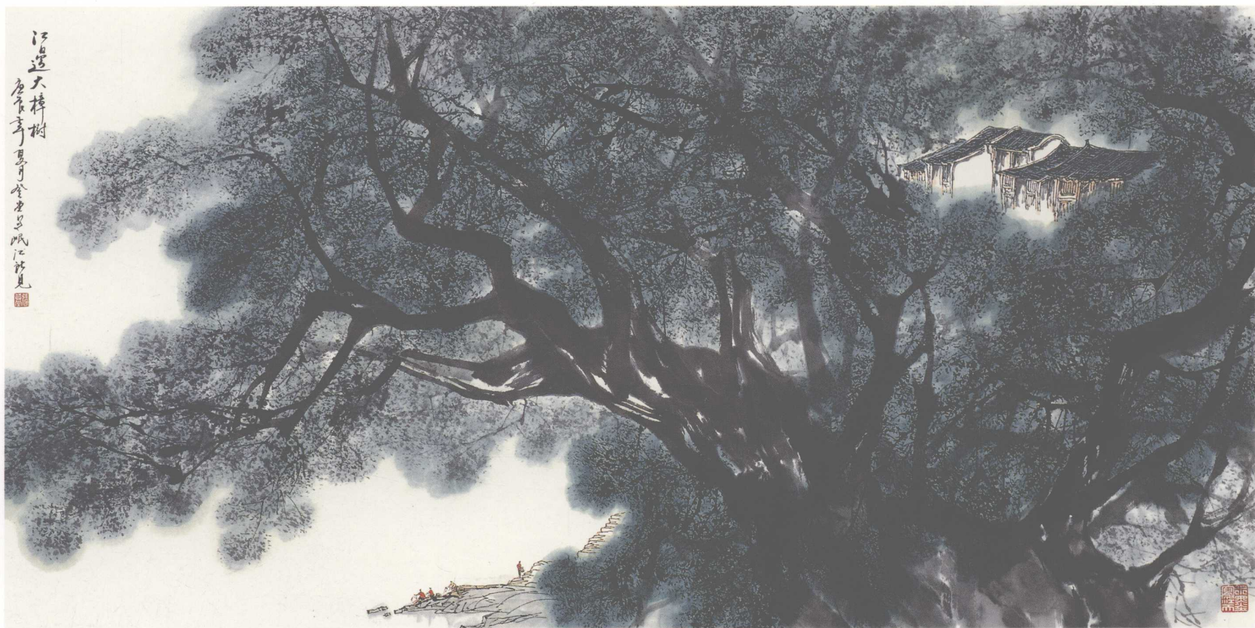
《江邊大樟樹》(紙本) 1994年 136 × 68cm