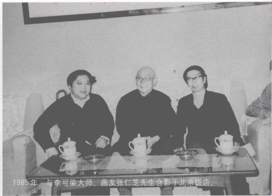
1985年，与李可染大师、画友张仁芝先生合影于北京饭店。