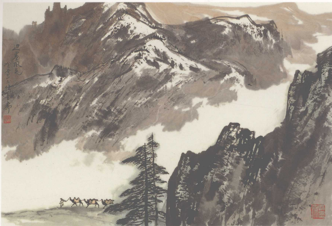
边塞风光 1997年 138x98cm

主 编：王 鹤 责任编辑：吕 晓 于福庚 执行编辑：郑 睿 文字总监：王文鹏 装帧设计：张长岭 责任印制：赵 恒