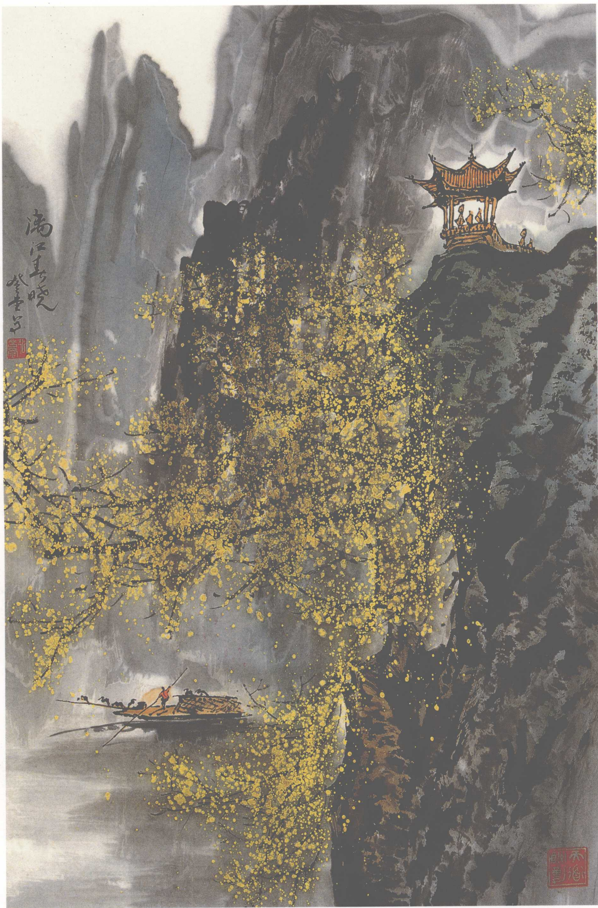
《漓江春晓》(纸本) 2001年 186 × 145cm