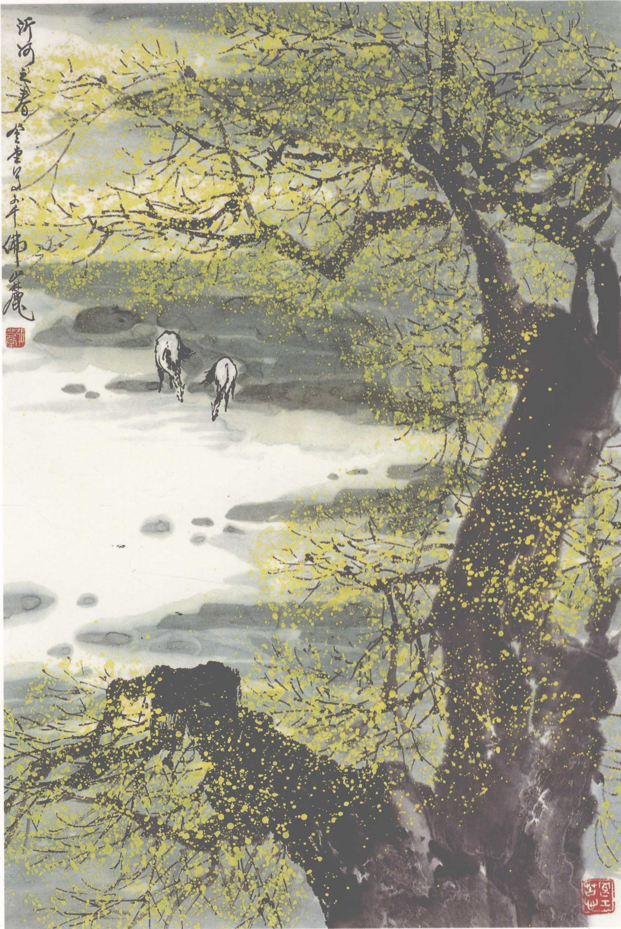
《沂河之春》(纸本) 1995年 186 × 145cm