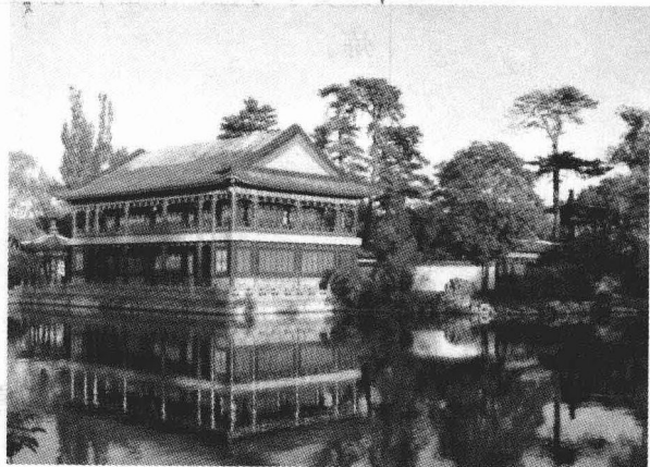
承德避暑山庄一景

二、慈禧并没有得到家庭的温暖，也没有优裕的生活条件。慈禧出生于一个仕宦之家，有二兄一妹。在中国古代重男轻女的年代，儿子既可传宗接代，又可入仕为官，光宗耀祖，而女子则只能成为“生育工具”，至多为人“主内”。由于父母之重照祥、桂祥兄弟二人，轻慈禧及其妹妹二人也是自然的。父母对于儿子的要求尽量满足，而女儿对父母的要求经常难以得到满足是