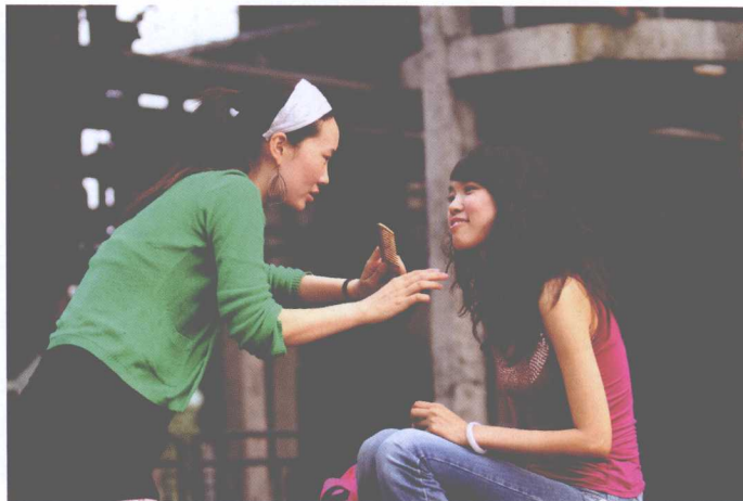
▲ 尊重模特，营造良好的氛围，才能有更多的机会拍到更好的照片

✗ 避免不必要的肢体触碰。如果需要调整模特的动作、头发或衣服，尽量口头指导、自己示范或者请现场的女性朋友帮忙。