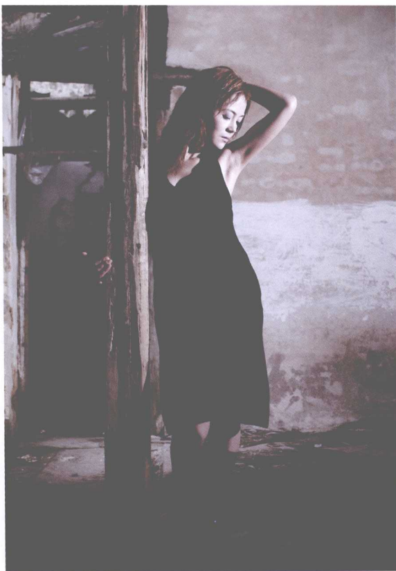
▲ 线条硬朗的场景能够彰显模特的时尚个性