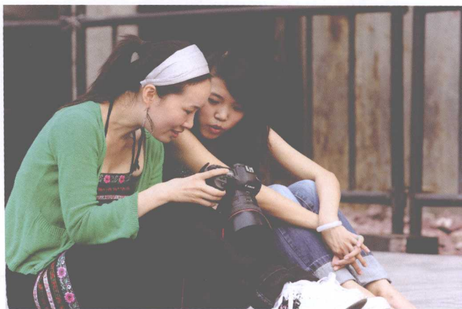
▲ 与模特分享照片，是在下一阶段获得提升的有效方式