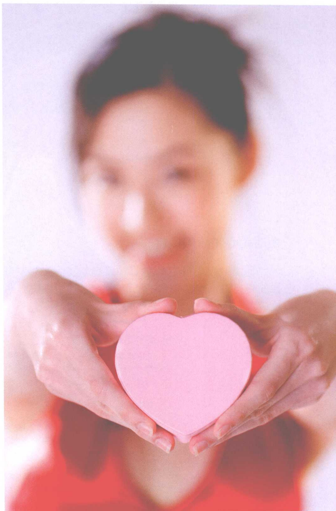
▲ 任何时候拍摄人像都要注重肖像权，避免不必要的纠纷

• 拍摄模式：手动 • ISO：100 • 光圈：f/2.8 • 焦距：135mm • 快门速度：1/160s