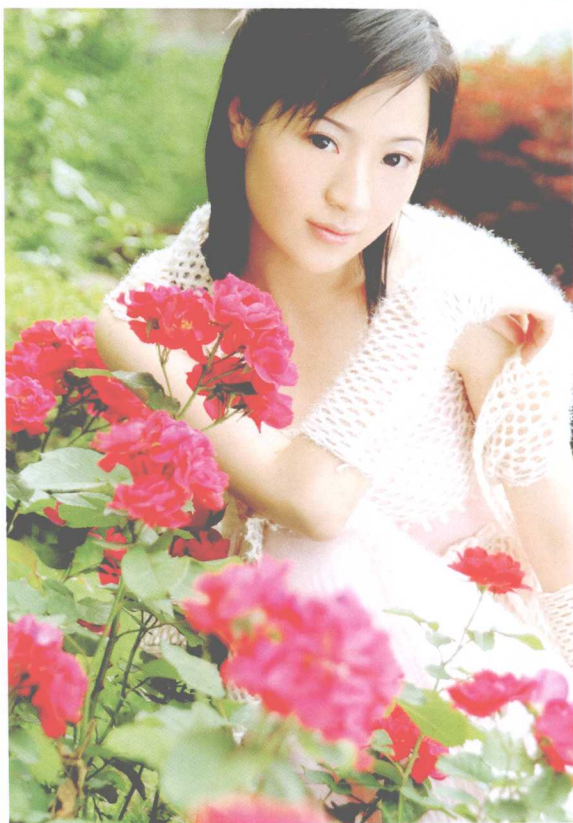
▲ 色彩亮丽的场景适合拍摄唯美的写真画面