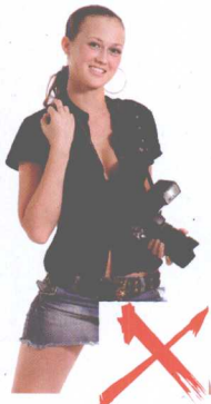
▲ 女性应避免穿着过于短窄的裙装，以免在拍摄时“走光”