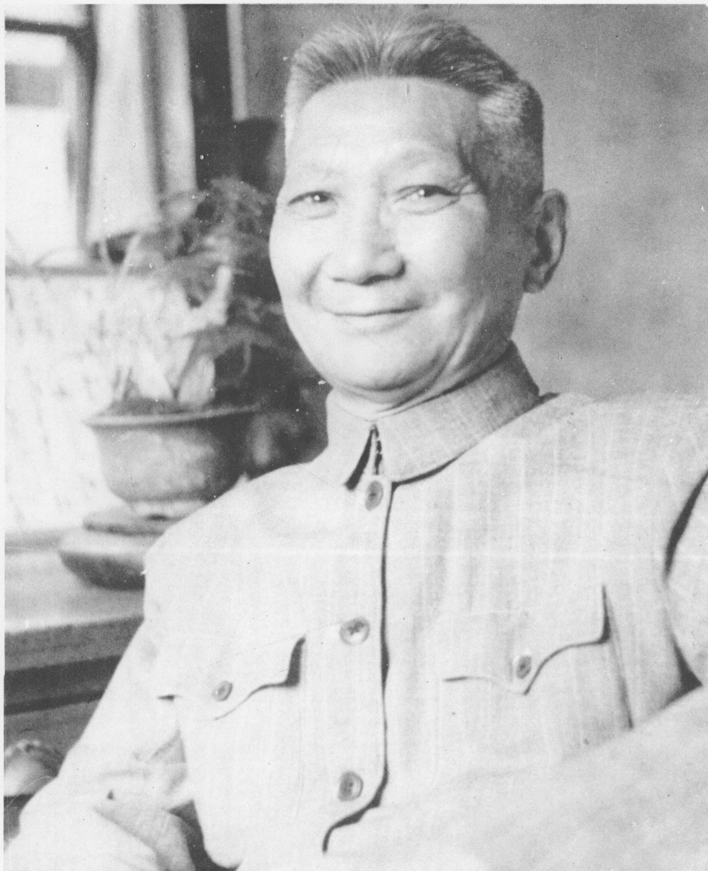
高 二 适