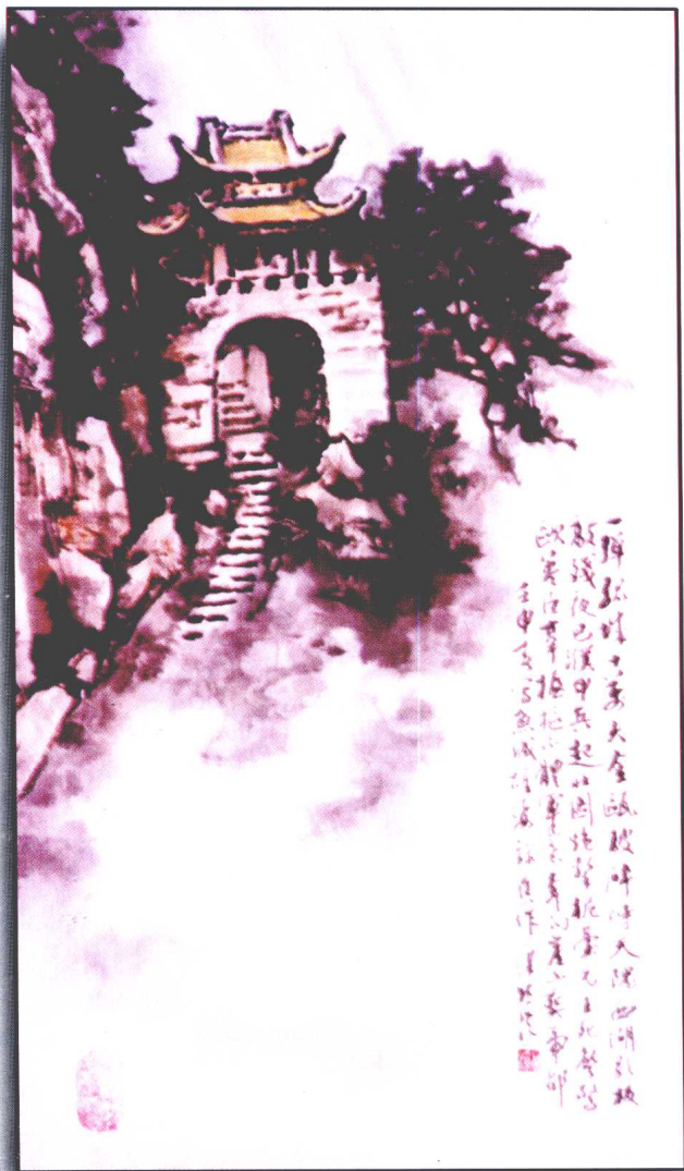
周北溪：《钓鱼城怀古》诗意图 周北溪 作

一弹孤城十万夫，金瓯破碎峙天隅。 西湖歌板敲残夜，巴濮甲兵起壮图。 炮击桅台元主死，声惊欧亚荇臣辜。 握枢不体军民意，奔向崖山葬帝都。