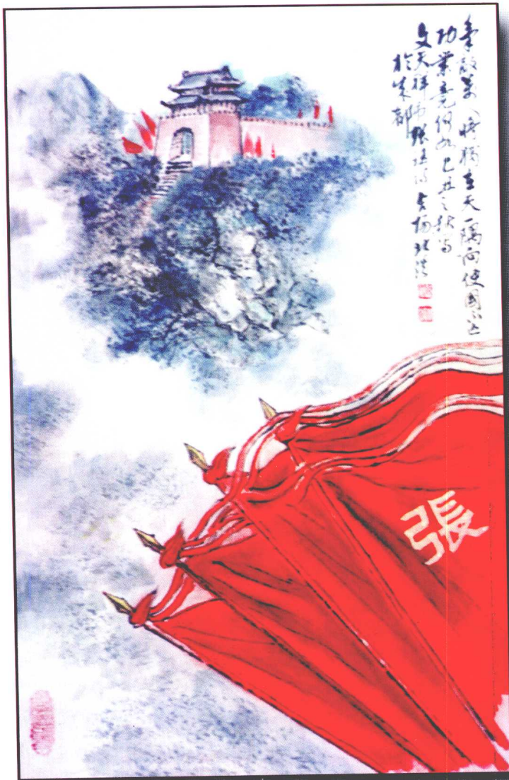
文天祥：《张制置珏》诗意画 周北溪 作