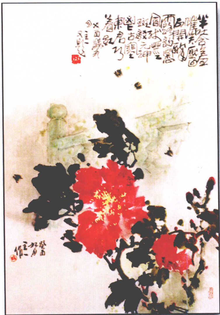
杨祖懿：《鱼城牡丹》 诗意画 杨祖懿 作