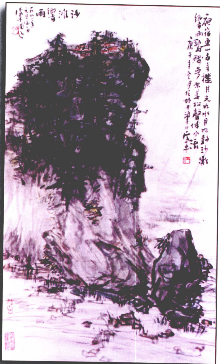
江从革：《沙滩响雨》诗意画