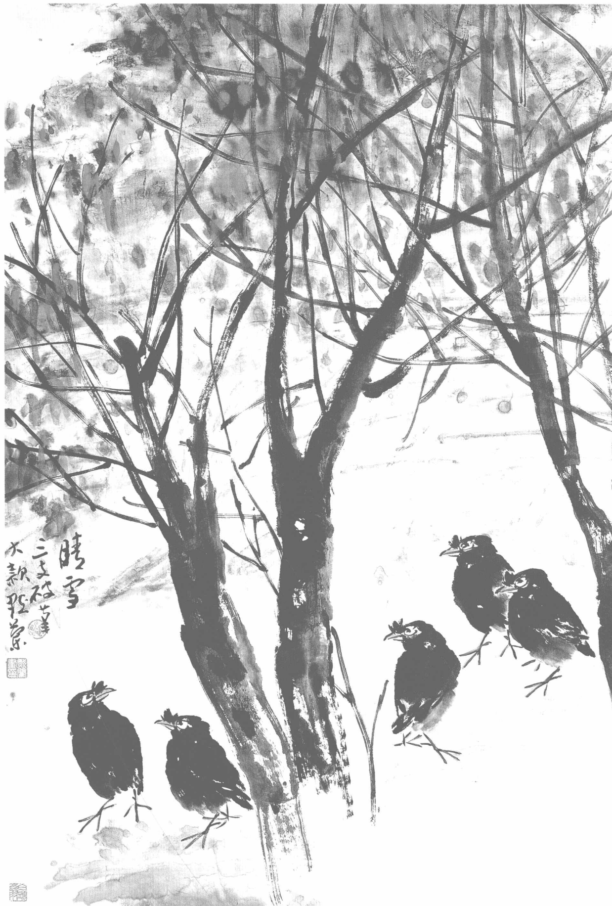
© 晴雪 2004年 纸本 132cm × 89cm