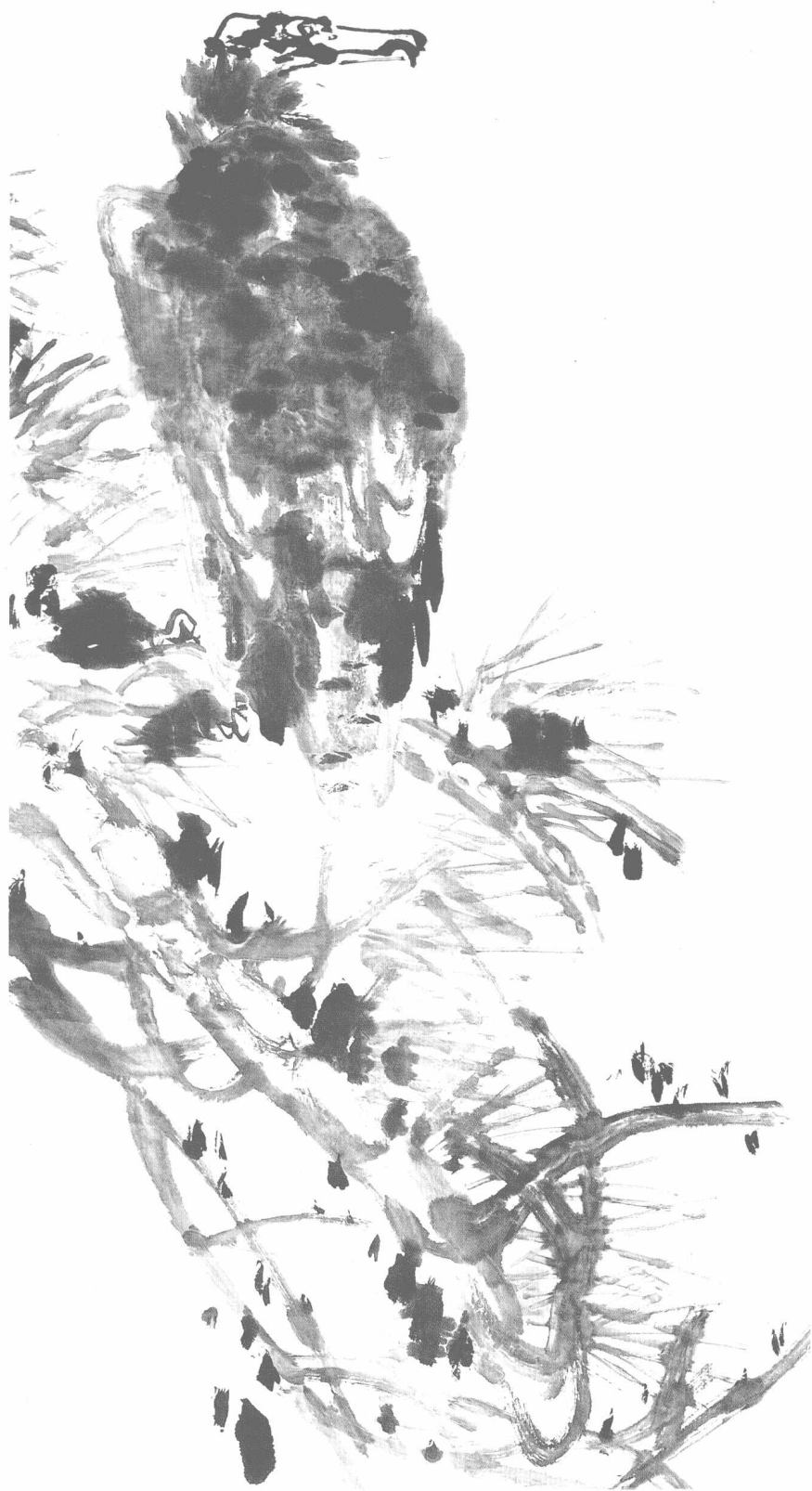
◎ 鹭 1984年 纸本 133cm × 60cm