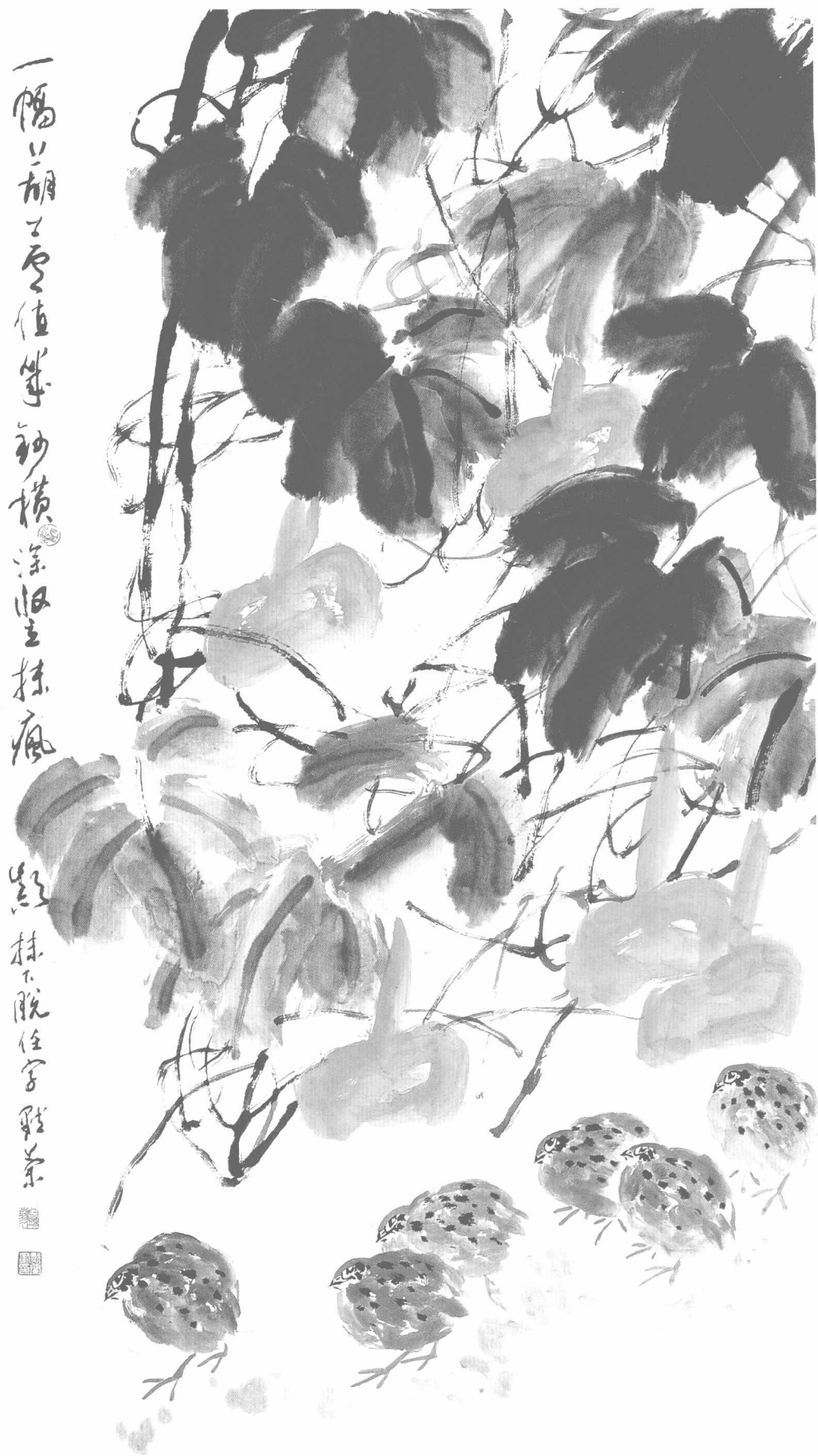
© 葫芦 2007年 纸本 180cm × 92cm