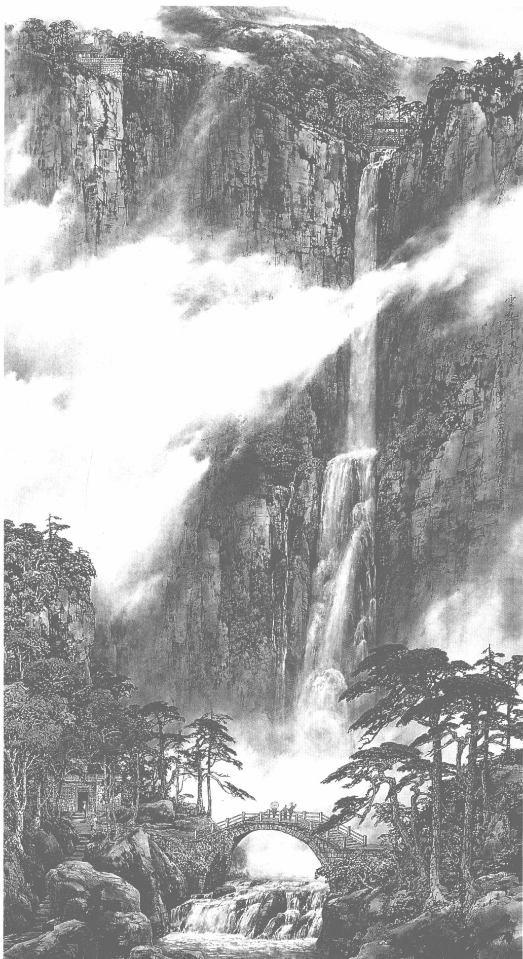
© 云起千丈岩 2007年 纸本 180cm × 97cm