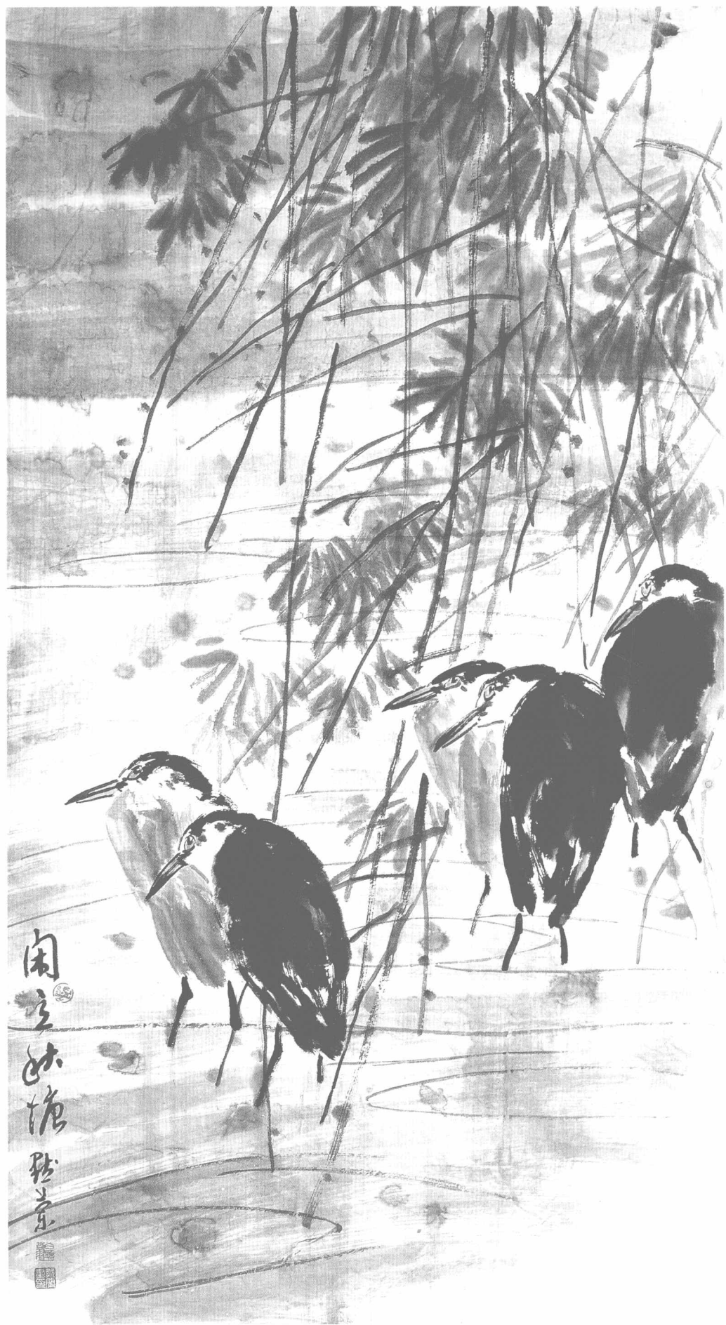
© 闲立秋塘 2008年 纸本 180cm × 92cm