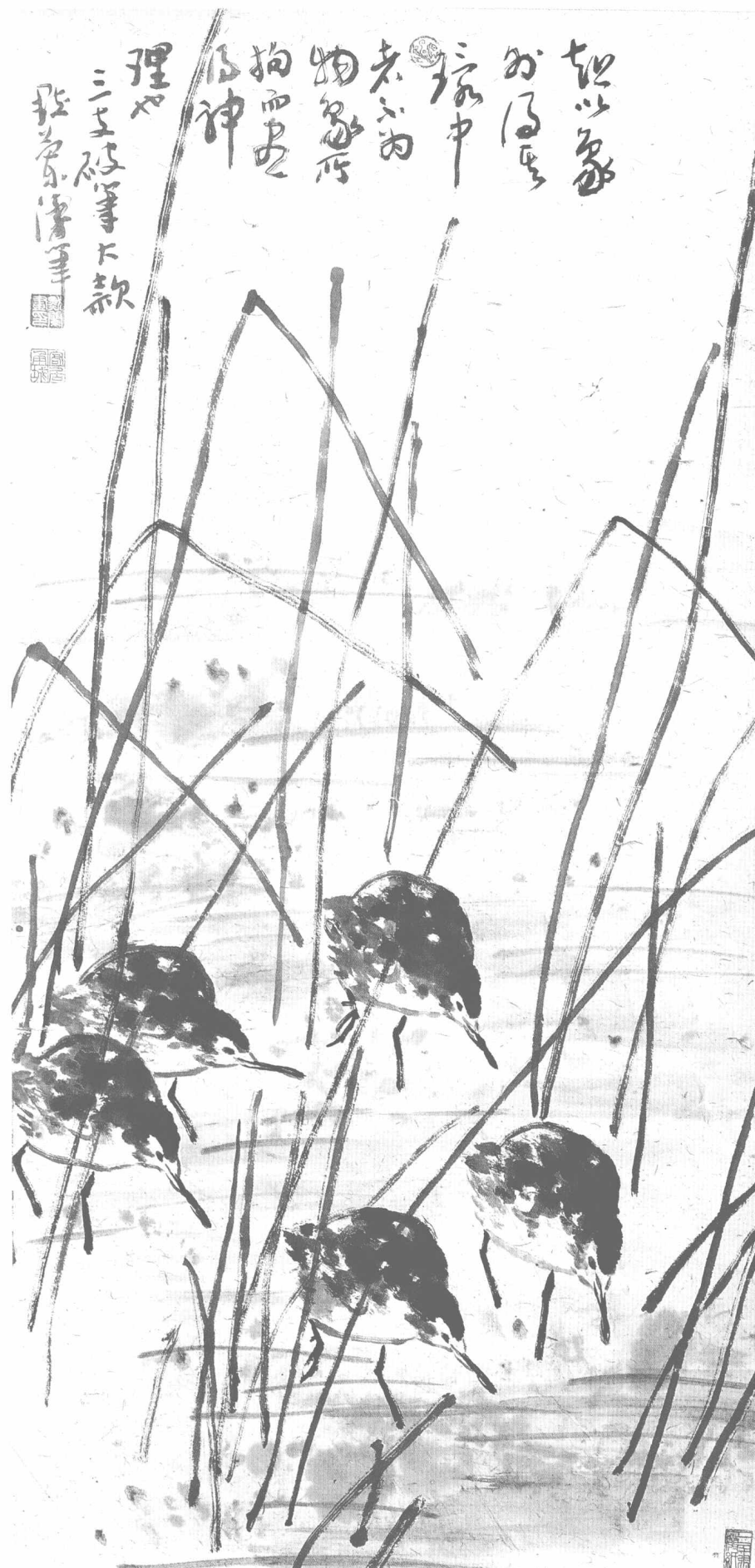
◎ 觅食 2004年 纸本 135cm × 63cm