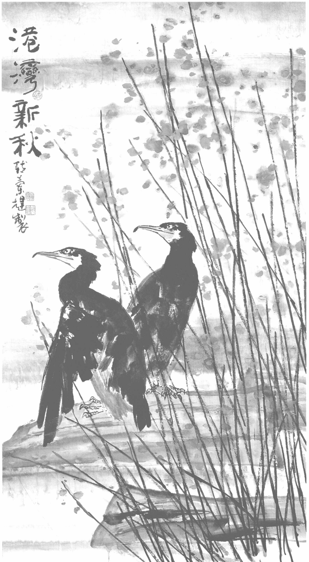
© 港湾新秋 2007年 纸本 180cm × 92cm