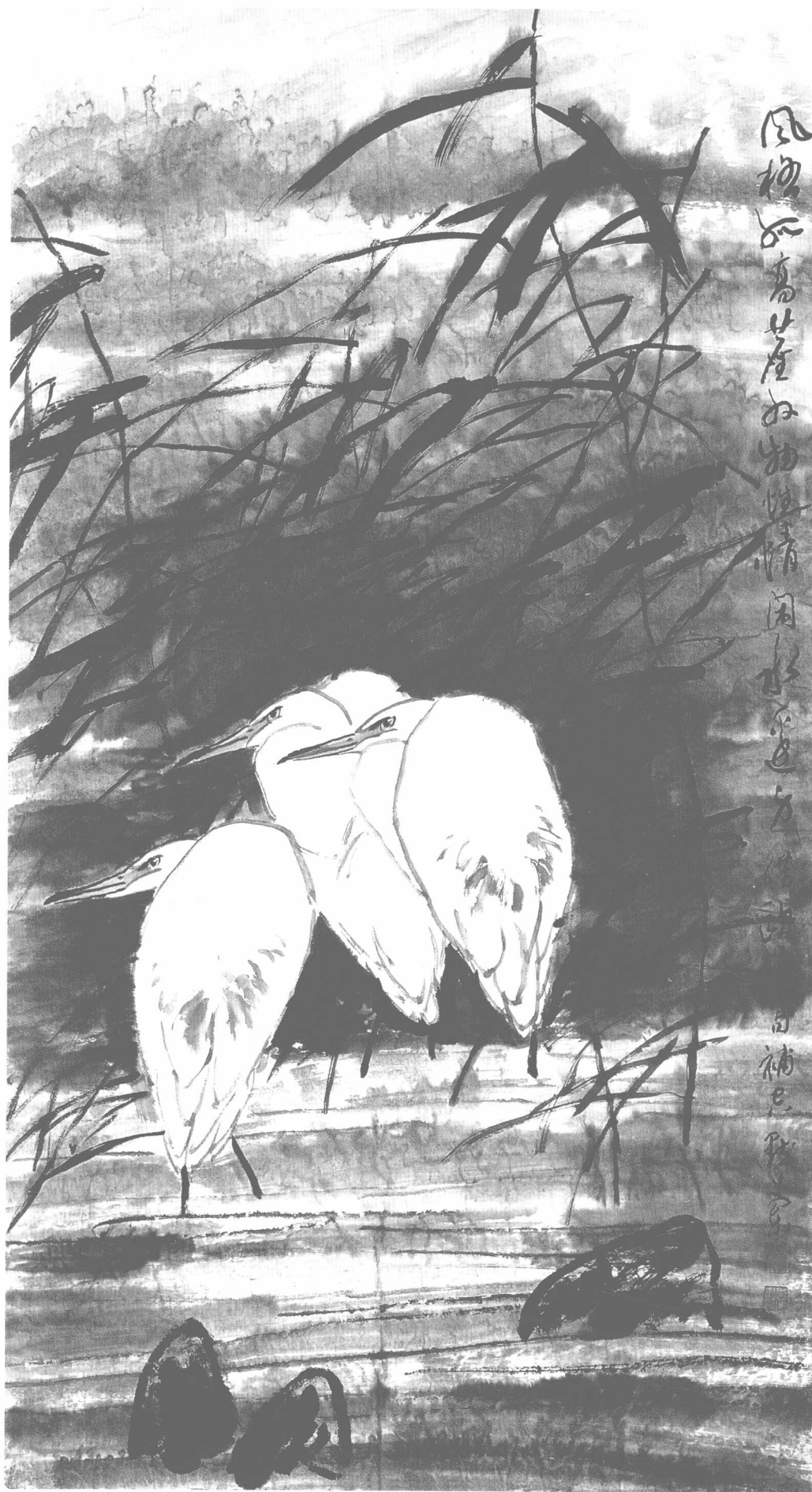
◎ 寒苇鹭影 2008年 纸本 180cm × 92cm