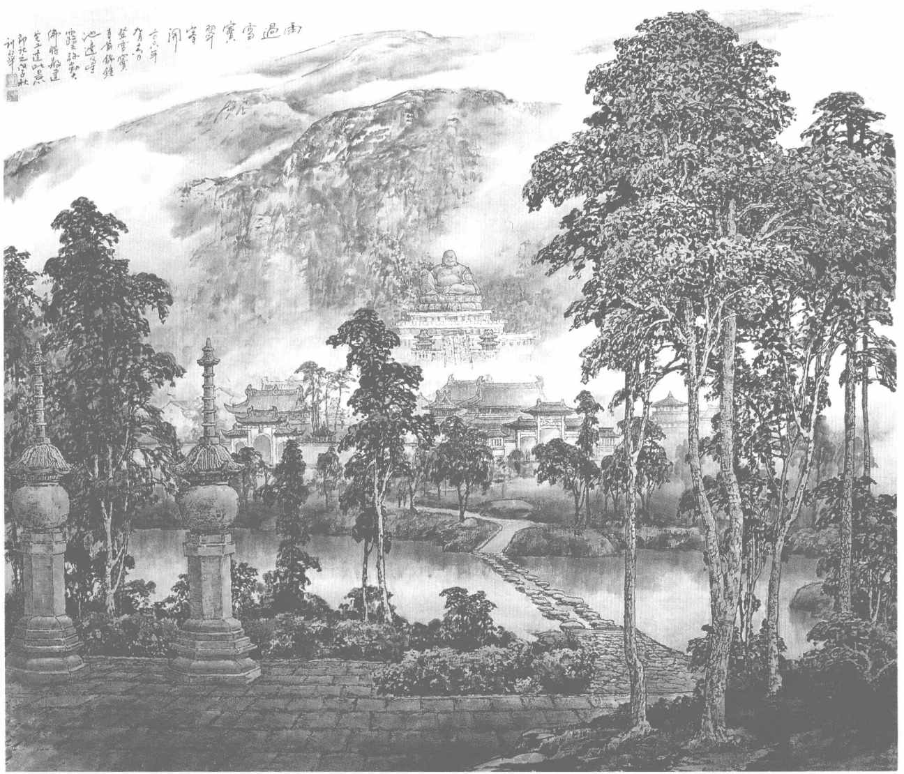
© 雨过雪霁翠峰开 2008年 纸本 112cm × 97cm