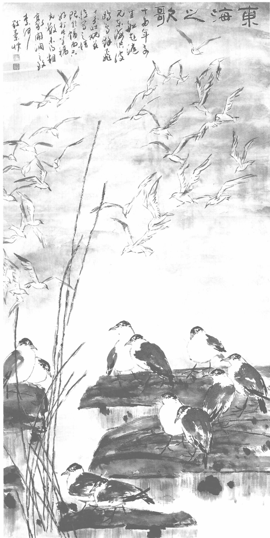
© 东海新歌 2007年 纸本 247cm × 122cm