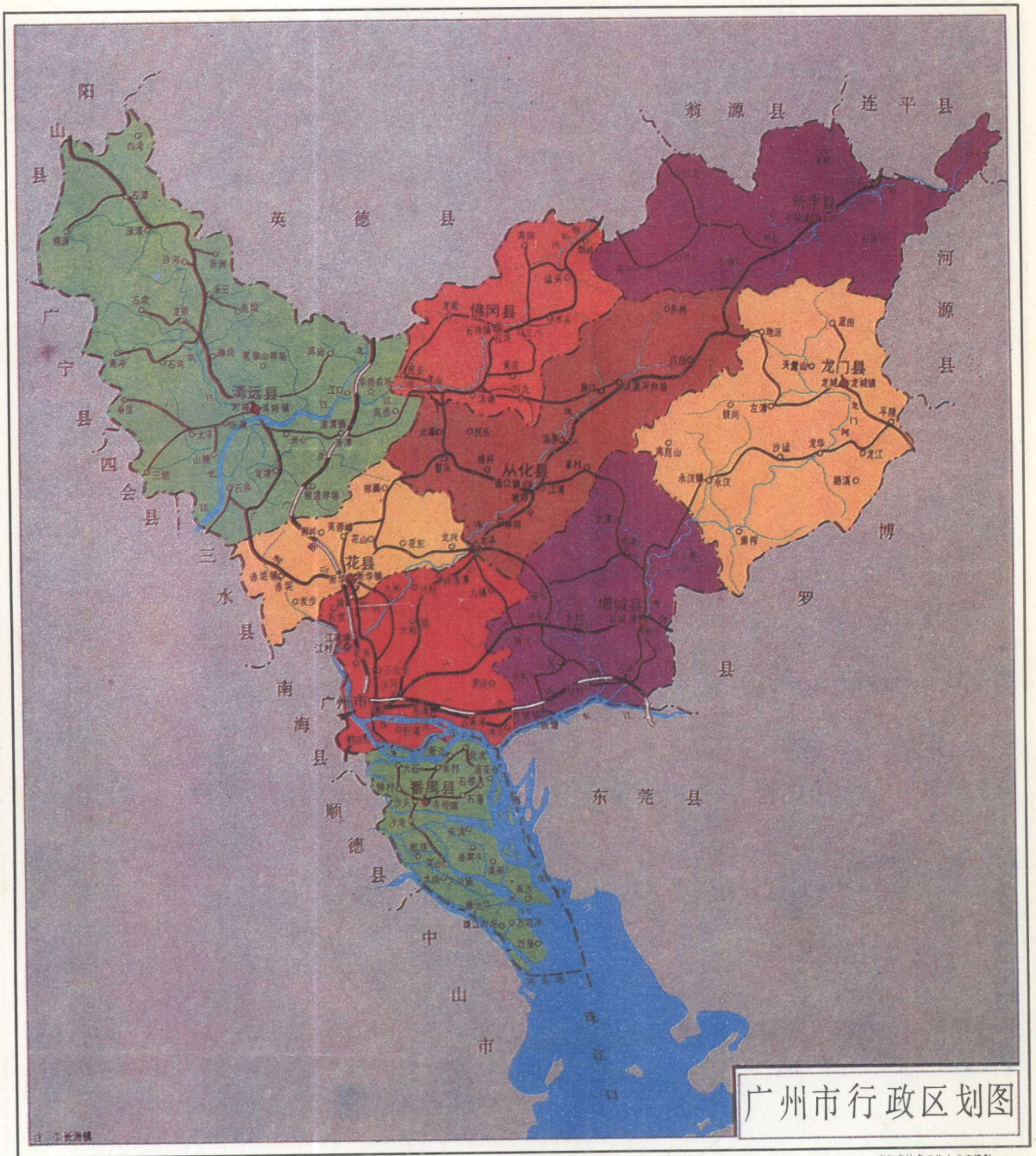
广州市行政区划图