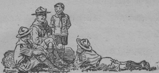
圖二. 貝登堡向少年們敘述他童年的故事

我在幼童軍年齡的時代，很喜歡注意各街中守衛警察的衣領上所標的號碼。同時注意他們每天什麼時候在何處值班維持公安秩序。積之漸久，我能記得許多警察的號碼和守衛的時地。