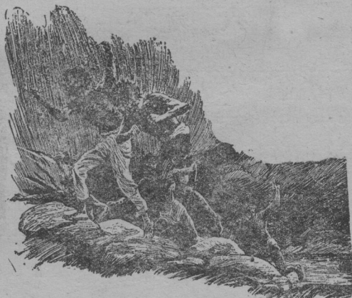
圖三 無數的黑影子如飛奔逃前山去了