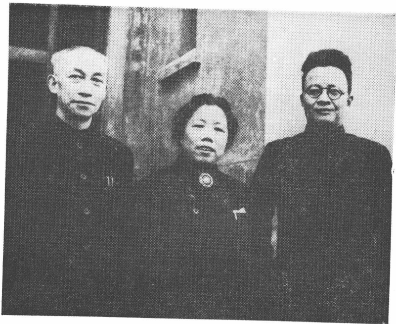
吴玉章同志与邓颖超、秦邦宪同志抗日战争时期 在重庆。