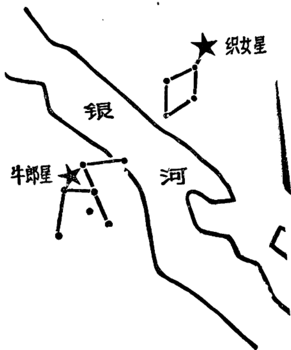
图一：牛郎星和織女星隔銀河相对

郎、織女划成的那条天河，就有一千亿个以上密集的星星，比现在地球上的人口多三、四十倍。因为它们离地球太远，所以人的肉眼不能辨出个数，只能看到星星汇成的一条乳白色的光带。“天河”以外的星球，更是多得无法统计。