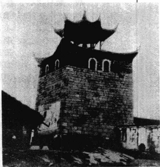
太平天国时期贵州普安回民起义的碉楼

1853年，太平军攻占南京，出师北伐，震动京师。张之洞已不可能在京城静心读书，是年夏天，乘舟南下，长途跋涉，1854年春回到父亲身边。年底，贵州农民响应太平军，围攻兴义府城。张铎率部固守，连张之洞兄弟也参加了守城之役，在形势最危急