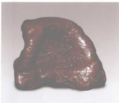
包浆浓厚的明代灵璧石 高15厘米