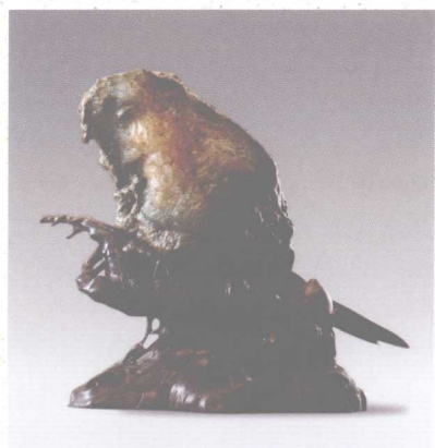
內蒙戈壁瑪瑙石“鸚鵡” 高28厘米