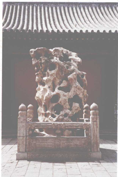
曲阜孔庙陈供的明代太湖石 高250厘米