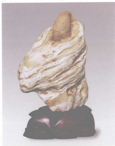
福建九龙璧“气宇轩昂” 高38厘米