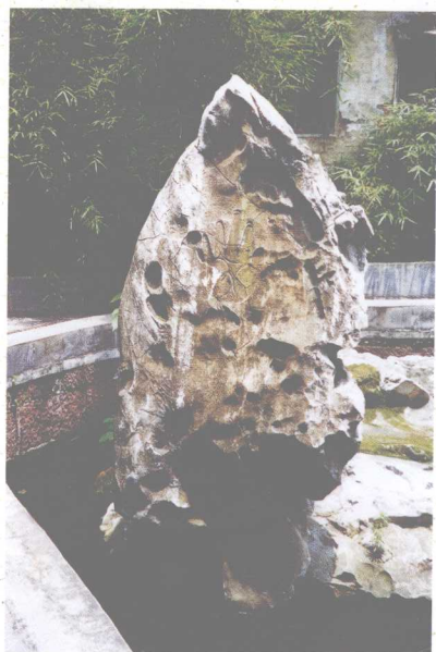
广州药洲遗址供置的 五代南汉国太湖石“仙掌石” 高150厘米