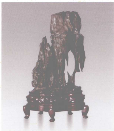
南京栖霞石颇具古典意味 高40厘米