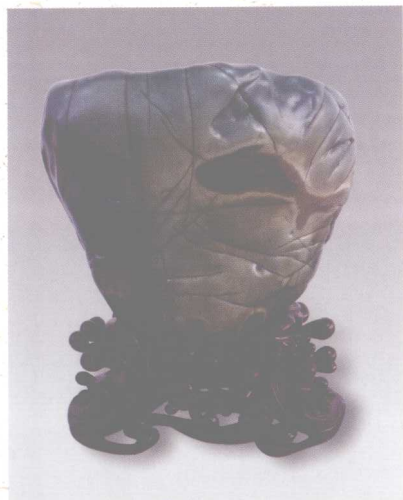
广西彩陶石“鱼翔浅底” 高45厘米

观赏石的鉴评要素应能体现观赏石的完整性、美观性、生动性、神韵性为总的原则。具体分为基本要素和辅助要素。基本要素包括形态、质地、色泽、纹理、意韵。辅助要素包括命题、配座。按照得分高低分为特级、一级、二级、三级四等级。