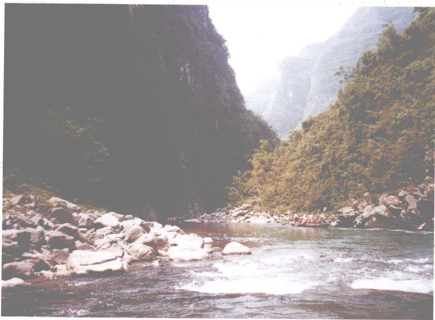
长江小三峡是长江卵石产地