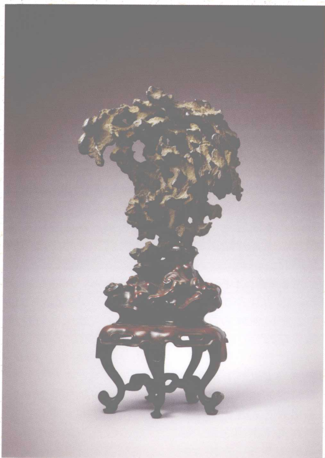
清代铁矿石“小玲珑”