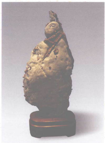
台灣鐵釘石“千古一帝” 高30厘米