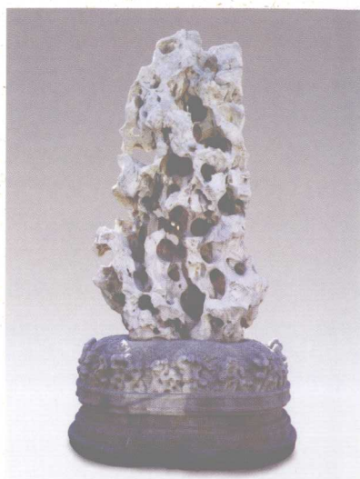
北京頤和園清代太湖石“石丈” 高320厘米