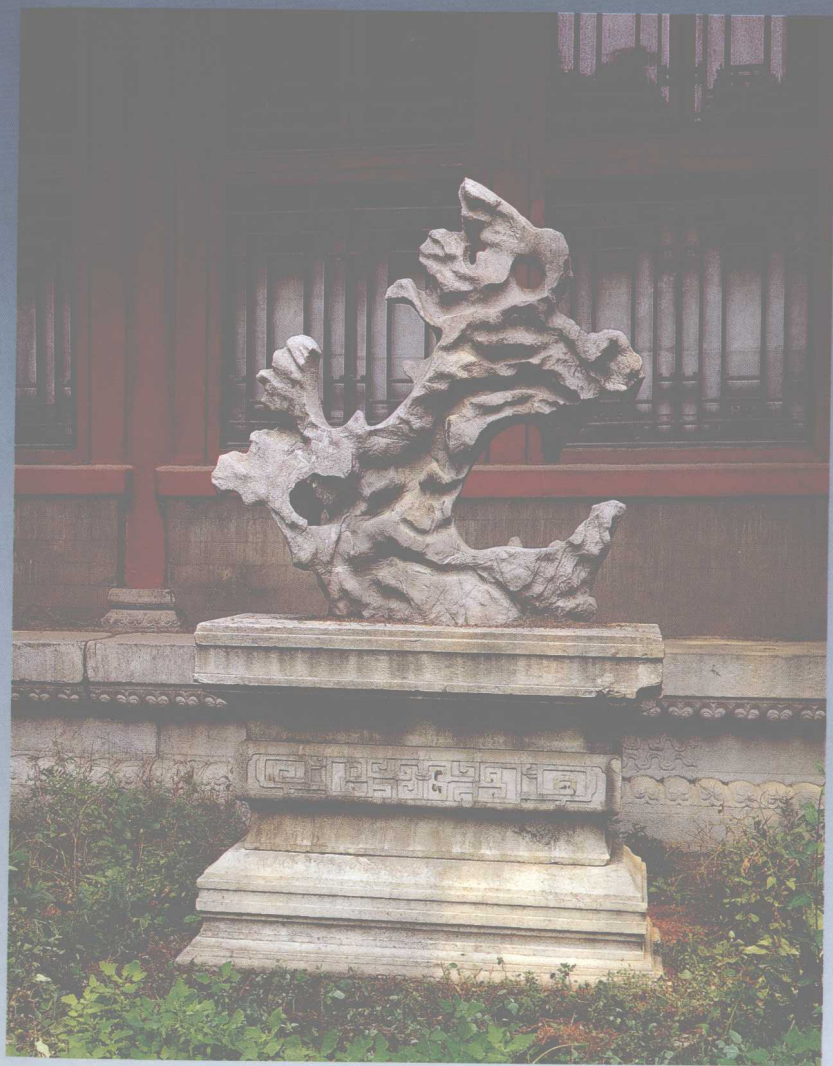
北京故宫宁寿宫花园供置的清代灵璧石