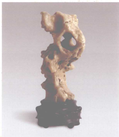
具有古典美感的内蒙戈壁石 高12厘米

一种“瘦、漏、透、皱”抽象造型的时候，古典赏石与当代新派赏石在质地、色彩上的认知差异巨大，反映了两种观念的碰撞：古典赏石质地多属于碳酸岩类，新派赏石多属于硅质岩类。也就是说，古典赏石不重质地、不辨质地，以形式决定内容。新派赏石注重质地，以内容决定形式；古典赏石色彩单调沉敛，这也符合传统文人内省型的性格特征，而新派赏石色彩亮丽光鲜，这与当代人的生活多姿多彩以及高调张扬的外向型性格特征相仿佛。两者可谓貌合而神离。